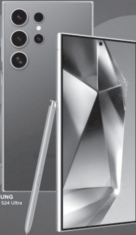
SAMSUNG Galaxy S24 Ultra