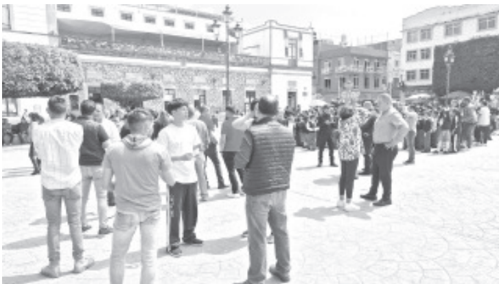
En punto de las 11:00 horas, inició el Simulacro Nacional 2024, evento al que se sumaron empleados municipales y funcionarios públicos del #GobiernoDeLaHeroica.

El #GobiernoDeLaHeroica bajo la indicación del alcalde Juan Antonio Ixtláhuac se sumó a este Simulacro Nacional, en memoria de los fallecidos en los sismos acontecidos en 1985 y en el 2017, donde más de 3 mil 500 personas perdieron la vida y a fin de hacer conciencia sobre el correcto actuar ante un siniestro de este tipo.