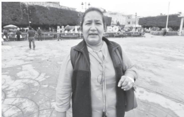
La Tenencia de Coatepec de Morelos conocido como "San Pancho" alista lo que serán sus fiestas patrias para conmemorar el natalicio del Generalísimo Don José María Morelos y Pavón.