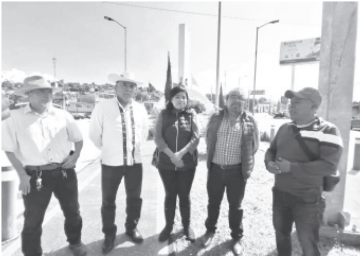
A través del proyecto Visión Cero que encabezan ambientalistas locales, se pretende reforestar alrededor de 1000 arbolitos de la especie "palo verde" en el circuito de Avenida Revolución.

H. Zitácuaro Michoacán, 19 de septiembre de 2024.- Por: Guadalupe Solache Rebollo. A través del proyecto Visión Cero que encabezan ambientalistas locales, se pretende reforestar alrededor de 1000 arbolitos de la especie "palo verde" en el circuito de Avenida Revolución.