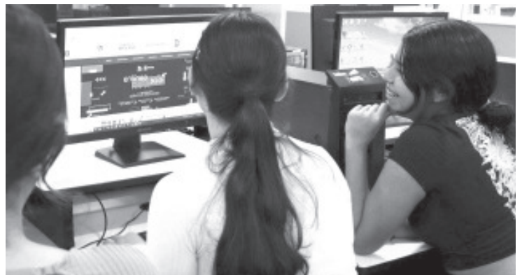
A partir de este ciclo escolar 2024-2025, los pagos para 241 trámites y servicios escolares para el ingreso y egreso se pueden realizar a través de la plataforma digital puesta en marcha en planteles educativos de 23 instituciones de nivel medio superior y superior de Michoacán.

Detalló que, en esta nueva modalidad, los pagos para procesos de credencialización, solicitud de constancias de estudios, memorándum de calificaciones, certificados parciales y totales, cursos, talleres, y trámites de titulación, entre otros.