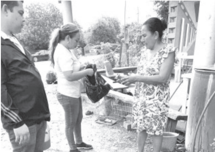
Garantizar el cuidado de la salud de los pobladores las localidades El Gusano, Montecillos y Corral Viejo, pertenecientes al municipio de Huetamo, las cuales sufrieron afectaciones por las lluvias, es prioridad de la Secretaría de Salud de Michoacán (SSM).

Morelia, Michoacán, 8 de septiembre de 2024.- Garantizar el cuidado de la salud de los pobladores las localidades El Gusano, Montecillos y Corral Viejo, pertenecientes al municipio de Huetamo, las cuales sufrieron afectaciones por las lluvias, es prioridad de la Secretaría de Salud de Michoacán (SSM).