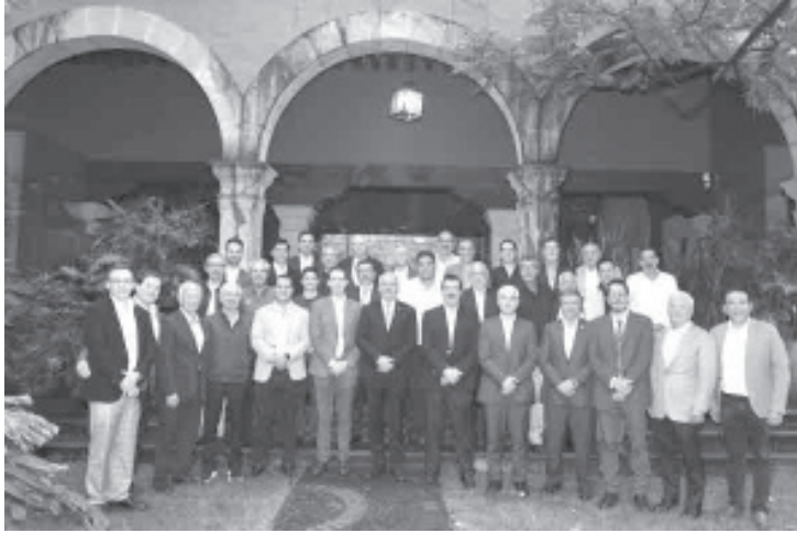
Al coincidir que es fundamental trabajar unidos por el desarrollo del estado, empresarios michoacanos reconocieron avances y respaldaron la administración que encabeza el gobernador Alfredo Ramírez Bedolla.

Morelia, Michoacán, 10 de septiembre de 2024.- Al coincidir que es fundamental trabajar unidos por el desarrollo del estado, empresarios michoacanos reconocieron avances y respaldaron la administración que encabeza el gobernador Alfredo Ramírez Bedolla.