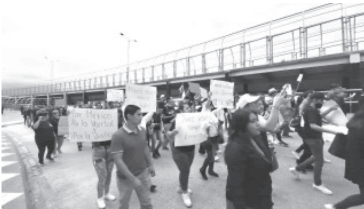
Casi 300 personas aproximadamente, entre trabajadores del Poder Judicial, jueces, abogados y estudiantes participaron en la marcha para protestar contra la reforma.