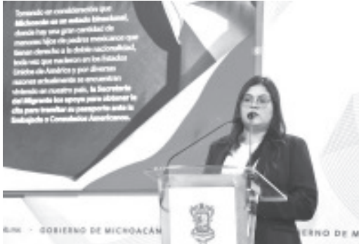
La Secretaría del Migrante (Semigrante), con la Unidad de Beneficios Federales de la Embajada de Estados Unidos en México, brinda acompañamiento para tramitar la pensión estadounidense, para personas que hayan trabajado en el vecino país con un número de seguro social válido por más de 10 años.

Para mayor información, las personas interesadas pueden acudir a la Semigrante, ubicada en la calle Colegio Militar 230, en la colonia Chapultepec Sur, en Morelia, o comunicarse al número telefónico 443 322 9100 extensión 112, de 9:00 a 15:00 horas, de lunes a viernes.