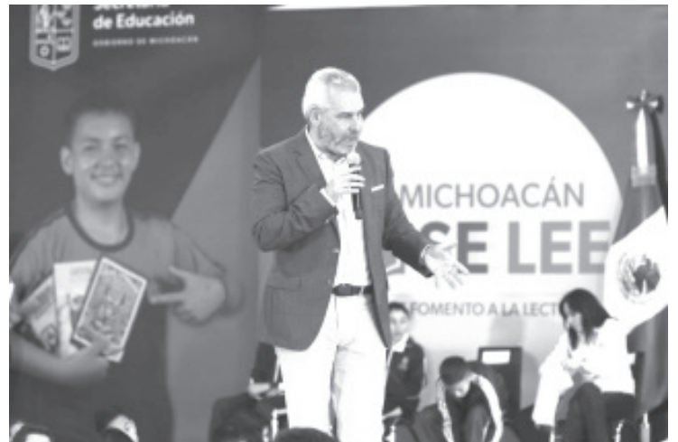
Por segundo año consecutivo, el gobernador Alfredo Ramírez Bedolla inició la entrega de tenis a más de 200 mil alumnas y alumnos de escuelas secundarias públicas de los 113 municipios de Michoacán.

Además, informó que este año con el programa "En Michoacán se Lee" también se entregarán 200 mil libros de lectura para primarias y secundarias de zonas prioritizadas en todas las regiones de Michoacán.