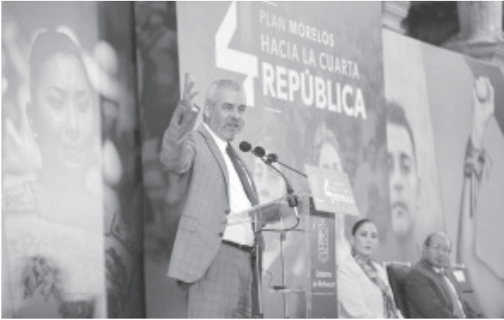
El gobernador Alfredo Ramírez Bedolla presentó el Plan Morelos, el cual contempla la propuesta de cinco reformas a la Constitución de Michoacán.

- Propone también homologar reformas al Poder Judicial local, justicia, no reelección y gobierno digital