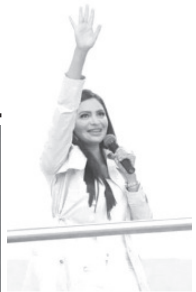
Frente a la violencia de la que ha sido objeto en los últimos días, la senadora Araceli Saucedo Reyes presentará una denuncia ante la Fiscalía General de la República por amenazas, daño a la propia imagen y violencia debido a las agresiones contra su persona y familiares.

-Araceli Saucedo, víctima de violencia política en razón de género contra la mujer -Frente a la violencia de la que ha sido objeto en los últimos días, este lunes la senadora presentará denuncia ante la Fiscalía General de la República por amenazas, daño a la propia imagen y violencia -Es tiempo de las mujeres que vive México estas conductas inadmisibles