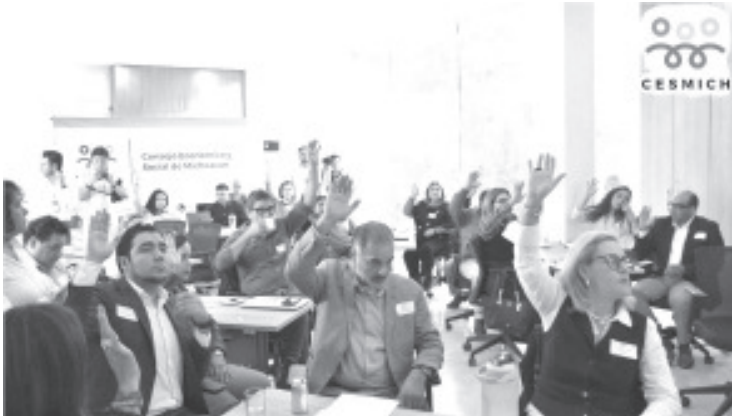
El Consejo Económico y Social de Michoacán (Cesmich), presentó ante el Congreso del Estado la séptima iniciativa que se elabora desde la sociedad civil, en beneficio precisamente de la sociedad. La que se entregó hoy, se refiere al Seguro de Desempleo y Protección de las trabajadoras domésticas.

Es la séptima iniciativa que se presenta ante el Congreso del Estado, elaborada por consejeros de la Sociedad Civil