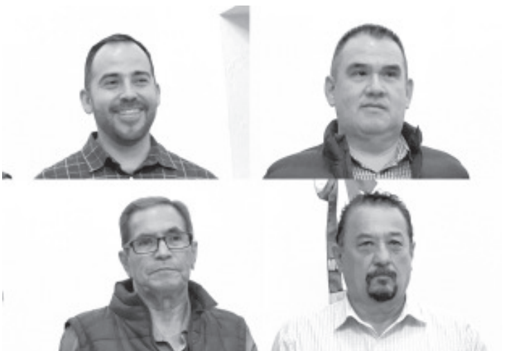
El Presidente Municipal, Juan Antonio Ixtláhuac Orihuela anunció otro grupo de funcionarios que habrán de conformar el gabinete local.

El alcalde adelantó que van muy adelantadas las convocatorias para la elección de calles en mal estado que se van a atender, también en la que se concursan las direcciones de educación, cultura, turismo y deporte.