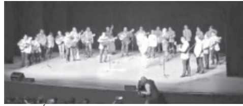
CUMPLIÓ 40 ANIVERSARIO LA RONDALLA CLAVELITOS Y Con un gran lleno y ÉXITO Se presentaron en el TEATRO JUÁREZ. «ORGULLO Y TRADICIÓN DE ESTA HEROICA» ¡FELICIDADES A TODOS!