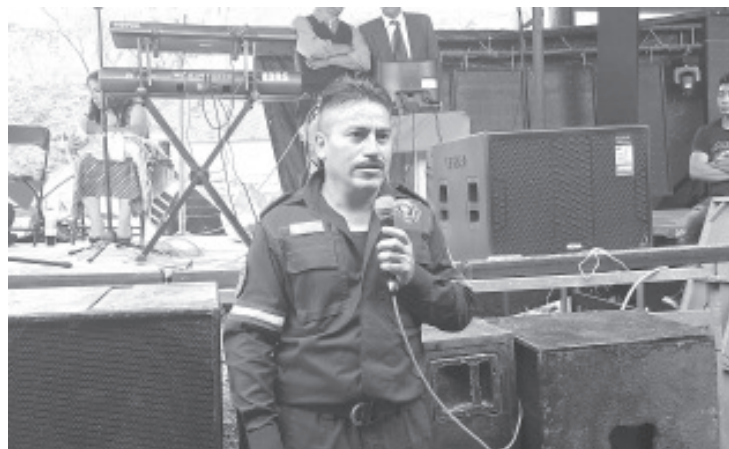
Con diferentes actividades, el Cuerpo de Bomberos de Zitácuaro celebró el 22 de agosto "Día del Bombero" y refrendó su compromiso con toda la población del municipio y sitios vecinos.