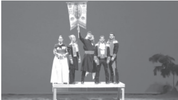
Por primera vez se presentó en esta ciudad, la obra teatral: Dios Visita la Suprema Junta Nacional Americana.