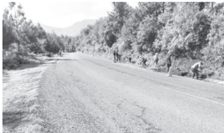
Seguimos dando mantenimiento, concejo de Autogobierno y pueblo consciente de la comunidad Mazahua de Crescencio Morales a la carretera federal Ciudad de México-Toluca-Zitácuaro, donde esta completamente abandonada por parte la Secretaria de Comunicaciones y transportes del gobierno federal.