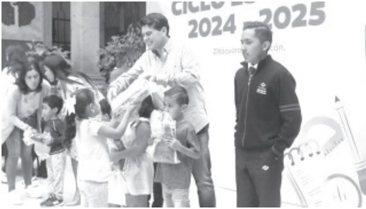
Previo al inicio del ciclo escolar, el Presidente Municipal Juan Antonio Ixtláhuac Orihuela entregó uniformes escolares a alumnos de diferentes instituciones educativas del municipio.

- Durante el inicio de este ciclo escolar entregará un total de 300