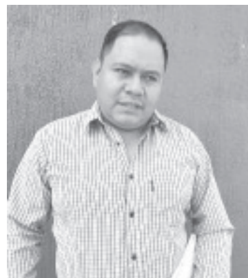
Con un total de 40 alumnos en el primer semestre, arrancó esta semana el plantel COBAEM con extensión en la tenencia de Curungueo.

Agregó que se pretende que esta extensión del COBAEM se quiere hacerla crecer y que en unos años sea una de las primeras opciones para que jóvenes de esta tenencia quieran estudiar su nivel medio superior..