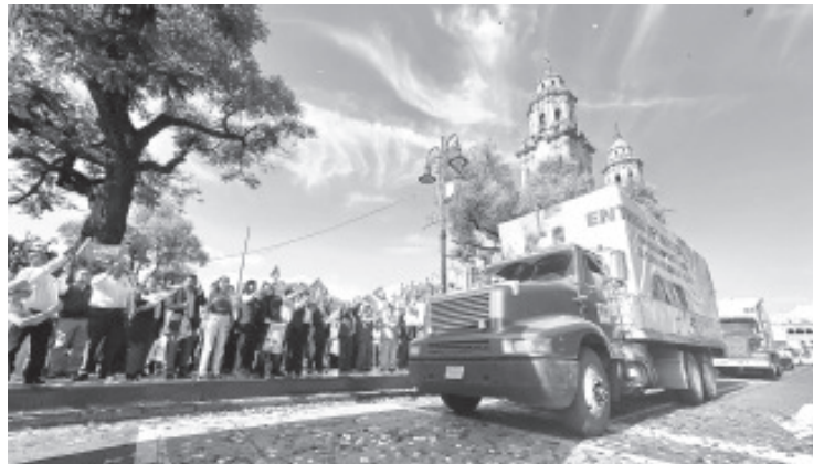
La secretaria de Educación del Estado, Gabriela Molina Aguilar, encabezó el arranque de entrega de más de 6 millones de libros de texto gratuitos para más de 900 mil estudiantes de nivel básico, proceso que coloca a Michoacán en cuarto lugar nacional por su organización. Además, por primera vez se contemplan ediciones en 20 lenguas originarias.

Previo al banderazo de salida de las unidades cargadas de libros gratuitos, que por primera vez contemplan ediciones en 20 lenguas originarias, el maestro José Rubio López, jefe de Sector, habló de la significativa mejora en la calidad de los materiales educativos, en los cuales participaron más de 40 docentes michoacanos.