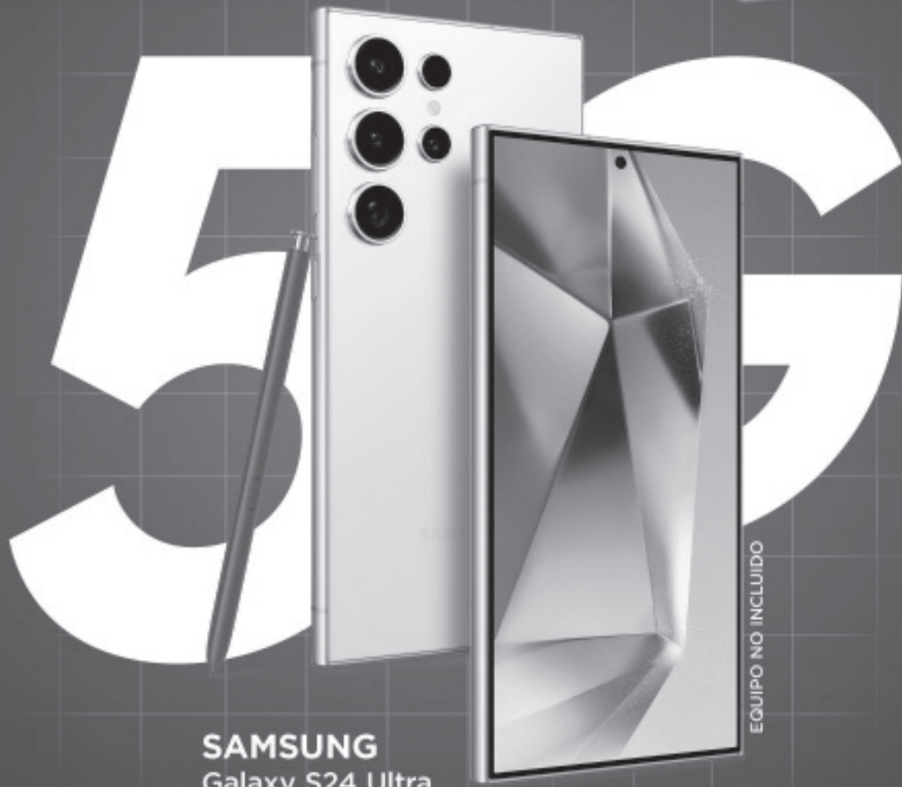
SAMSUNG Galaxy S24 Ultra