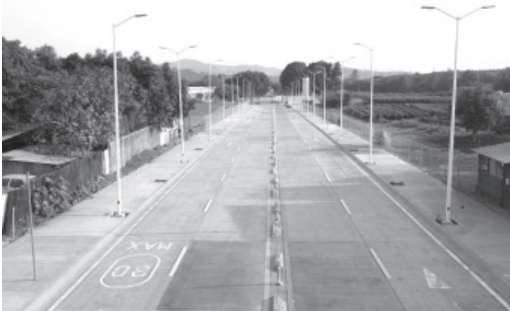
El Gobierno de Michoacán ha invertido 3 mil 500 millones de pesos en obra convenida con los municipios, realizando más de mil obras de infraestructura por todo el estado, informó la Secretaría de Comunicaciones y Obras Públicas (SCOP).

Estas acciones forman parte de los avances en infraestructura que entregó el mandatario a la presidenta electa Claudia Sheinbaum Pardo, donde además presentó seis proyectos de obra, con el propósito de que sean apoyados con recursos federales para su ejecución.