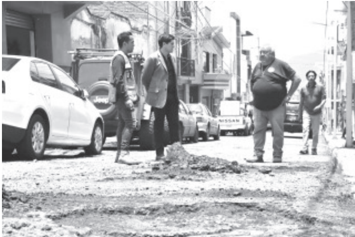
En respuesta a solicitudes ciudadanas y como parte de la atención inmediata a los daños causados por las lluvias en distintas arterias de la ciudad, el gobierno de Toño Ixtláhuac lleva a cabo un intenso programa de bacheo en todo el municipio.

-El plan es emergente para mitigar daños causados por temporada de lluvias. En los próximos meses iniciará reconstrucción de calles.