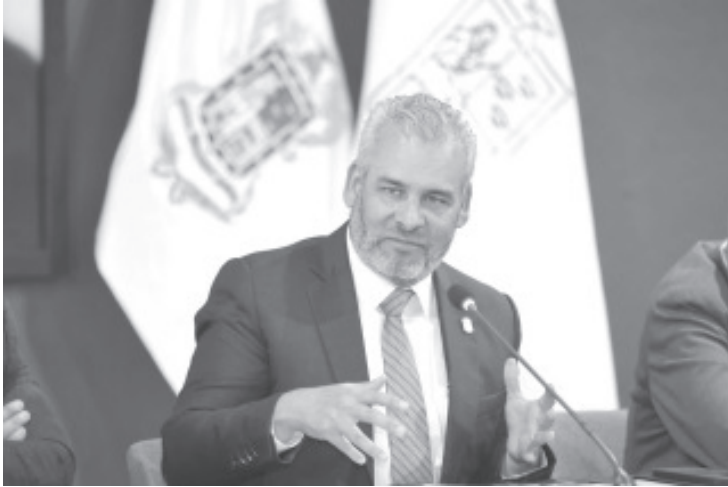
El gobernador Alfredo Ramírez Bedolla informó que la estrategia conjunta para el combate a la violencia y a las actividades ilícitas en Michoacán avanza a paso firme y muestra de ello es el aseguramiento de mil 745 máquinas tragamonedas en siete regiones del estado.

Por lo que reiteró el compromiso del Gobierno de Michoacán para reforzar las acciones de seguridad en todo el territorio estatal a fin de atender y erradicar cualquier situación que altere la paz de las y los ciudadanos.