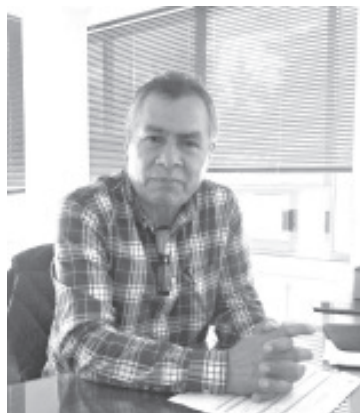
El próximo 22 de agosto, en el centro de la ciudad, se llevará a cabo la FERIA Nacional del Empleo por la inclusión laboral de la juventud. La actividad se realizará en la Plaza Cívica Licenciado Benito Juárez, en un horario de 9:00 de la mañana a 3:00 de la tarde.

posibilidad de ser contratados. El funcionario del SNE invitó a buscadores y empresas a ser parte del evento, para ello se deben presentar en las oficinas del empleo, que están en la calle Cuauhtémoc Oriente 19, frente al Panamericano.