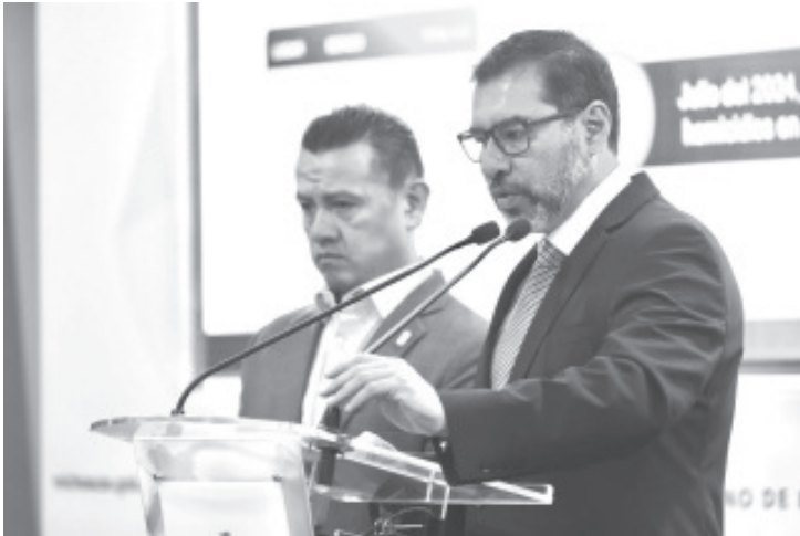
Con 116 casos, julio de 2024 fue el mes con menos homicidios dolosos en los últimos seis años, destacó el secretario de Seguridad Pública, Juan Carlos Oseguera Cortés, tras dar a conocer que en el año 2018 la incidencia se colocaba hasta en 175 casos por mes.

Detalló que, de acuerdo a la tasa por cada 100 mil habitantes, Michoacán se coloca en el sitio 10 a nivel nacional, por debajo de entidades como Colima, Guanajuato, Baja California, Morelos y Quintana Roo, entre otras más.