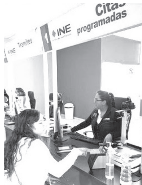
El Módulo de Atención Ciudadana 160351, ubicado en la ciudad de Zitácuaro, Michoacán, en el Boulevard Suprema Junta Nacional Americana # 35, colonia INFONAVIT, ampliará su horario de atención de lunes a viernes en horario corrido de 8 de la mañana a 8 de la noche y los sábados de 8 de la mañana a 3 de la tarde.

Con la ampliación a un doble turno a partir del 1 de septiembre de 2024, en el Módulo de Atención Ciudadana de Zitácuaro, el INE refrenda su compromiso con las y los ciudadanos de garantizar su derecho a la identidad a través de la expedición de la Credencial para Votar.