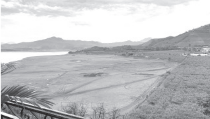
De acuerdo a la Comisión Nacional del Agua (CONAGUA) a través del monitoreo de las principales presas del país, la Presa del Bosque registra el 49.93% de su capacidad total, por lo que apenas está a punto de alcanzar la mitad.

- Vecinos reportan que canales han llegando con poco líquido