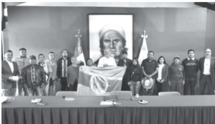
El gobernador Alfredo Ramírez Bedolla reiteró su respaldo al autogobierno indígena en reunión con autoridades comunales de San Matías el Grande, del municipio de Hidalgo, localidad del pueblo otomí que recientemente logró acceder a este derecho constitucional tras procedimiento jurídico.