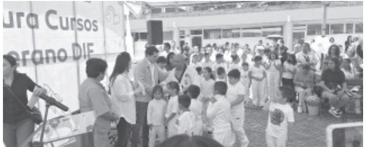
H. Zitácuaro Michoacán, 09 de agosto de 2024.- Por: Guadalupe Solache Rebollo. Un total de 390 participantes participaron en los cursos de verano del DIF Municipal 2024, y recibieron su reconocimiento.

- De manos de autoridades, participantes reciben su reconocimiento