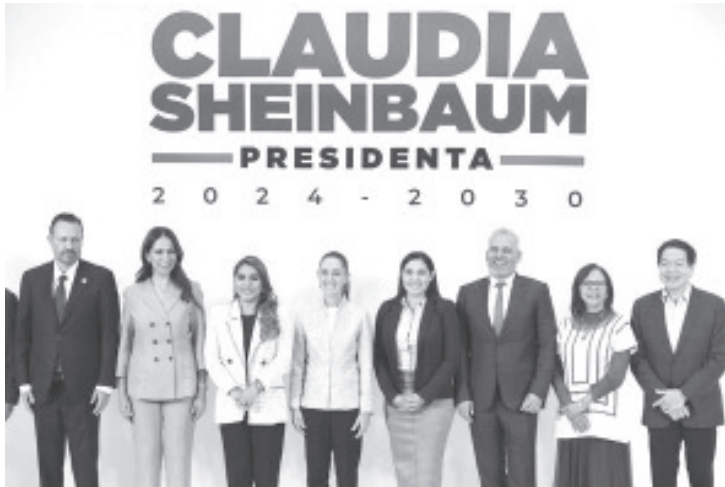
El gobernador Alfredo Ramírez Bedolla presentó a la presidenta electa Claudia Sheinbaum Pardo, proyectos de infraestructura hidráulica, carretera y de movilidad para el desarrollo de Michoacán.