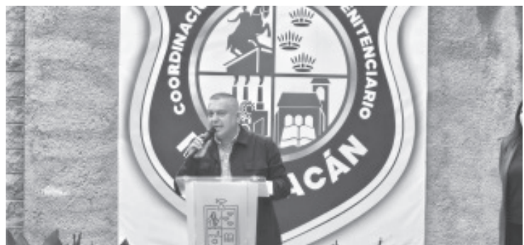
Con el lema “Verano en acción, exploradores de la diversión”, el curso de verano 2024 de la Coordinación del Sistema Penitenciario del Estado dio inicio a diversas actividades para cien niñas y niños, familiares de trabajadores de esta institución.

Durante tres semanas, las niñas y niños participarán en actividades de natación, rapel, pista de obstáculos, fútbol, taekwondo, box, primeros auxilios, inteligencia emocional, conocimiento de la naturaleza; además de recibir clases de inglés, Lengua de Señas Mexicana e instrucción sobre educación vial y derechos de la niñez, entre otras más que les serán impartidas en las instalaciones del Instituto de Capacitación Penitenciaria