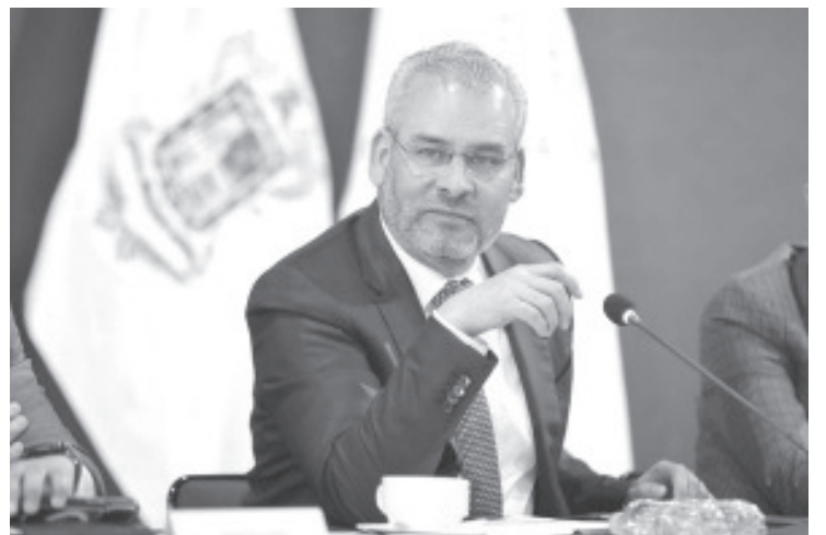
El pasado 7 de mayo se publicó en el Periódico Oficial del Estado el decreto con el que se crea la Casa de las Artesanías de Michoacán como organismo público descentralizado del Gobierno estatal.

El gobernador enfatizó que las y los artesanos son parte importante del desarrollo productivo y económico de Michoacán y por ello, la administración estatal continuará la ruta de apoyo a quienes con sus productos mantienen la identidad cultural de cada región.