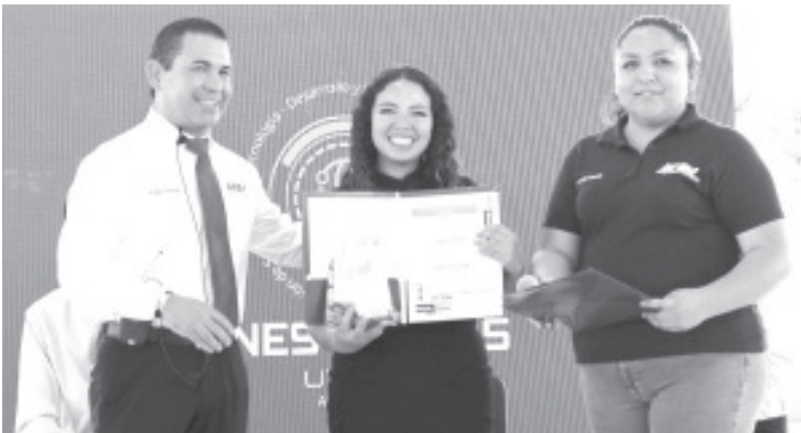
Si estudias en alguna de las universidades tecnológicas o politécnicas de Michoacán, a partir del ciclo escolar 2024-2025 podrás obtener doble titulación universitaria a lo largo de tu carrera, anunció el Instituto de Educación Media Superior y Superior del Estado (Iemssysem).

Actualmente en las cuatro instituciones educativas ubicadas en Morelia, Maravatío, Uruapan y Lázaro Cárdenas se encuentran abiertos sus procesos de entrega de fichas y de inscripciones, por lo que las y los interesados pueden consultar las fechas y requisitos de ingreso en: https://iemssysem.michoacan.gob.mx/oferta-educativa/ .