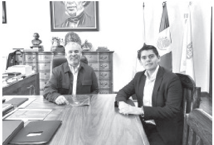
Alfredo Ramírez Bedolla, gobernador de Michoacán y el presidente municipal Juan Antonio Ixtláhuac, sostuvieron un encuentro para revisar diversos temas que mejorarán la vida de los zitacuarenses.

Toño Ixtláhuac reiteró su agradecimiento al titular del ejecutivo estatal, por su incondicional respaldo para consolidar estos grandes proyectos que integran la inversión más importante en la historia del municipio, la cual ya está en marcha con la ampliación de la planta chilena ARAUCO, generando miles de empleos, con un recurso por encima de los 200 millones de dólares.