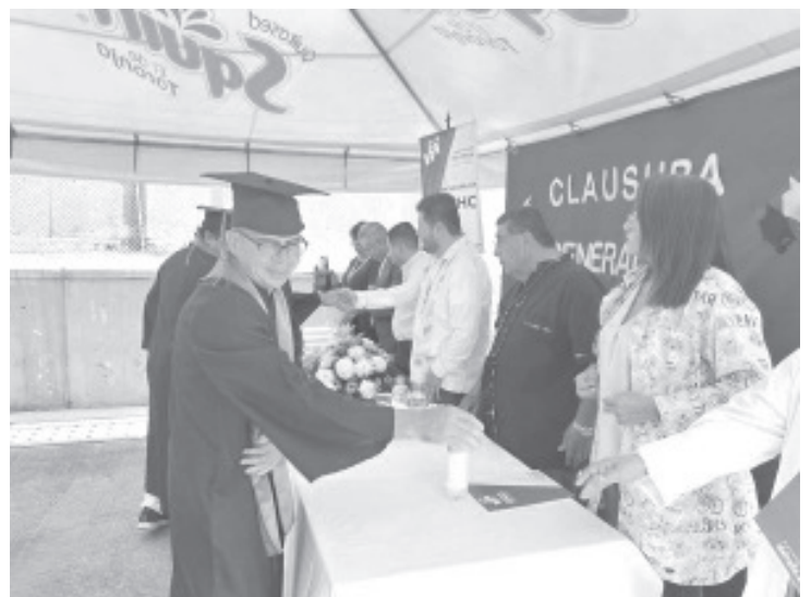
Derivado de los convenios de colaboración que la Coordinación del Sistema Penitenciario tiene con instituciones educativas públicas y privadas, 236 personas privadas de la libertad en 10 penales del estado y jóvenes en proceso de internamiento en la Unidad Especializada para adolescentes y Adultos Jóvenes terminaron sus estudios durante el ciclo escolar 2023-2024.