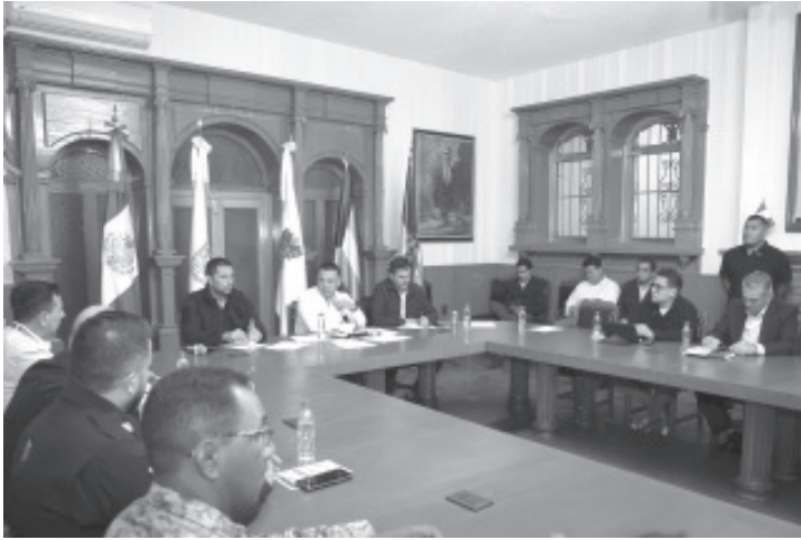
Las distintas dependencias estatales y federales están listas para atender cualquier contingencia ante la temporada de ciclones y huracanes.

Morelia, Michoacán, 17 de julio de 2024.- Las distintas dependencias estatales y federales están listas para atender cualquier contingencia ante la temporada de ciclones y huracanes.