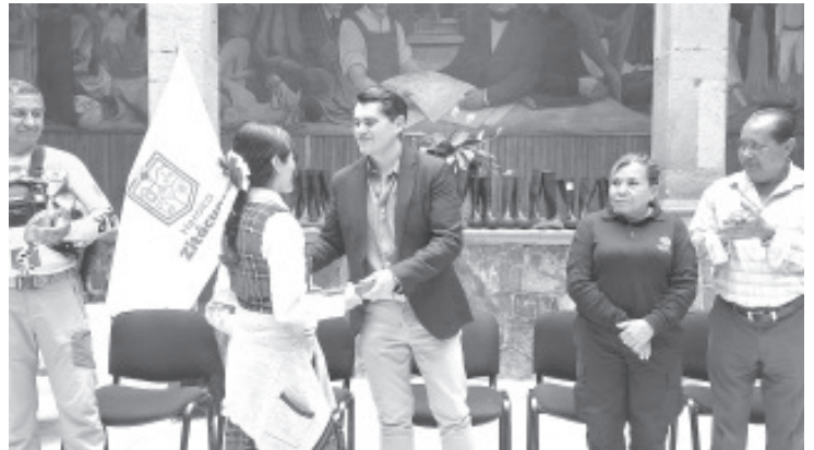
El Presidente Municipal, Juan Antonio Ixtláhuac Orihuela entregó apoyos a personal de diferentes áreas del gobierno municipal.

"Muchas ocasiones ambos papás trabajan y los menores se quedan solos en casa, al cuidado de un adulto mayor o incluso de alguna vecina, y esto hace que ocurran incidentes a veces graves".