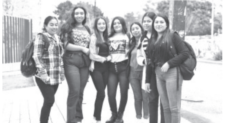
Con el propósito de que cada vez más jóvenes continúen su formación a nivel superior, la Secretaría de Educación del Estado (SEE) y el Instituto de Educación Media Superior y Superior (Iemssystem) dan a conocer la amplia oferta educativa que hay en Michoacán, para quienes concluyen su formación en preparatoria.

Otras opciones públicas son la Universidad Pedagógica Nacional (UPN), Universidad Politécnica de Uruapan (UPU), Instituto Michoacano de Ciencias de la Educación (IMCED), Universidad de la Ciénega del Estado de Michoacán (UCEMICH), Universidad Tecnológica de Morelia (UTM), Universidad Politécnica de Lázaro Cárdenas (UPLC), Universidad Intercultural Indígena de Michoacán (UIIM), Universidad Tecnológica del Oriente de Michoacán (UTOM) y Universidad Virtual del Estado de Michoacán (UNIVIM); algunos de ellos con más de una sede en la entidad.