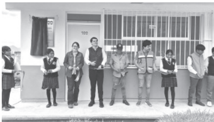
Con la construcción de un aula en el Telebachillerato 210 de Francisco Serrato, el Gobierno de Soluciones refrenda su compromiso de posicionar al municipio como líder en inversión educativa.

Cabe mencionar que son más de 100 domos hechos por la actual administración en toda la municipalidad, asimismo se han entregado aulas, módulos de baños, canchas, accesos, entre otros.