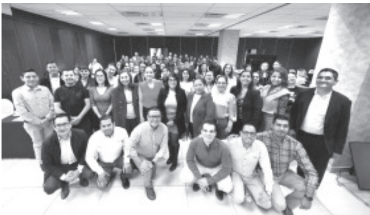
Mujeres de diversos municipios de Michoacán participaron en el taller “El Poder de la Participación Femenina”, que realizó la Secretaria de Promoción Política de la Mujer (PPM), del Comité Directivo Estatal (CDE) del Partido Acción Nacional (PAN).

- Mujeres de diversos municipios asistieron a la capacitación dirigida por la Secretaria de Promoción Política de la Mujer (PPM).