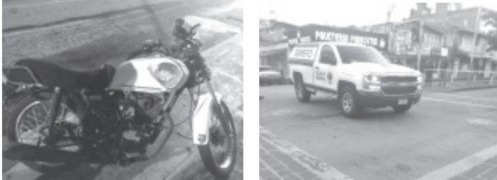
La mañana del domingo, un motociclista falleció tras ser atropellado en la intersección de la avenida Revolución y José Ma. Coss de esta ciudad. El incidente ocurrió alrededor de las 04:50 horas y el Heroico Cuerpo de Bomberos de Zitácuaro recibió la llamada de emergencia.

La motocicleta involucrada en el accidente era una Italika 150 de color blanco. Las causas del incidente aún se desconocen. Los bomberos se retiraron del lugar a las 06:35 horas.