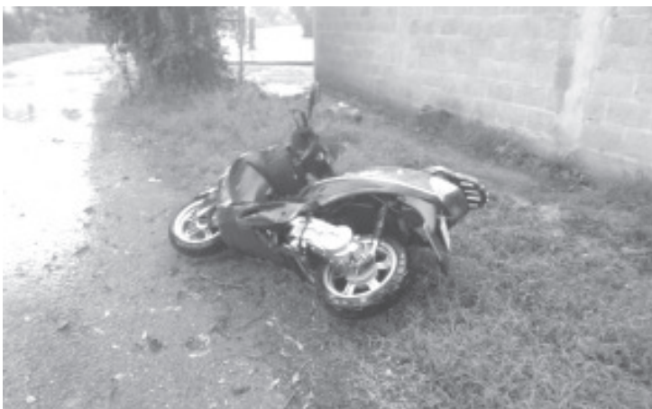
El incidente ocurrió el 14 de julio de 2024, comenzando a las 15:30 hrs y concluyendo a las 17:50 hrs, en la localidad de Las Rosas, a la altura del CAPEP "Martha Eugenia Manjarres Colín".

El Heroico Cuerpo de Bomberos de Zitácuaro reitera su compromiso con la seguridad y el bienestar de la comunidad. En caso de emergencia, se puede contactar a los bomberos a través de los siguientes números: 715 153 8742, 715 164 9432 y 715 100 8419.