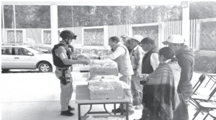
Con entrega de uniforme completo a la guardia comunal, poco a poco se va mejorando el servicio y el profesionalismo de esta guardia que desde tiempos inmemoriales tiene su existencia.