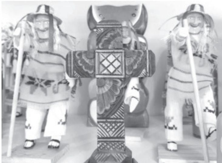
Michoacán se encuentra presente en el Festival Turístico de la Ciudad de México, plataforma en la que se promocionan las experiencias y atractivos de las siete regiones del estado: Morelia, Pátzcuaro, Uruapan, Zamora, Apatzingán, Playas de Michoacán y País de la Monarca.

El Festival Turístico de la Ciudad de México reúne este 2024 a 20 estados del país, entre los que se encuentra Michoacán, que del 11 al 14 de julio invitará a visitar el territorio y conocer porqué el estado es "el alma de México".