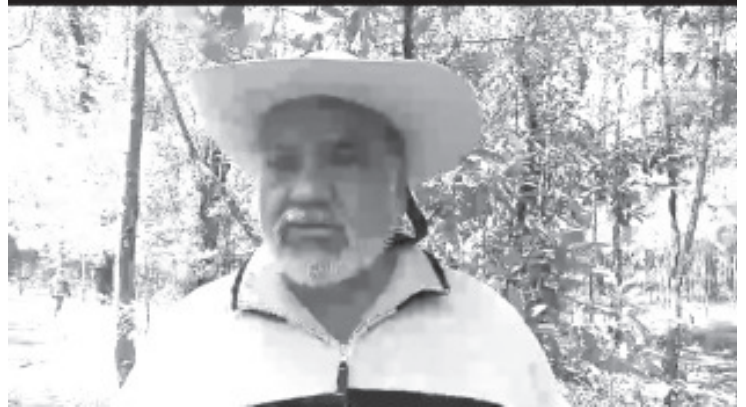
Con la participación de diferentes organizaciones, ejidatarios y diferentes sectores de la población de Zitácuaro y sus alrededores, se llevó a cabo este domingo una jornada de reforestación en el Centro Ecoturístico Lechuguillas.