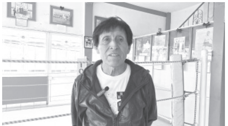
Para celebrar el 28 aniversario de su fundación en el municipio, el Salón de la Fama del Deporte llevará a cabo encuentros de box.