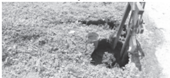
Como consecuencia de las fuertes lluvias de la actual temporada de lluvias, hasta el momento se han hundido poco más de 30 tumbas en el Panteón Municipal San Carlos.

El personal ya ha notificado a los propietarios sobre estos hechos y espera que acudan y lleven a cabo los trabajos correspondientes.