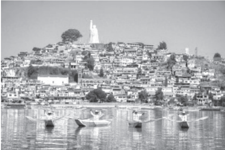
Si deseas vivir una experiencia única en estas vacaciones de verano, el Pueblo Mágico de Pátzcuaro y la isla de Janitzio, son las opciones que debes contemplar dentro de tus planes y agenda.

- Gastronomía, artesanías, naturaleza e historia, las experiencias que podrás vivir