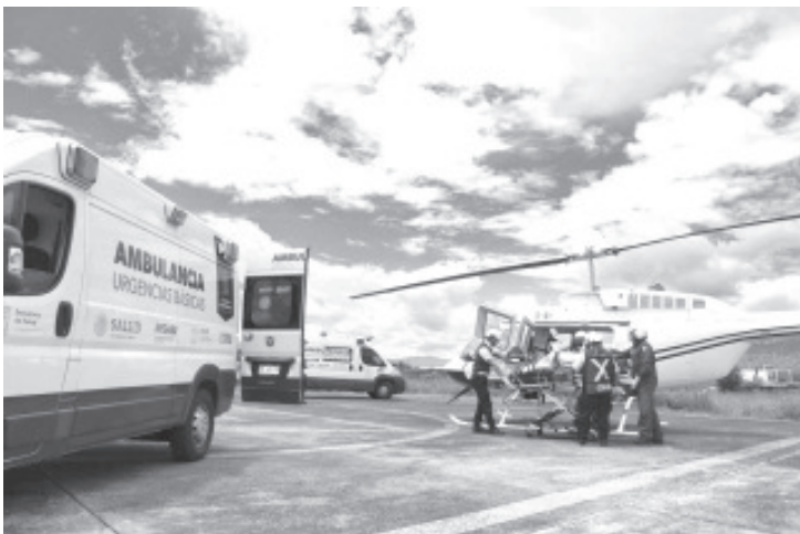
En lo que va del año, 69 emergencias obstétricas han sido atendidas con éxito por la Secretaría de Salud de Michoacán (SSM), con el traslado rápido y efectivo de las ambulancias aéreas del Gobierno de Michoacán y las unidades terrestres del Centro Regulador de Urgencias Médicas (CRUM).

Por ello es importante que las gestantes asistan a sus citas de control prenatal, consuman ácido fólico y acudan al médico en caso de presentar síntomas como visión borrosa, sensación de ver lucecitas, sangrados vaginales, fiebre e hinchazón en piernas, tobillos y pies.