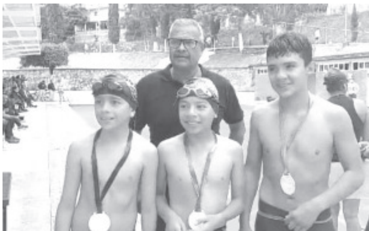
Con mucho éxito y buena respuesta de la población, se llevó a cabo el primer torneo de natación en el Centro Acuático Municipal.