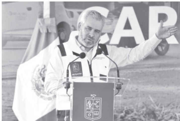
El Gobierno de Michoacán continúa con la estimulación de nubes para contrarrestar los efectos de la sequía y reponer niveles de agua en mantos freáticos, lagos y lagunas del estado.

Por lo que se han tenido condiciones favorables en los polígonos objetivo del norte y sur del estado para estimular nubes que ayuden a aumentar precipitaciones en los últimos días.