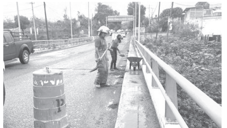
Heroico Cuerpo de Bomberos de Zitácuaro llevó a cabo labores de limpieza de tubos de desagüe, comenzando a las 13:40 horas. La acción tuvo lugar en el puente de barandillas de Zitácuaro.

Estas acciones demuestran el compromiso y la diligencia del Heroico Cuerpo de Bomberos de Zitácuaro para garantizar la seguridad de la comunidad.