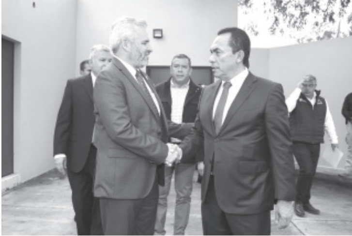
El Fiscal General del Estado de Michoacán, Adrián López Solís, reconoció el respaldo del Gobierno de Michoacán y del Congreso del Estado, el cual ha sido determinante para que la Fiscalía avance con la apertura del Complejo Sentimientos de la Nación, una moderna infraestructura que ahora está disponible para el beneficio de las y los michoacanos.

- Alfredo Ramírez Bedolla reconoció la disposición permanente del Fiscal General para trabajar de manera coordinada y cumplir con la garantía de seguridad de la ciudadanía - También, resaltó que la coordinación entre fuerzas federales, estatales y municipales, en materia de prevención y persecución del delito, ha dado buenos resultados