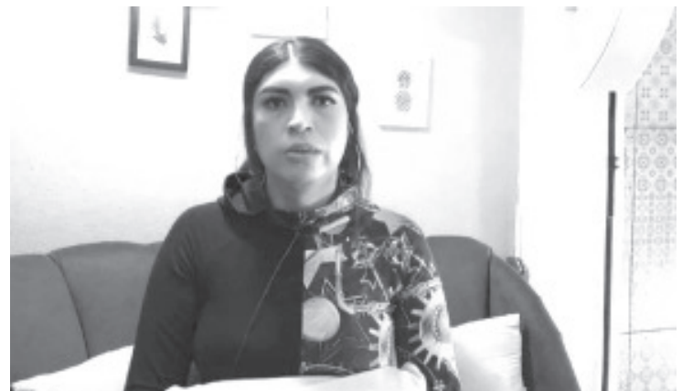
Integrante de la comunidad LGBTTQI+ fue víctima de discriminación por personal del Hospital Regional cuando acudió a solicitar atención médica. Por violar sus derechos de salud el caso ya fue llevado a la Visitaduría Regional de la Comisión Estatal de los Derechos Humanos.

Recordó que meses atrás se firmó un compromiso con el Director del Hospital Regional de Zitácuaro, para que se le diera una atención médica digna a los pacientes que son parte de la comunidad, pero esto no se respeta; los empleados son muy groseros y los discriminan.