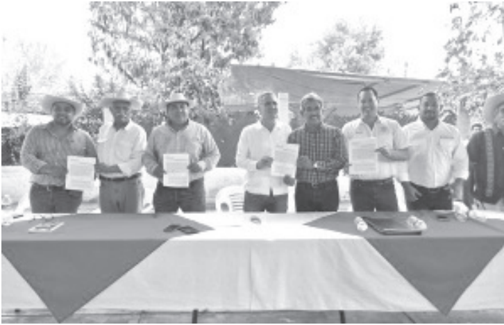
Un sueño largamente acariciado por los integrantes del ejido Las Garzas, del municipio de Tuzantla, está próximo a ser alcanzado: la construcción de la presa Los Pintos.

- Se invertirán 15 mdp; permitirá captar 2 millones de metros cúbicos de agua