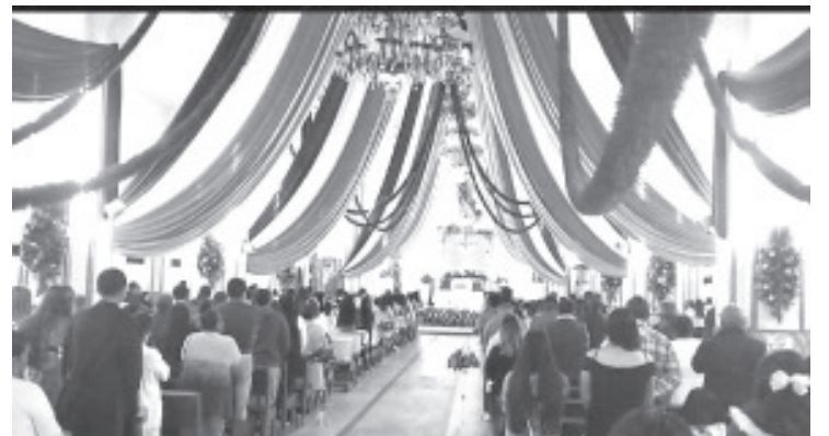
La Iglesia dedicada a San Juan Bautista celebró el día del santo patrono de este lugar, por lo que se organizaron diferentes actividades en su honor.

A lo largo del día, creyentes acudieron a este templo a agradecer favores recibidos o bien a pedir algún favor de este santo, como ya es costumbre además a degustar de los antojitos mexicanos y disfrutar de todo lo que se organizó para esta fecha.