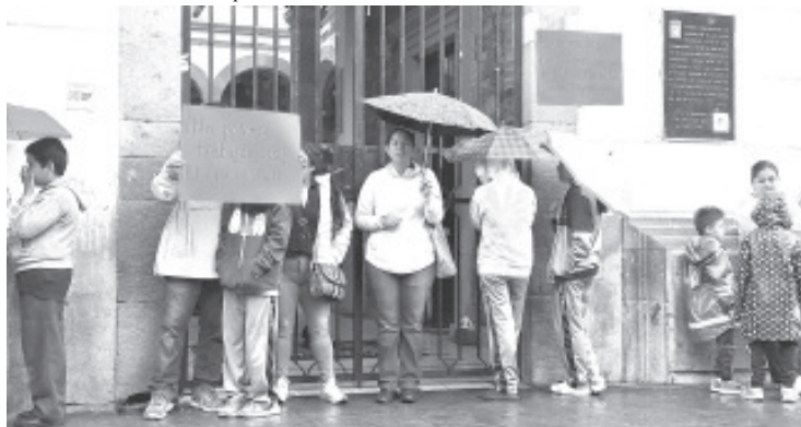
Maestros, padres de familia y alumnos de la escuela primaria Miguel Hidalgo se manifestaron a las afueras de la Presidencia Municipal y cerraron varias oficinas al exterior. Sobre las entradas colocaron diferentes pancartas con leyendas alusivas a sus demandas. La acción fue para protestar por la falta de agua que sufren sus instalaciones