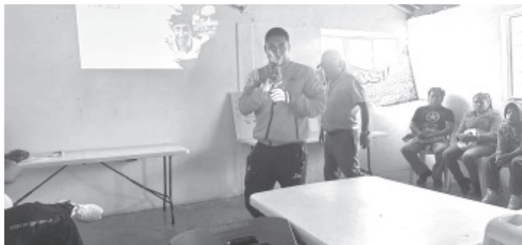
Con más de 50 niños y niñas de las diferentes localidades se va avanzando en la enseñanza de los niños para que tengan oportunidades de desarrollo deportivo de forma integral y así puedan optar por dedicarse de manera profesional.