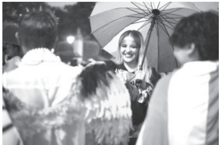
Más de 150 pruebas rápidas de detección de VIH, realizó la Secretaría de Salud de Michoacán (SSM) y el Instituto Mexicano del Seguro Social (IMSS), en la Feria de la Salud del Pride 2024.

En esta Feria participaron diversas dependencias como la Secretaría de Educación, Secretaría de Igualdad Sustantiva y Desarrollo de las Mujeres, Dirección del Registro Civil, Secretaría del Bienestar e IMSS, por mencionar algunas.