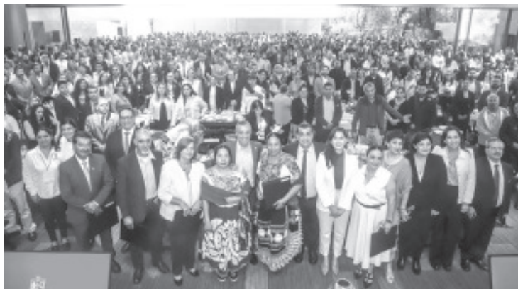
La educación en Michoacán vive una transformación profunda y la justicia laboral para las y los maestros es muestra de ello. Hoy la Secretaría de Educación del Estado (SEE) reconoce a 550 docentes que han entregado 30 años a su labor, con la medalla Maestro Rafael Ramírez y su estímulo económico.