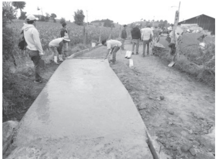
Con la presencia de integrantes del Concejo de autogobierno Mazahua de Crescencio Morales dan el visto bueno para que se concrete la pavimentación de la calle.