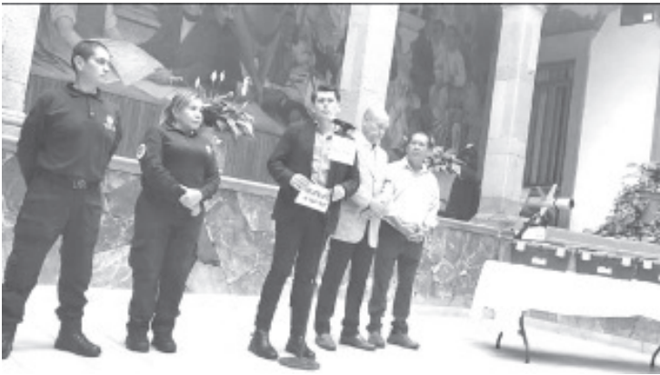
El Gobierno Municipal de Zitácuaro, que encabeza Juan Antonio Ixtláhuac Orihuela entregó herramientas al personal de Servicios Ciudadanos y Protección Civil Municipal, con ello podrán hacer mejor su trabajo.

que esta entrega era necesaria, si bien es cierto se trata de algo sencillo, se ocupa para atender reportes durante esta temporada en que hay muchos riesgos.