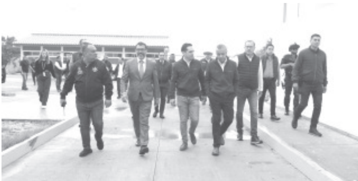
Inició el proceso de entrega del cuartel Valladolid de la Guardia Civil, ubicado en la capital michoacana, el cual robustecerá la operatividad en 14 municipios que comprenden la región Morelia y dignificará las condiciones de los agentes estatales a fin de que tengan lo necesario para desempeñar sus funciones de la mejor manera.

Este complejo, que constituye cerca de 30 mil metros cuadrados, contribuirá a acortar los tiempos de respuesta ante emergencias y eventualidades en los municipios de Morelia, Charo, Indaparapeo, Huandacareo, Cuitzeo, Santa Ana Maya, Queréndaro, Tzitzio, Copándaro, Acuitzio, Madero, Chucándiro, Álvaro Obregón y Tarimbaro, con la finalidad de incrementar la operatividad para garantizar la seguridad de las y los michoacanos.