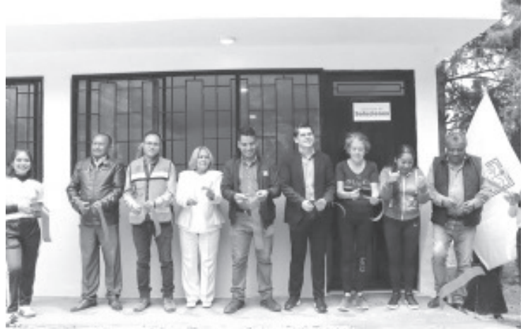
El Telebachillerato de La Palma de Cedano, fue beneficiado por el gobierno de Toño Ixtláhuac con un comedor escolar.