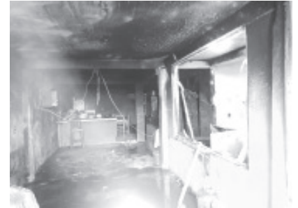
Un incendio en una casa habitación en la colonia El Escobal movilizó al Heroico Cuerpo de Bomberos de Zitácuaro este lunes. La alarma se recibió a las 15:44 hrs. y el fuego fue controlado a las 16:25 hrs.

Para emergencias, la ciudadanía puede comunicarse a los siguientes números: 7151538742, 7151649432, y 7151008419.