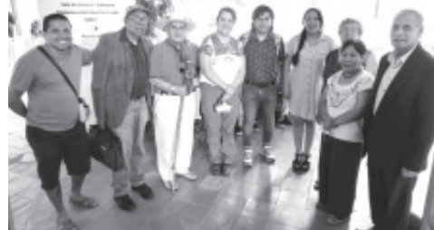
Reunión de CRONISTAS DEL ESTADO DE MICHOACÁN En el COLOQUIO NAL. DE CRONISTAS Llevado en Ex Colegio Jesuita en Pátzcuaro. ¡FELICITACIONES! A Los CRONISTAS De Zitácuaro.