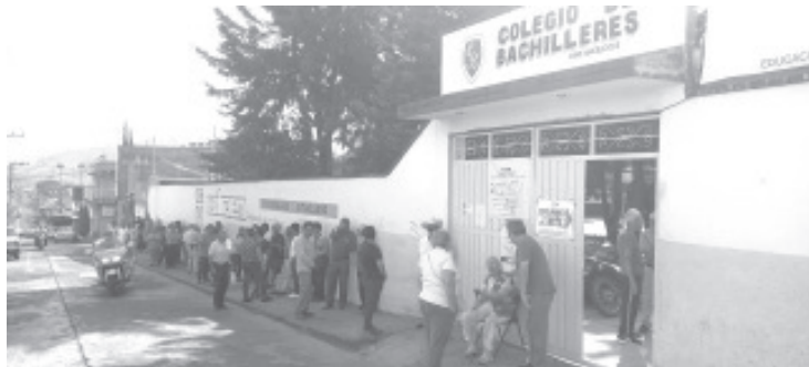
Con incidencias menores como problemas en el conteo de las boletas así como retraso de hasta 2 horas en la instalación de algunas de las casillas, se llevó a cabo el proceso electoral concurrente en el que los ciudadanos eligieron este día; Presidente de la República, Senadores, Diputados Federales y Locales así como Presidentes Municipales.