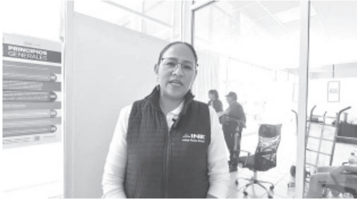
A raíz de los hechos violentos en el municipio de Ocampo dónde hubo quema de material electoral, urnas con votos en su interior fueron resguardados en las instalaciones del INE en Zitácuaro.

- Personal del INE junto con Guardia Nacional, Fiscalía y otras corporaciones tuvieron que acudir a rescatarlas