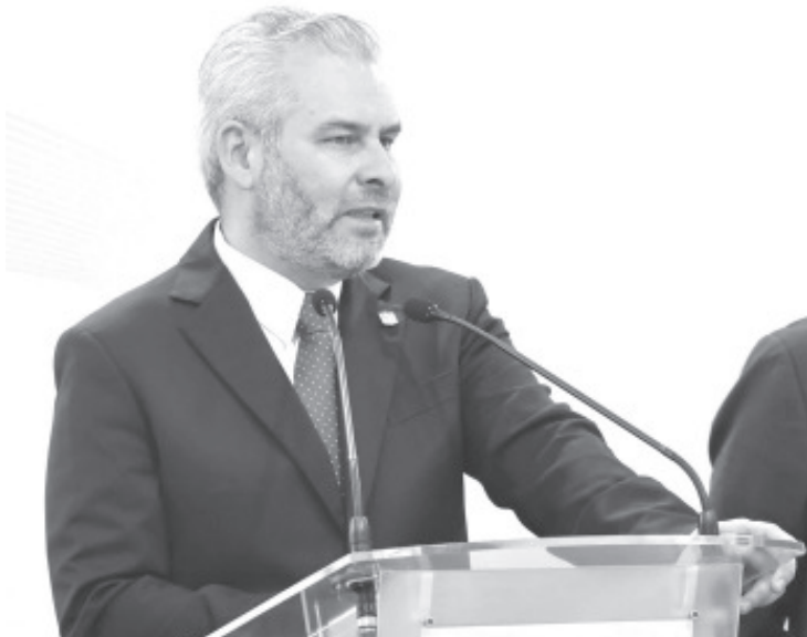
Durante la jornada electoral de ayer se garantizó la participación ciudadana, ya que los michoacanos pudieron elegir libremente, destacó el gobernador Alfredo Ramírez Bedolla, luego de dar a conocer que 1.7 millones de michoacanos salieron a votar.

Asimismo, detalló que fueron más de 12 mil agentes de seguridad de los tres órdenes de gobierno los que participaron en preservar el orden para que la ciudadanía pudiera acudir a las casillas.