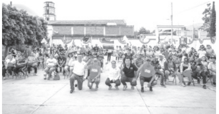
Con cierres de campaña en San Felipe de los Alzati, el movimiento se prepara para dar un paso histórico hacia un futuro mejor.

Movimiento Ciudadano invita a todos los ciudadanos a sumarse a esta causa, a votar con convicción y a ser parte del cambio que tanto anhelamos. Juntos, construiremos un Zitácuaro próspero, seguro y justo para todos.