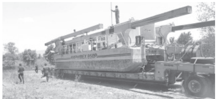
Llegó la maquinaria comprometida por la Secretaría de Marina (Semar) para apoyar en el rescate del lago de Pátzcuaro y en próximos días iniciará operaciones alrededor de la isla de Janitzio para realizar acciones de limpieza en el cuerpo de agua durante los próximos cuatro meses.

Este esfuerzo conjunto destaca el compromiso de las autoridades y de la comunidad con la protección del medio ambiente y la preservación del lago de Pátzcuaro. La Comisión de Pesca agradece la participación de todos los involucrados y reafirma su compromiso de continuar trabajando en pro de su conservación, asegurando un futuro próspero para las generaciones presentes y futuras.