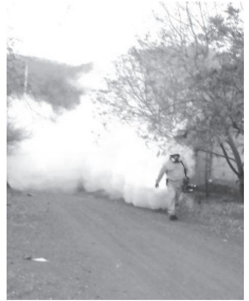
Derivado de la tercera ola de calor que culmina a finales de este mes y la cuarta que se acerca a mediados de junio, la Secretaría de Salud de Michoacán (SSM), se mantiene en guardia con acciones vectoriales para el combate del dengue, zika y chikungunya.

acondicionado en las habitaciones; además de los pabellones en camas donde duermen niños menores de 5 años, adultos mayores o enfermos con diabetes.