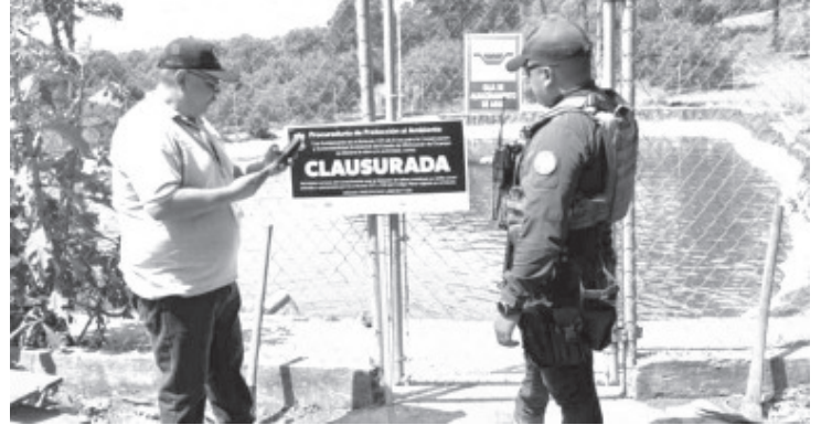
Con el sistema de vigilancia satelital Guardián Forestal se detectaron 400 ollas de agua en la cuenca del lago de Pátzcuaro, informó la Secretaría de Seguridad Pública (SSP).

La Procuraduría Federal de Protección al Ambiente (Profepa), la Comisión Nacional del Agua (Conagua), Guardia Nacional, Procuraduría de Protección al Ambiente (Proam), Guardián Forestal y la Guardia Civil del Agrupamiento Forestal dieron validez al aseguramiento de estos desvíos de causas de agua naturales hacia las ollas de agua ilegales.