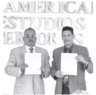
Con la participación de 14 países de forma presencial o a distancia, la Universidad Centro Panamericano de Estudios Superiores (UNICEPES) es sede del X Congreso Iberoamericano sobre uso sustentable de la Biodiversidad y Manejo de Áreas Protegidas del 28 al 31 de mayo.

Como parte del congreso, se tiene Colección Biológica Itinerante única en su tipo por primera vez en Zitácuaro y está abierta a toda la población de Zitácuaro, en las instalaciones de UNICEPES, Salazar Norte 26. Ésta esta compuesta por invertebrados marinos, invertebrados terrestres, mamíferos, aves y reptiles.