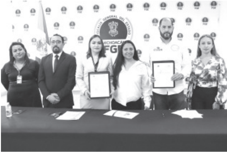
Con el objetivo de fortalecer la vinculación educativa, la Fiscalía General del Estado de Michoacán (FGE) signó un convenio de colaboración con el Corporativo Universitario de Equivalencias y Revalidación (CUER) Zitácuaro.

Morelia, Michoacán, a 21 de mayo de 2024.- Con el objetivo de fortalecer la vinculación educativa, la Fiscalía General del Estado de Michoacán (FGE) signó un convenio de colaboración con el Corporativo Universitario de Equivalencias y Revalidación (CUER) Zitácuaro.