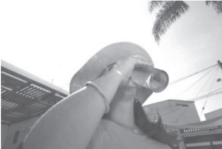
Ante la onda de calor que afecta al país, la Secretaría de Salud de Michoacán (SSM) exhorta a la población a evitar la deshidratación con la toma diaria de dos litros de agua simple para el caso de los adultos, y litro y medio para niñas, niños y adolescentes.

- Consume agua simple y evita las bebidas energéticas, azucaradas y refrescos