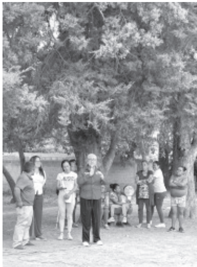
Reunidos con los vecinos de la localidad de el Aguacate tocamos temas que deben hacer conciencia en México y en el Distrito Local XIII la protección de nuestros bosques, el cuidado del agua y la reforestación.

Estos compromisos no son solo promesas, sino un llamado a la acción. Juntos, podemos