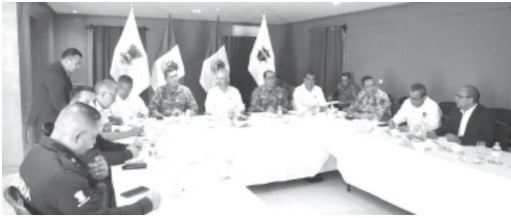
Por acuerdo de los integrantes de la Mesa de Seguridad Estatal, el gobernador Alfredo Ramírez Bedolla solicitará por oficio el despliegue de elementos del Ejército durante la jornada electoral del próximo 2 de junio.

Ramírez Bedolla enfatizó la importancia de brindar condiciones seguras a la ciudadanía que participará en las votaciones del domingo 2 de junio, siendo esta la elección más grande en la historia en Michoacán.