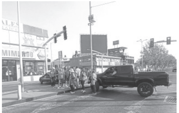
Agremiados al Sindicato de Trabajadores al Servicio del Poder Ejecutivo (STASPE), bloquearon este lunes la Avenida Revolución, del tramo de Moctezuma a Matamoros.

Entre las dependencias que este día no laborarán por dicha acción, se encuentran el CERESO, Registro Civil, Rentas, SNE, Turismo, Transito, entre otros más.