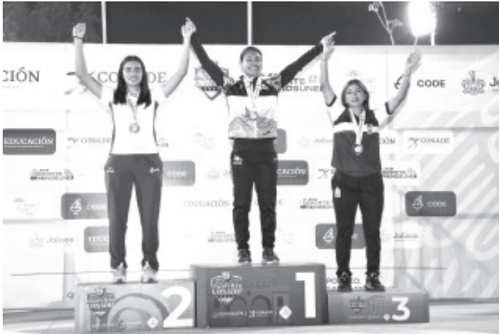
Gran jornada para Michoacán en la que sumó dosoros, dos platas y tres bronce en la disciplina de patinaje de velocidad dentro de los Nacionales Conade 2024, en Guadalajara, Jalisco.

- La delegación estatal suma hasta el momento 9 preseas