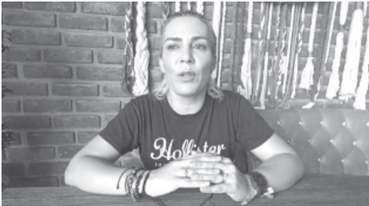
Cómo cada año, la Alianza por la Conservación del Bosque Suelo y Agua A.C. lleva a cabo la campaña de recolección de apoyo para integrantes de brigadas contra los incendios forestales.

- Lo obtenido será entregado a brigadistas contra incendios forestales