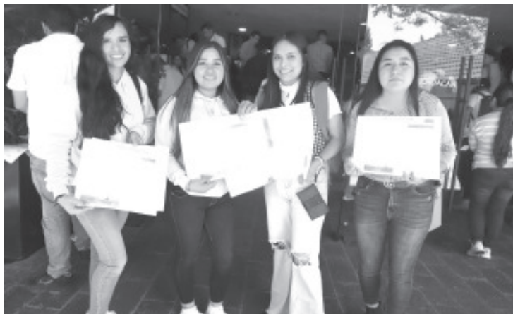
La Secretaría de Educación del Estado (SEE) reitera que todos los trámites que brindan justicia laboral a las y los trabajadores no tienen ningún costo y se realizan sin gestores ni intermediarios, como son los Formatos Únicos de Personal (FUP), la recategorización, cambios de centros de trabajo y asignación de horas para secundaria.

En caso de ser víctimas de un intento de cobro u ofrecimientos para "agilizar los trámites", se invita a las y los trabajadores a presentar la denuncia correspondiente en la página de la Secretaría de Contraloría https://secoem.michoacan.gob.mx/denuncias/ .