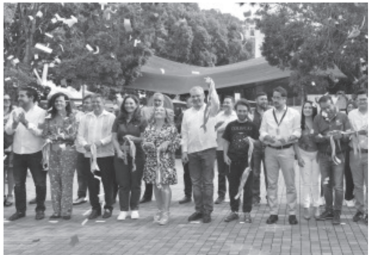
Tras realizar la inauguración de la tercera edición del Festival Michoacán de Origen, el gobernador Alfredo Ramírez Bedolla destacó la importancia de este evento, el cual es un punto de encuentro sano, familiar y de diversión.

El Festival Michoacán de Origen se realizará desde este viernes 26 de abril hasta el 19 de mayo; los horarios serán de lunes a jueves de 13:00 a 22:00 horas y de viernes a domingo de 11:00 a 22:00 horas.