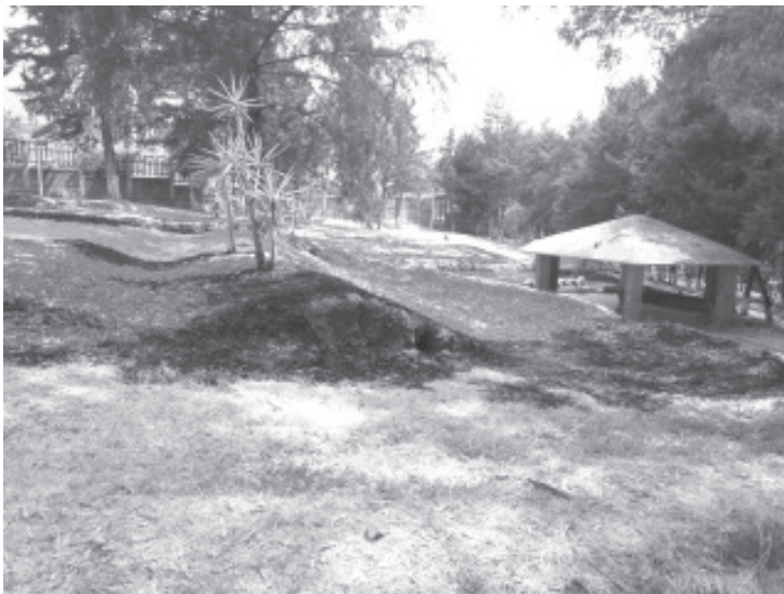
En el transcurso del día jueves, la entrada de arriba del Parque Vikingo fue incendiada, se desconoce quien ocasionó este incidente.

Reiteró que como responsable de los parques y jardines del municipio se está al pendiente de todos los reportes que reciben.