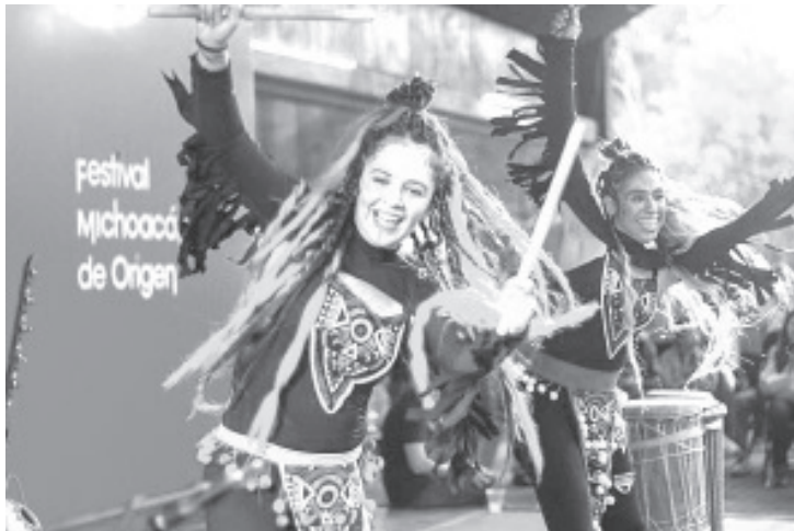
El Festival Michoacán de Origen (FMO) llega este 26 de abril y se mantendrá hasta el 19 de mayo en el Centro de Convenciones y Exposiciones de Morelia (Ceconexpo), espacio donde la gastronomía, la artesanía, los productores y el entretenimiento se conjuntarán para entregar momentos de sana diversión a las familias.

- La tercera edición se desarrollará del 26 de abril al 19 de mayo