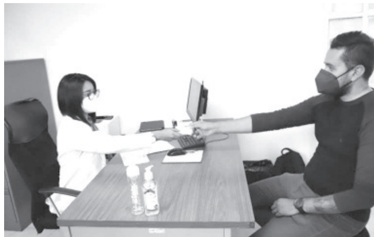
Los medicamentos psiquiátricos utilizados para tratar la ansiedad no causan adicción, es por ello que la Secretaría de Salud de Michoacán (SSM) invita a la población recibir atención oportuna.

Los síntomas incluyen taquicardia, mareos, adormecimiento de manos, tensión muscular, sudoración, opresión en el pecho, así como problemas para dormir y respirar, que, si no se atienden generan disminución de la calidad de vida, desarrollo de trastornos de salud mental, riesgo de consumo de sustancias psicoactivas, autolesiones y pensamientos suicidas.