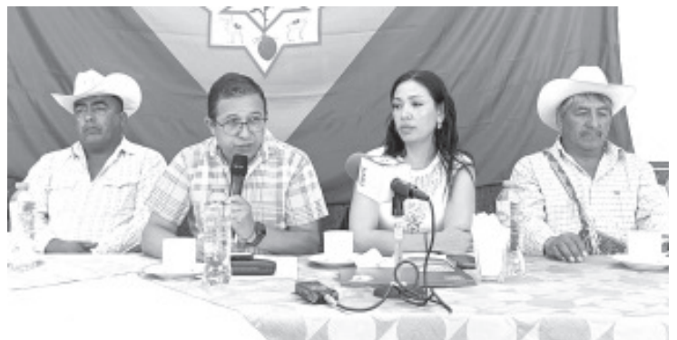
En conferencia de prensa, integrantes del Consejo de Autogobierno de Crescencio Morales anunciaron formalmente que ganaron la controversia constitucional presentada por el Ayuntamiento de Zitácuaro.