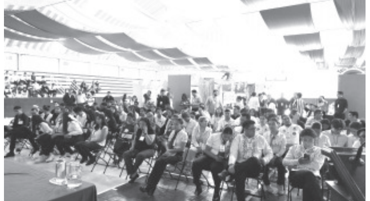
Con gran éxito concluyó la etapa local de la Cumbre Nacional de Desarrollo Tecnológico, Investigación e Innovación (InnovaTecNM) 2024 en el Instituto Tecnológico de Zitácuaro.