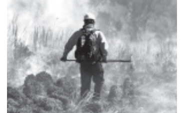
Como parte de las acciones de prevención implementadas para reducir incendios forestales en el estado, la Comisión Forestal de Michoacán (Cofom) utiliza drones para detectar puntos de calor y evitar siniestros.

La estrategia de combate a incendios forestales es encabezada por la Comisión Nacional Forestal (Conafor), Comisión Forestal del Estado (Cofom), Secretaría de Medio Ambiente (Secma), Comisión Nacional de Áreas Naturales Protegidas (Conanp), Protección Civil Estatal, Servicios Aéreos de la Secretaría de Seguridad Pública (SSP), Secretaría de la Defensa Nacional (Sedena), Guardia Nacional y los gobiernos municipales.