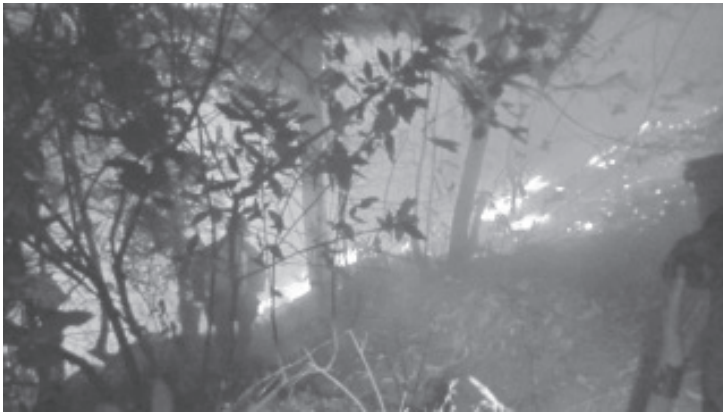
El incendio forestal registrado la tarde de este martes en la tenencia de San Juan Zitácuaro, se combatió y sofocó gracias a la Brigada Municipal 467 de la Secretaría de Agronomía y Medio Ambiente, vecinos y el Heroico Cuerpo de Bomberos.

El Gobierno Municipal, invita a la población que, en caso de presenciar un incendio forestal, dar aviso lo más rápido posible a las autoridades correspondientes, por lo que se pone a la disposición el número telefónicos 911.