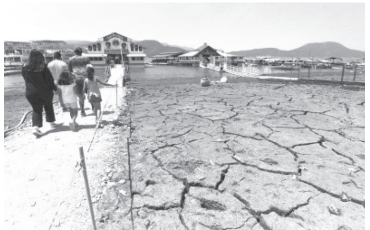
El gobierno decidió suspender la extracción de agua de la presa de Valle de Bravo, ante los bajos niveles que presenta derivado de la sequía que padece gran parte del territorio nacional.

Fotografías de Crisanta Espinosa (Cuartoscuro) muestran que la presa se está secando.