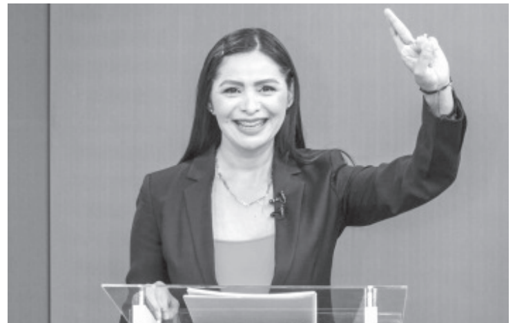
Vamos a trabajar para reordenar el Sector Salud en México frente a la catástrofe que ha vivido durante en este sexenio, sin olvidar el engaño que se pretendió, cuando se dijo que nuestro país iba a contar con un servicio mejor que Dinamarca.

Nosotros proponemos un Seguro Médico con cobertura, que sea universal y brinde los medicamentos que los pacientes requieren de manera oportuna.