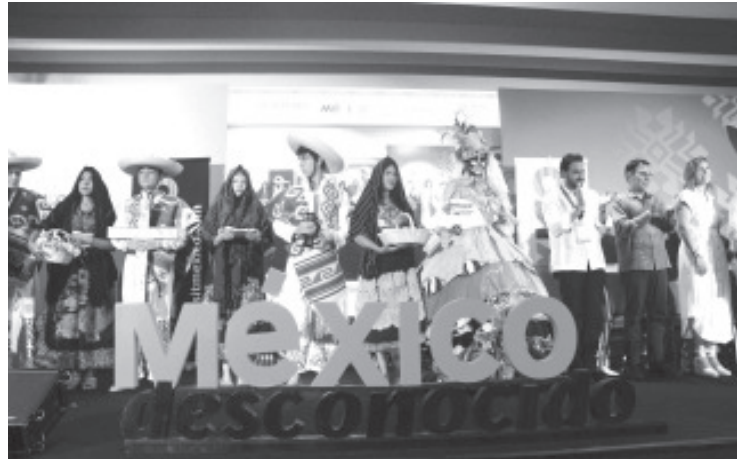
Por su emblemática Noche de Muertos, Michoacán se alzó como rotundo ganador en los premios Lo Mejor de México 2024 que organiza la revista México Desconocido.