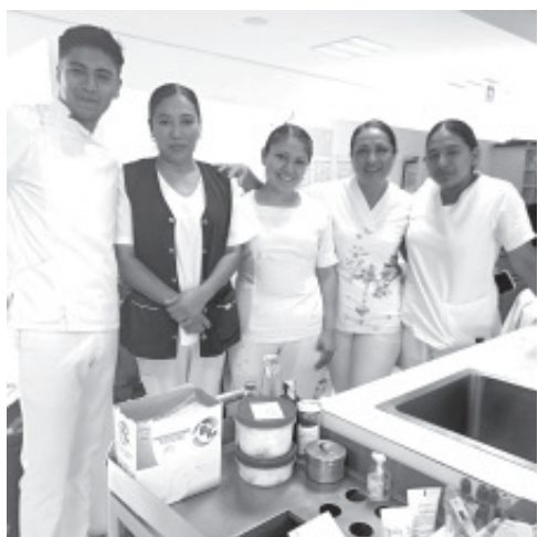
¡FELICITACIONES! Y UN AGRADECIMIENTO A ENFERMERAS Y ENFERMEROS DEL HOSPITAL REGIONAL DE SSM-ZITÁCUARO T.M Y T.V. POR SU MAGNIFICA ATENCIÓN A MI HERMANO CAMA 30 ¡MUCHAS GRACIAS!