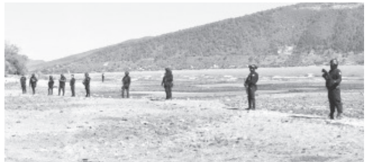
El operativo de la Guardia Civil en el lago de Pátzcuaro ha evitado la sustracción ilegal de 600 mil litros de agua al día, informó la Secretaría de Seguridad Pública (SSP).

Además de los esfuerzos en la vigilancia e investigaciones, para la SSP la denuncia es importante e invita a la ciudadanía para que reporte estos hechos de manera anónima al número 089, donde será interpuesta sin solicitar información personal, en protección a la integridad de quien llama