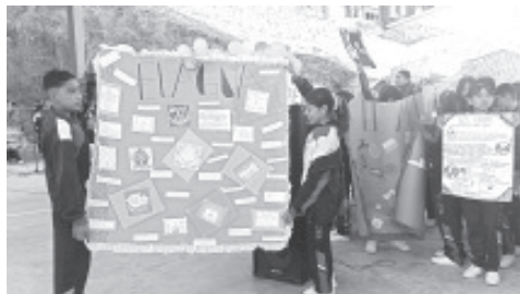
En el marco del Día Mundial del Agua, establecido para cada 22 de marzo de cada año; alumnos de la Escuela Secundaria Federal No 3 “Prof. Rafael Ramírez Castañeda” promovieron el cuidado del vital líquido en varias calles de la colonia La Joya.

H. Zitácuaro Michoacán, 22 de marzo de 2024.- Por: Guadalupe Solache Rebollo. En el marco del Día Mundial del Agua, establecido para cada 22 de marzo de cada año; alumnos de la Escuela Secundaria Federal No 3 “Prof. Rafael Ramírez Castañeda” promovieron el cuidado del vital líquido en varias calles de la colonia La Joya.