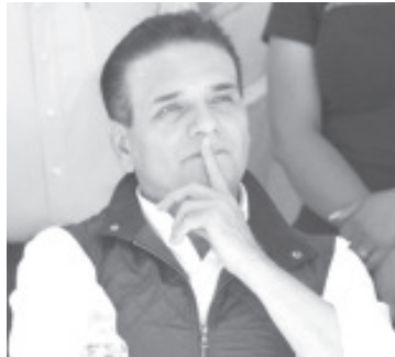
Después de participar en el desfile primaveral de Aputzio de Juárez, tenencia de Zitácuaro, Silvano Aureoles recordó al Benemérito de las Américas, a quien admira y respeta, en este contexto expresó que, si el día de hoy estuviera vivo, seguramente protestaría por el ataque a las instituciones que ha hecho el gobierno morenista.

Zitácuaro, Michoacán a 21 de marzo 2024.- Después de participar en el desfile primaveral de Aputzio de Juárez, tenencia de Zitácuaro, Silvano Aureoles recordó al Benemérito de las Américas, a quien admira y respeta, en este contexto expresó que, si el día de hoy estuviera vivo, seguramente protestaría por el ataque a las instituciones que ha hecho el gobierno morenista. “Juárez hoy diría que nada por encima de la ley, que la Suprema Corte es intocable, que hay que defender la división de poderes y que se debe proteger de los tiranos a las instituciones”.