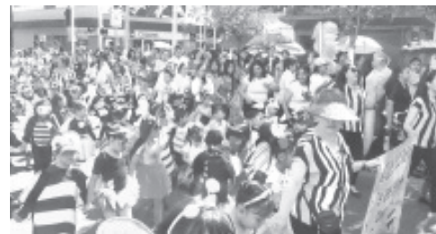
Cientos de alumnos de los diferentes jardines de niños del municipio, protagonizaron el tradicional desfile de primavera este 21 de marzo. Los diferentes contingentes se concentraron en diferentes puntos y avanzaron en punto de las 9:00 de la mañana hacia el centro de la ciudad.