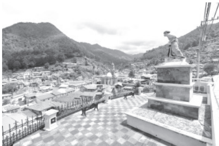
Angangueo celebra este jueves sus primeros 12 años con la distinción de Pueblo Mágico, y estas vacaciones de Semana Santa es ideal para que puedas conocerlo.

Entre sus atractivos se encuentra la Reserva de la Biosfera Mariposa Monarca, el Santuario el Rosario, el Templo de la Inmaculada Concepción, la Parroquia de San Simón Celador, la Casa Parker y el Túnel turístico San Simón, ideales para conocer durante la temporada vacacional de Semana Santa.