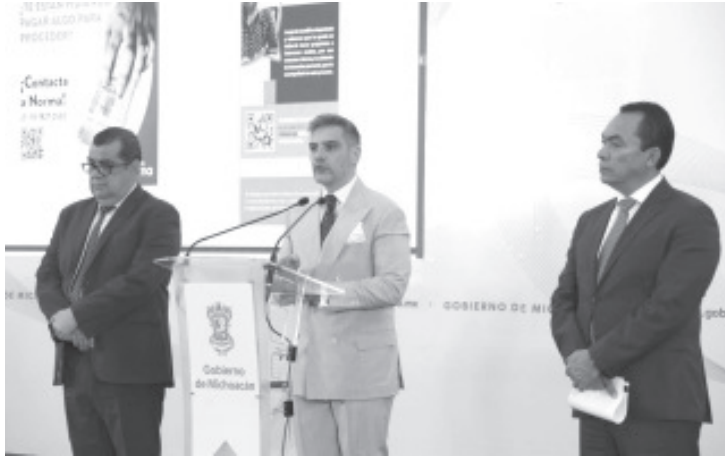
La Fiscalía General del Estado de Michoacán (FGE), en coordinación con el Observatorio Nacional Ciudadano, presentaron una aplicación de asistencia virtual denominada "Ella es Norma", asistente virtual que auxiliará y orientará a las víctimas de posibles delitos a denunciar, así como a reportar irregularidades o casos de corrupción durante su proceso ministerial.

Morelia, Michoacán, a 6 de marzo de 2024.- La Fiscalía General del Estado de Michoacán (FGE), en coordinación con el Observatorio Nacional Ciudadano, presentaron una aplicación de asistencia