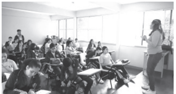
Las y los maestros que estén interesados en realizar su cambio de centro de trabajo tienen hasta el 12 de marzo para participar en la convocatoria de este año, informó la Secretaría de Educación del Estado (SEE).

Cabe recordar que los documentos deberán ser totalmente legibles y no se aceptarán fotografías de los mismos, solo escaneados. La convocatoria es segura, transparente y sin intermediarios.