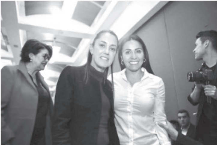
Previo a la llegada de la aspirante a la Presidencia de México por la coalición "Sigamos Haciendo Historia" al municipio de Maravatío, se augura una gran convocatoria y el fortalecimiento de la estrategia rumbo a la consolidación de la Cuarta Transformación.