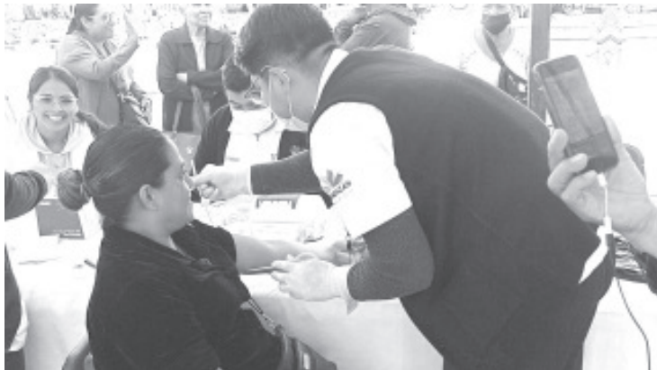
A través del Comité Mujer Salud y Desarrollo, el Centro de Salud de esta ciudad llevó a cabo una feria de salud en la explanada de la Plaza Cívica Licenciado Benito Juárez.

H. Zitácuaro Michoacán, 06 de marzo de 2024.- Por: Guadalupe Solache Rebollo. A través del Comité Mujer Salud y Desarrollo, el Centro de Salud de esta ciudad llevó a cabo una feria de salud en la explanada de la Plaza Cívica Licenciado Benito Juárez.