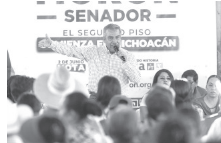
La educación pública es un derecho constitucional, no una concesión, recordó el candidato al Senado por Michoacán, Raúl Morón Orozco, quien aseguró que en su agenda legislativa de incluirán iniciativas encaminadas a defender su gratuidad en todos los niveles.

Este miércoles Raúl Morón continuará su recorrido por la región de la Ciénega, en donde sostendrá encuentros con el pueblo en Pajacuarán y Vista Hermosa.