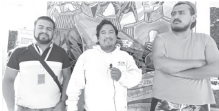
Con muchas dificultades de recursos y la poca participación de la población, avanza la organización de lo que será la representación del viacrucis del Santuario de la Virgen de los Remedios.

Coincidieron que cada vez es más difícil que los jóvenes participen en este tipo de actividades, pero aquellos que se dan la oportunidad de hacerlo se llevan una experiencia única en su vida, ya que al representar esta parte de la tradición católica se llevan un mensaje diferente de fe a diferentes aspectos de su vida.