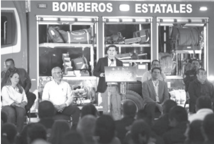
El Heroico Cuerpo de Bomberos de Zitácuaro recibió de manos del gobernador, Alfredo Ramírez Bedolla y del alcalde Juan Antonio Ixtláhuac, un camión de bomberos nuevo y equipamiento para la corporación, cuya inversión forma parte de los recursos del Fondo para el Fortalecimiento para la Paz (Fortapaz).

-El alcalde Toño Ixtláhuac y el gobernador de Michoacán, entregaron el vehículo a la corporación.