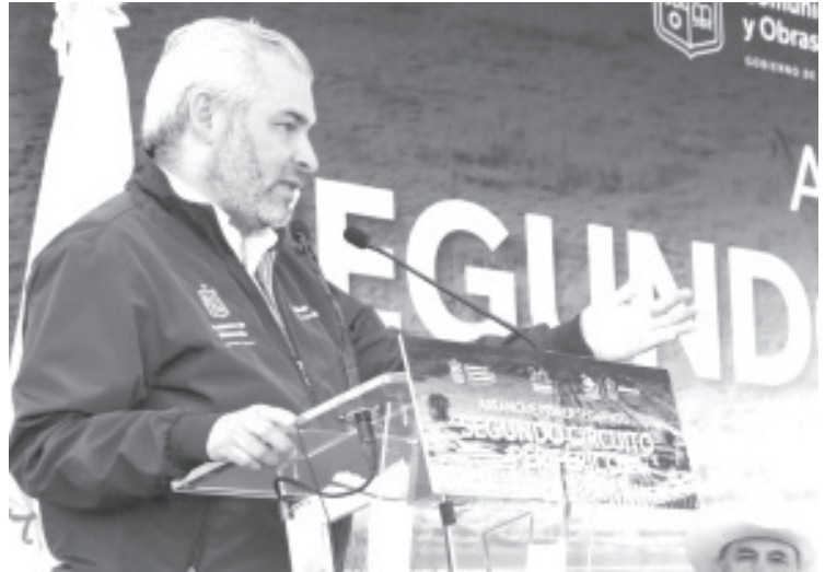
Se aprobaron 914.7 millones de pesos en proyectos regionales y municipales. El gobernador Alfredo Ramírez Bedolla informó que esa cantidad representa casi el 60 por ciento del total de los recursos etiquetados este año para el financiamiento de obras convenidas entre el estado y los municipios.

Agregó que, de acuerdo a las reglas de operación del programa, los municipios podrán ingresar otros proyectos en las ventanillas 2 y 3 que estarán disponibles del 1 al 8 de marzo y del 1 al 15 de abril, respectivamente.