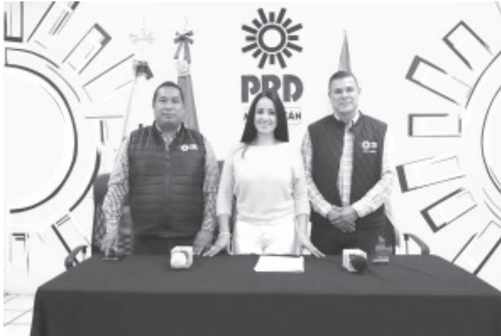
Al retomar el Noveno Pleno Ordinario del XI Consejo Estatal del Partido de la Revolución Democrática (PRD), las Consejeras y Consejeros perredistas, aprobaron más de 25 candidaturas para presidencias municipales, así como el Distrito Local 22, con cabecera en Múgica.