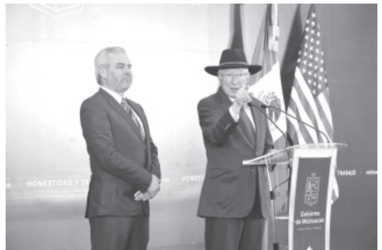
Durante su visita al estado, el embajador de Estados Unidos en México, Ken Salazar dijo que alrededor del 70 por ciento de las armas que llegan al país proviene de la nación del norte, por ello, de manera conjunta con autoridades michoacanas se revisan las acciones que se están realizando para frenar el flujo.

Explicó que también se está trabajando en lo que está ocurriendo con el fentanilo y las drogas, ya que el año pasado este fenómeno cobró la vida de alrededor de 100 mil personas en Estados Unidos.