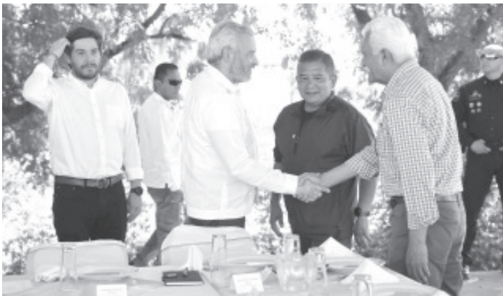
El gobernador Alfredo Ramírez Bedolla y la Asociación de Citricultores del Valle de Apatzingán establecieron agenda de trabajo para concretar la certificación y exportación del limón michoacano.