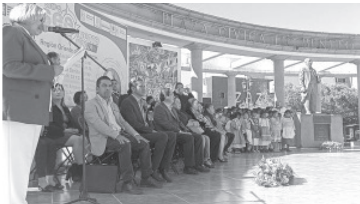
Con la participación de un total de 36 instituciones de nivel medio superior, superior y centros de capacitación este jueves se inauguró el evento SEE Orienta en su XVIII edición.

Agregó que en la vida, el ser humano se tiene que enfrentar a momentos de decisión y esto definirá su vida: uno es la elección de su carrera y otro la persona con la que desea compartir su vida.