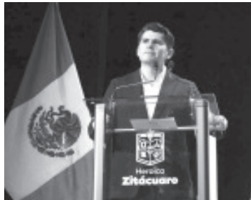
Nuevamente el gobierno de Toño Ixtláhuac se posiciona como líder de los municipios de Michoacán y entre los mejores del país, en el cumplimiento de las reglas de operación de los fondos federales públicos federales.

Por último la Auditoría Superior de la Federación destaca que el Gobierno Toño Ixtláhuac ha generado y puesto en operación mecanismos de control para la ejecución de dicho fondo, encaminados a garantizar en el