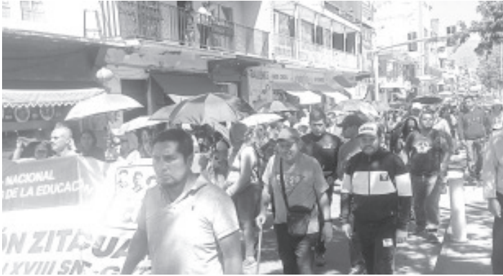
Maestros de la CNTE, del Grupo Poder de Base culminaron su paro de 72 horas con diferentes acciones a nivel local y denunciaron la falta de recursos en el rubro educativo a nivel estatal.

H. Zitácuaro Michoacán, 22 de febrero de 2024.- Por: Guadalupe Solache Rebollo. Maestros de la CNTE, del Grupo Poder de Base culminaron su paro de 72 horas con diferentes acciones a nivel local y denunciaron la falta de recursos en el rubro educativo a nivel estatal.