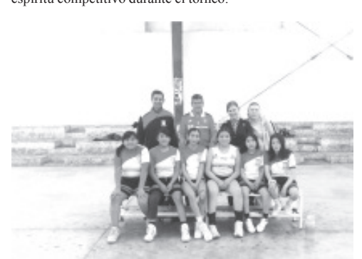
En un ambiente de compañerismo y sana competencia, se llevó a cabo hoy el esperado torneo de básquetbol femenino y varonil de la Zona Escolar 39 de secundarias generales. El evento, que contó con la participación de escuelas tanto públicas como privadas, se desarrolló en la unidad deportiva de La Joya.