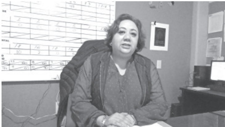
Desde el pasado 14 del presente mes, la Coordinación Jurisdiccional de Protección Contra Riesgos Sanitarios estará vigilante de la venta y consumo de producto de mar, como pescados y mariscos.

Sobre todo, deben tomar en cuenta las recomendaciones como: revisar que el producto esté en buen estado, que el pescado tenga ojos brillantes, que al momento del tacto no se hunda la piel y mantenga el color y olor normal. En caso de no ser así, no adquirirlo porque estaría en riesgo la salud de su familia.