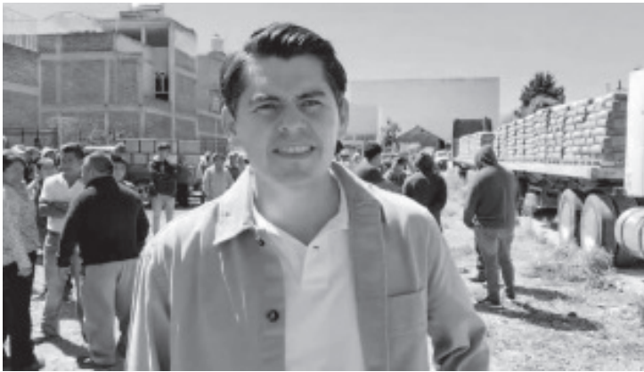
H. Zitácuaro Michoacán, 20 de febrero de 2024.- El Presidente Municipal Juan Antonio Ixtláhuac Orihuela, encabezó la entrega de cemento para que más caminos y calles se pavimenten y con ellos sus habitantes accedan a mejores condiciones de vida.

- Encabeza Juan Antonio Ixtláhuac Orihuela la entrega de más material para caminos y calles