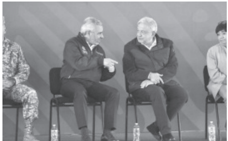
Los 5 mil millones de dólares que llegan anualmente a Michoacán por el envío de remesas es equiparable al presupuesto anual que tiene el estado y permiten el desarrollo económico de la entidad, destacó el presidente Andrés Manuel López Obrador.