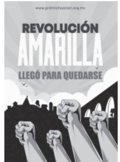
En el marco del Noveno pleno ordinario del XI Consejo Estatal del Partido de la Revolución Democrática (PRD) con carácter de electivo se aprobaron las candidaturas plurinominales a diputaciones locales por nuestro instituto político.

Y también en siguientes días se apruebe dictamen para las planillas de presidencias municipales, regidoras, regidores, síndicas y síndicos para los 112 Ayuntamientos.