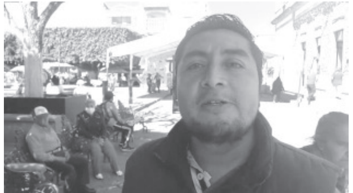
Integrantes de la Sección XVIII de la CNTE, del Grupo Poder de Base llevaron a cabo un paro de 72 horas para exigir al Gobierno del Estado el cumplimiento a diferentes puntos que tienen pendientes con el magisterio.