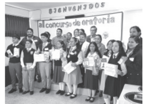
El pasado jueves el colegio Lumena fue testigo del Concurso de Oratoria de la Zona 39 de Secundarias Generales, un evento que reunió a jóvenes oradores de diversas instituciones educativas.