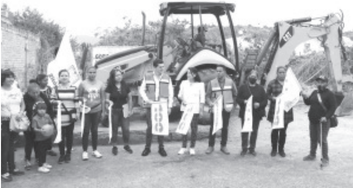
El gobierno del alcalde Juan Antonio Ixtláhuac continúa rescatando más espacios públicos en Zitácuaro; esta vez puso en marcha la construcción de área recreativa en La Barranca del Diablo, sobre la calle Cuauhtémoc.