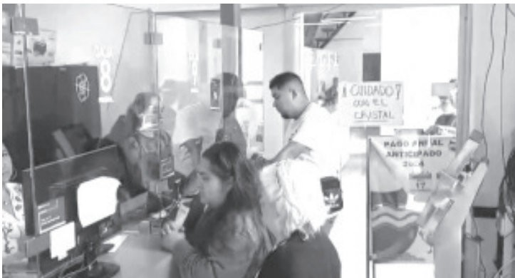
En lo que va del año, el 51% de los ciudadanos del municipio que tienen alguna propiedad ha pagado el impuesto predial.

Para comodidad de quienes trabajan entre semana o quienes salen fuera, se están abriendo las cajas los días sábados a fin de evitar que por falta de tiempo los ciudadanos no contribuyan con este impuesto municipal.