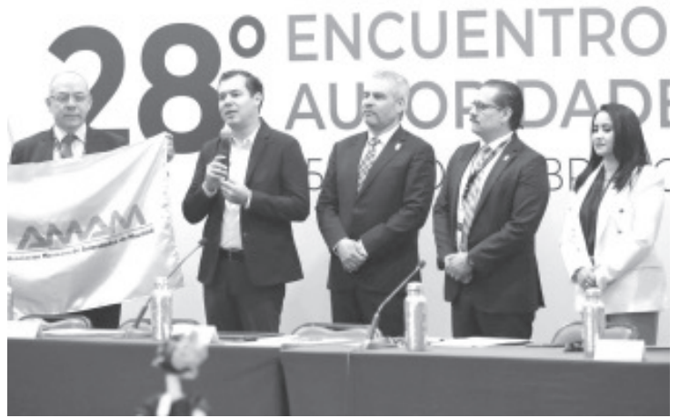
El gobernador Alfredo Ramírez Bedolla encabezó el 28 Encuentro de la Asociación Mexicana de Autoridades de la Movilidad (AMAM), en el que participan 26 estados del país y cuatro gobiernos municipales, donde se expondrán los proyectos más destacados en esta materia, como el esquema de financiamiento del teleférico de Uruapan.

Convocó a los vecinos a "ganar su espacio", refiriéndose a que deberán también ellos estar pendiente de su mantenimiento y vigilar que no sea vandalizado o dañado.