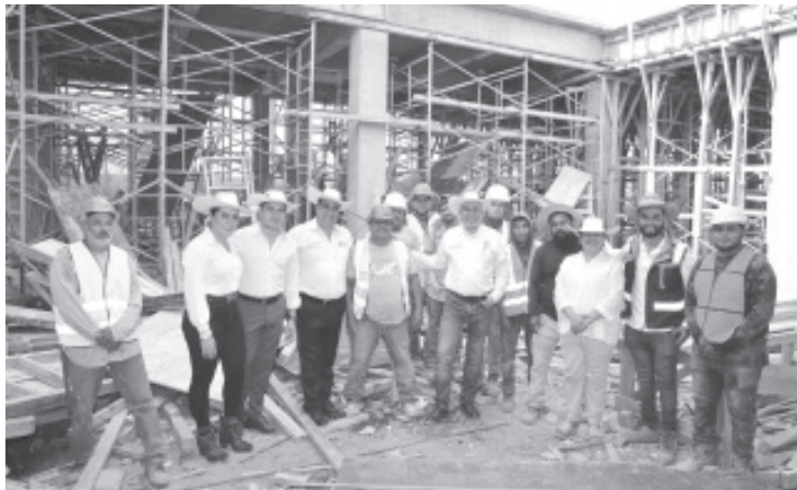
El Centro Comunitario de Salud Mental y Adicciones (Cecosama) de Huetamo, que muestra un avance del 55 por ciento en su construcción, fue supervisado este jueves por el gobernador Alfredo Ramírez Bedolla.

El gobernador recordó que en Zamora ya opera un centro de este tipo con una productividad de 5 mil 76 consultas anuales, que sumadas a los Cecosamas de Uruapan, Apatzingán, Zitácuaro y Sahuayo, ya serán seis las unidades brindando atención de salud mental con una estimación de las 12 mil consultas anuales.