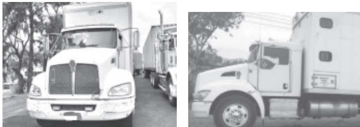
Con acciones oportunas, elementos de la Secretaría de Seguridad Pública (SSP), recuperaron dos tractocamiones, robados momentos antes, en el municipio de Maravatío.

Actuar con prontitud y efectividad, son las prioridades de la SSP, por ello, se invita a reportar cualquier eventualidad a los teléfonos 911 Emergencias y 089 Denuncia Anónima, siempre listos para apoyar.