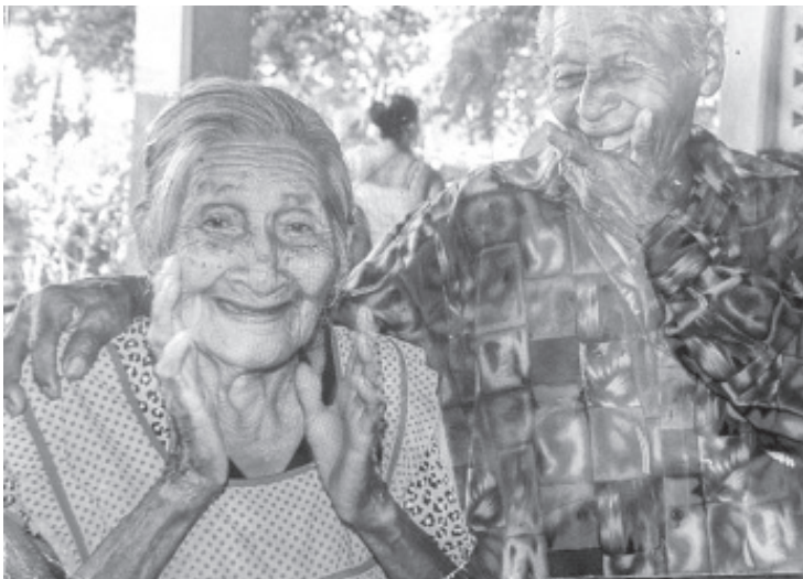
La omisión de cuidado, el abandono y el maltrato de adultos mayores son un delito y deben castigarse, la legislación actual contempla penas por estas malas conductas.

Entre los derechos de las personas adultas mayores que se les debe garantizar, se encuentran: una vida de calidad, sin violencia y sin discriminación; trato digno y apropiado el cualquier procedimiento judicial; salud, alimentación y familia. También educación, trabajo digno y bien remunerado; denunciar todo hecho, acto u omisión que viole los derechos que consagra la Ley de los Derechos Humanos de las Personas Adultas Mayores; atención en establecimientos públicos y privados que presten servicio; asociarse y particular en procesos productivos de educación y capacitación; asistencia social y contar con lugares preferentes en el transporte.