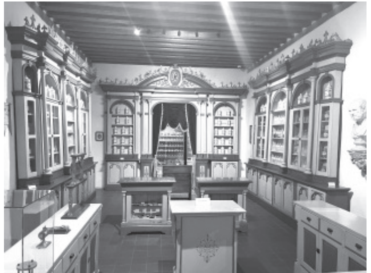
Imagínate conocer una botica del siglo XIX, la variedad de máscaras que se utilizan en las danzas y fiestas del estado o admirar los textiles que bordan las personas artesanas en Michoacán. Pues todo ello es posible en el Museo del Estado.

La Moraleja de la Historia - No subestimes a la gente por su trabajo, la inteligencia no es exclusiva de los " abogados "