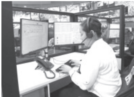
Gracias a un reporte recibido a la línea de emergencias 911, personal operador coadyuvó en la reanimación de una menor de siete años que había sufrido hipoxia, tras caer a una alberca ubicada en la zona Oriente de la ciudad de Morelia

Se hace un llamado a la sociedad para que conozca y utilice adecuadamente los números de atención y emergencias, para colaborar en la respuesta eficiente ante situaciones que pongan en riesgo la seguridad y la salud de la población.