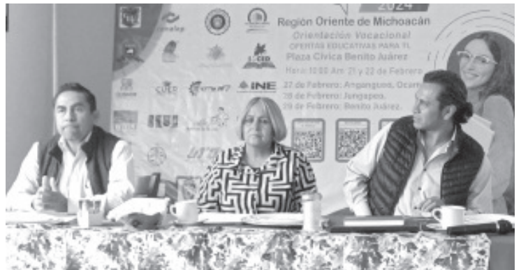
Todo está listo para la vigésima octava edición del evento SEE Orienta, actividad con el que se informa a estudiantes que están por egresar de la secundaria y preparatoria, sobre la oferta educativa existente para que continúen sus estudios.

Mediante el programa federal La Escuela es Nuestra son 5 mil 600 millones de pesos los que se han invertido en más de 16 mil acciones de equipamiento y obras de primera necesidad en planteles michoacanos.