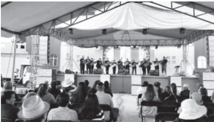
La clausura de la Expo Feria Monarca 2024, celebrada el pasado domingo 11 de febrero en el Teatro del Pueblo, fue marcada por una presentación memorable a cargo de La Rondalla de San Juan.

La participación de La Rondalla de San Juan en el cierre de la Expo Feria Monarca 2024 no solo fue un homenaje a su trayectoria de cuatro décadas, sino también un recordatorio de la importancia de la música en la celebración del amor y la amistad. Con su inconfundible estilo y su capacidad para conectar con el público, esta emblemática agrupación sigue siendo un pilar fundamental en el panorama musical de la rondalla.