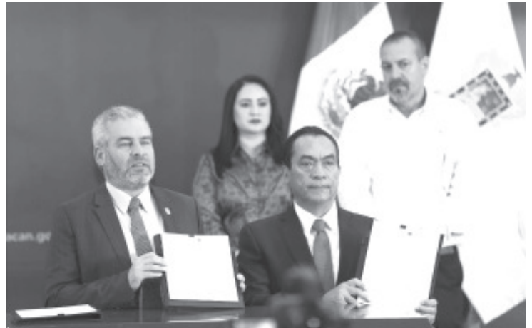
El gobernador Alfredo Ramírez Bedolla firmó el decreto por el que se declara la implementación en Michoacán del sistema de vigilancia satelital "Guardián Forestal".