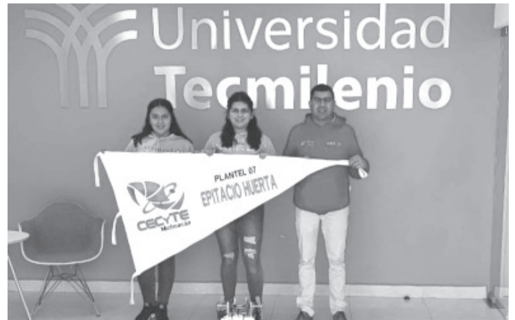
El equipo femenino del Colegio de Estudios Científicos y Tecnológicos del Estado de Michoacán (Cecytem) ganaron los títulos de Campeonas de Construcción y subcampeonas del Campeonato de Robótica y Habilidades STEM – Girl Powered 2024.