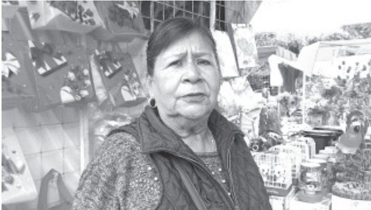
Esta ocasión más de 60 comerciantes de la Unión del 14 de febrero, se instalaron sobre la explanada del Jardín Central, y estarán dos días: 13 y 14.

- Temen bajas ventas por el cambio de lugar