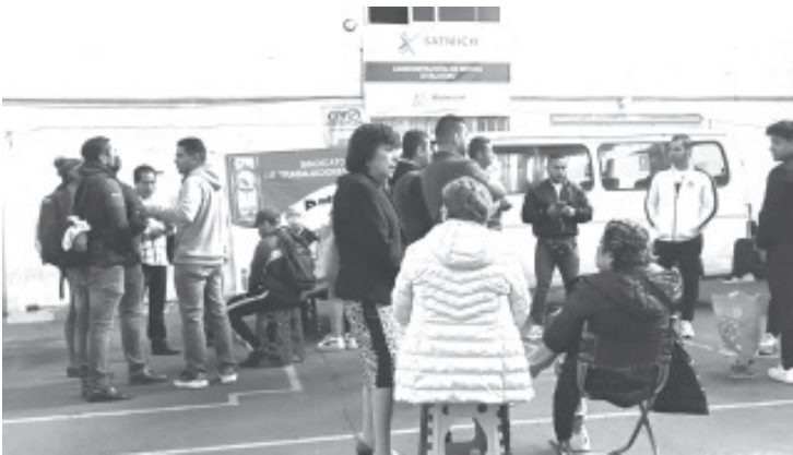
Integrantes del magisterio democrático, del Grupo Poder de Base tomaron este martes la Administración de Rentas en esta ciudad.

- Suspende este martes todos los servicios