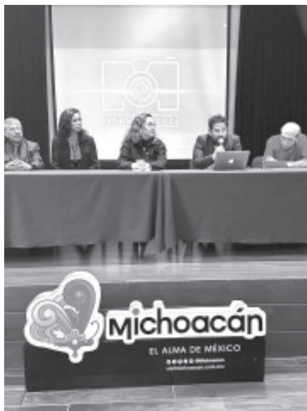
La capital michoacana será la sede de la Convención Internacional de Fotografía y Exhibición de proveedores Morelia 2024, además de recibir la celebración por el 50 Aniversario de fundación de la Sociedad Mexicana de Fotógrafos Profesionales (SMFP), informó la Secretaría de Turismo de Michoacán (Sectur).