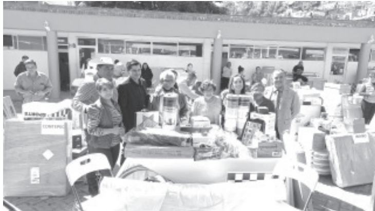
En un evento regional donde la sede fue Zitácuaro, las Estancias del Adulto Mayor del oriente recibieron equipamiento para que sigan realizando sus actividades.

Entre el equipo que se entregó estuvo material para realizar manualidades, juegos de mesa, tapetes para yoga, implementos para hacer actividad física y además equipo para que puedan escuchar música y bailar.