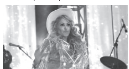
GRAN ÉXITO Rotundo obtuvo la famosa Cantante PAULINA RUBIO En concierto ofrecido en el Centro de espectáculos en la EXPO-FERIA MONARCA 2024. ZITACUARO.