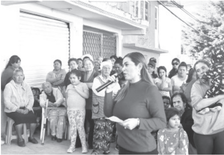
La candidata presidencial por la coalición "Sigamos Haciendo Historia", Claudia Sheinbaum, aseguró que las reformas propuestas serán parte del proyecto de nación que presentará el 1 de marzo, fecha en la que inicie campaña en el zócalo de la CDMX.

serán parte del proyecto de nación que presentará el 1 de marzo, fecha en la que inicie campaña en el zócalo de la CDMX.