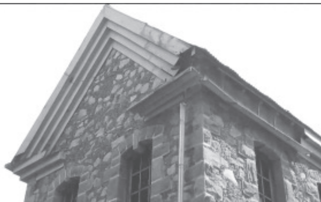
Actualmente el Museo Casona de la Estación presenta un deterioro en la parte del techo, lo cual se debe a la presencia de diferentes aves que están en este lugar como las palomas, lechuzas y hasta martinetes.

Como responsable de cultura del municipio, agregó que además de las acciones de restauración que se harán en este lugar se tiene previsto trabajar en el monumento más antiguo del municipio, como lo es el de Dr. Emilio García, lo que se pretende es que luzca más y sea más atractivo para la población.