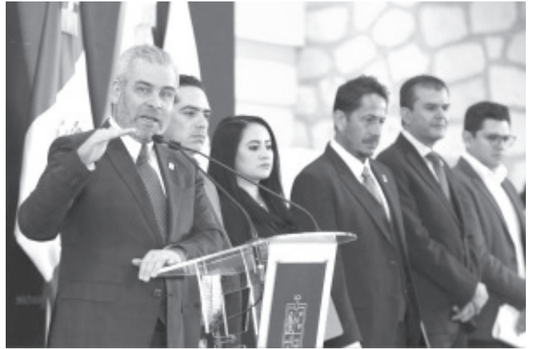
La Secretaría de Finanzas y Administración (SFA), reportó un total de 492 mil 686 trámites vehiculares generados al 31 de enero por pago de refrendo vía digital y en ventanilla.

El mandatario reconoció la responsabilidad de las y los ciudadanos para cumplir con este derecho que se genera de manera anual en Michoacán.