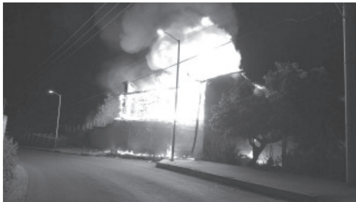
En la noche de este Jueves a las 20:30 horas, los servicios de emergencia de Bomberos respondieron a múltiples reportes telefónicos que alertaban sobre un incendio estructural en la 3ª Manzana de Nicolás Romero, justo antes de llegar a la Capilla.

Se desconocen las causas del incendio que consumió la cabaña, ubicada en la 3ª Manzana de Nicolás Romero. El Cuerpo de Bomberos de Zitácuaro desplegó la unidad 225 Zamuray, acompañada de las unidades 05, 1916 y 015, con 15 bomberos a bordo. La rápida acción de los servicios de emergencia logró evitar la explosión de un tanque estacionario de gas L.P., aunque lamentablemente la construcción fue declarada como pérdida total. Se destaca el apoyo de la comunidad y la intervención policial en el lugar del incidente. En caso de futuras emergencias, se insta a la población a contactar a los números de emergencia 7151538742, 7151649432 y 7151008419.