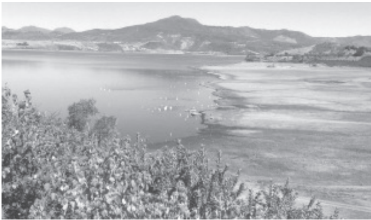
La temporada de estiaje de este año, apenas comienza y la Presa del Bosque ya comenzó su descenso de forma drástica. Por el momento según el monitoreo diario que registra la Comisión Nacional del Agua, se encuentra en el 59% de su capacidad total.

- En la temporada de lluvias no se recuperó de forma satisfactoria