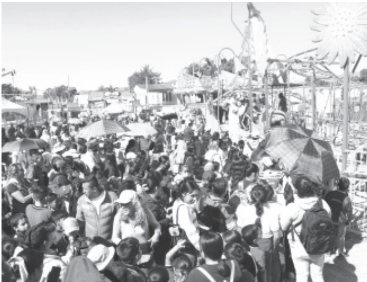
Por segundo miércoles consecutivo, como lo anunció el alcalde Toño Ixtláhuac cuando presentó la programación de la feria, alumnas y alumnos de diferentes escuelas primarias de #LaHeroica, acompañados de sus papás, disfrutaron de la Feria Monarca gratuitamente.

Como #CiudadPorLasNiñasYPorLosNiños el #GobiernoDeSoluciones promueve actividades recreativas como ésta, que impulsan el desarrollo de los menores.