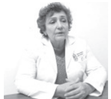
Ante el aumento de los índices de embarazos en adolescentes y enfermedades de transmisión sexual como VPH, VIH, gonorrea, sífilis entre otras, el Módulo de Servicios Amigables del Centro de Salud promueve lo que es el uso adecuado del condón masculino y femenino.

Tenemos que seguir con las acciones de prevención, vengamos a recibir la orientación sobre salud sexual y reproductiva. Completamos la información que les dan sus maestros, trabajamos desde el punto de vista médico