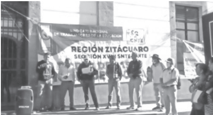
Integrantes del magisterio, del Grupo Poder de Base se manifestaron a las afueras de la Presidencia Municipal este martes. Esto para dar seguimiento a los acuerdos realizados por secretarios generales, por lo que esta misma acción se replicó en diferentes regiones del estado.

Anunciaron además que como parte de su plan de lucha, dieron inicio a un paro de labores de 24 horas y la próxima semana será de 72 horas así como algunas acciones de protesta.