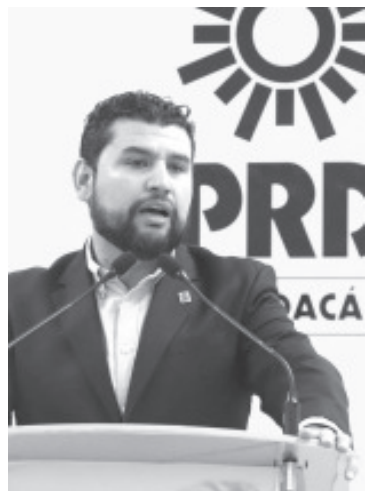
En el Partido de la Revolución Democrática (PRD) seguimos trabajando en la unidad partidaria que nos permita ser competitivos durante el proceso electoral del 2024 y alcanzar la mayoría de los triunfos, informaron las y los integrantes de la Dirección Estatal Ejecutiva

- Se implementarán algunos mecanismos que permitan transitar a candidaturas de unidad