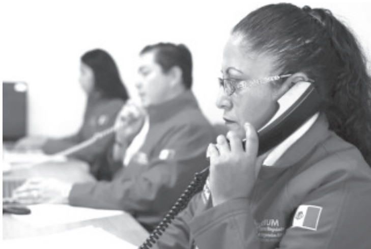
Con la línea telefónica "Hablemoos", puesta en marcha en Michoacán desde el 6 de diciembre del año pasado, 323 usuarios han llamado pidiendo ayuda y atención psicológica gratuita. Los trastornos de salud mental más atendidos han sido la depresión y la ansiedad.

Las personas que llaman a esta línea telefónica son orientadas por psicólogos e invitados a continuar una terapia presencial en uno de los 40 centros de salud de la entidad, así como a los cinco Centros Comunitarios de Salud Mental y Adicciones (Cecosamas) ubicados en Morelia, Uruapan, Zamora, Lázaro Cárdenas y Zitácuaro, a donde se puede acudir a recibir atención, terapias individuales y grupales que atiendan la salud mental del paciente.