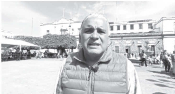
Gracias a la convocatoria realizada por el Ayuntamiento de Zitácuaro y Ecolife A.C. un total de 100 familias se verán beneficiadas con una estufa patsari que ahorra el 70% del consumo de leña.

Agregó que con este tipo de tecnología se pretende impactar en las familias de una forma integral, ya que abarca el tema económico, el de salud. En este sentido, invitó a la población estar pendientes de este tipo de programas que se llevan a cabo gracias a la coordinación que se tiene con asociaciones civiles.