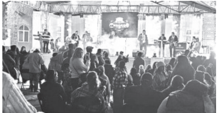
La noche de este domingo, fue una noche llena de ritmo y alegría, Los Tesoros de Tierra Caliente conquistaron el Teatro del Pueblo de la Expo Feria Monarca Zitácuaro 2024, dejando un rotundo éxito entre los asistentes.

Los Tesoros de Tierra Caliente, con su propuesta fresca y auténtica, han logrado cautivar a un público diverso que disfruta de la música regional mexicana. Su participación en la Expo Feria Monarca Zitácuaro 2024 deja un recuerdo imborrable y confirma su lugar destacado en la escena musical local.