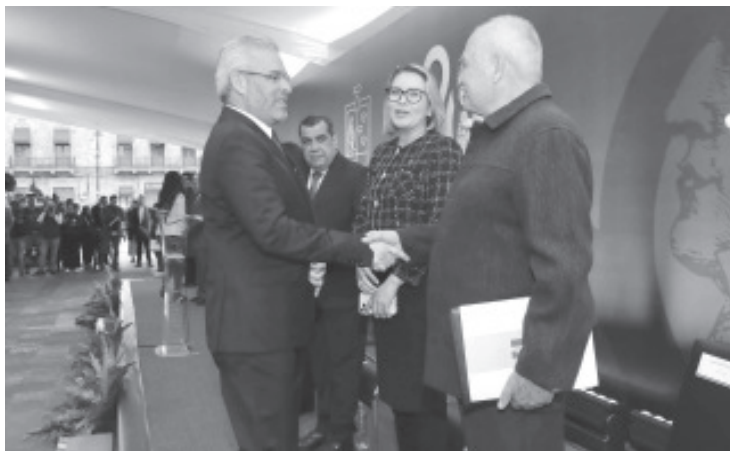
El gobernador Alfredo Ramírez Bedolla dio inicio a los festejos por los 200 años de Michoacán con un acto cívico por la promulgación como Estado libre y soberano, en la plaza Melchor Ocampo de Morelia.