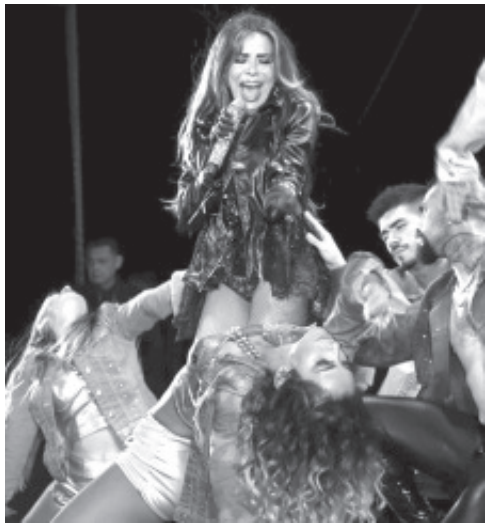
EXITOSA LA PRESENTACIÓN ARTÍSTICA DE LA CANTANTE "GLORIA TREVI" En la EXPO-FERIA MONARCA-ZITACUARO 2024. LLENO DE TALENTO, TRADICIÓN Y CULTURA.