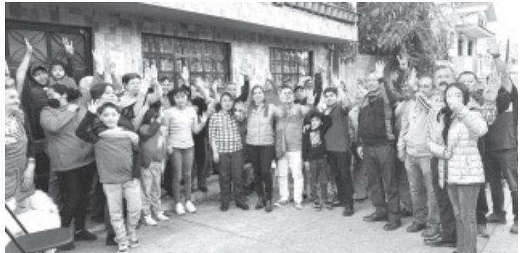
La candidata presidencial por la coalición “Sigamos Haciendo Historia”, se reunió con militantes y simpatizantes de MORENA en Tlalnepantla, Estado de México para continuar con los trabajos de organización.