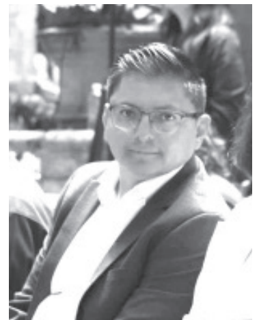
En los últimos meses, el pueblo de México ha sido testigo de un fortalecimiento sostenido de la moneda mexicana, y es innegable que la estabilidad política en nuestro país ha desempeñado un papel fundamental en este logro.