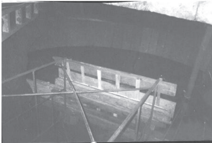
La rehabilitación y apertura de los túneles subterráneos en Palacio de Gobierno permitirá recuperar e incrementar el patrimonio turístico y cultural de Morelia, a través de la generación de un nuevo producto que detonará la derrama económica, la generación de empleos y la atracción de turismo nacional e internacional.

- Continúa el proyecto de Morelia Soterrada; UNAM realiza estudios al subsuelo