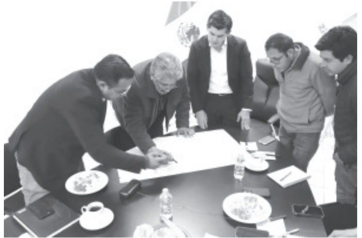
Tras meses de gestión, proyección y articulación de trabajos, este jueves #LaHeroica hará historia con el comienzo de las magnas obras proyectadas por el gobierno de Juan Antonio Ixtláhuac, junto con el respaldo del gobernador de Michoacán, Alfredo Ramírez Bedolla y la coyuntura con la iniciativa privada.