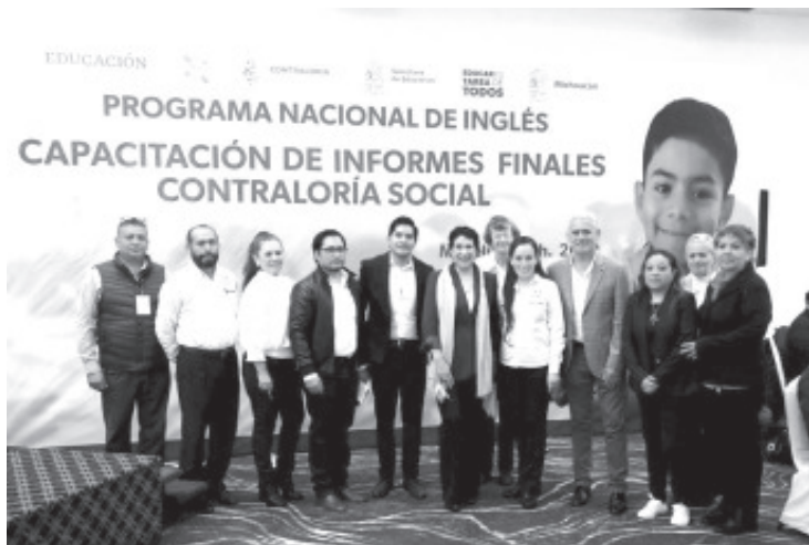
La Secretaría de Educación del Estado (SEE) mantiene ejercicios de transparencia y rendición de cuentas en escuelas beneficiarias del Programa Nacional de Inglés (Proni) con la entrega de los informes de Contraloría Social.

Michoacán es el único estado del país en realizar las acciones de Contraloría Social en colaboración con el Sistema Estatal Anticorrupción, lo cual refleja una acción concreta y puntual para combatir y prevenir la corrupción.