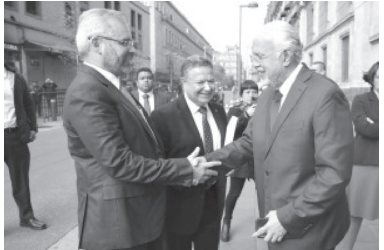
El gobernador Alfredo Ramírez Bedolla firmó la renovación del convenio de coordinación con el IMSS-Bienestar para la federalización de los servicios de salud en Michoacán, a partir del próximo 31 de marzo.

No obstante, las entidades federativas seguirán siendo patronos, mientras que el IMSS-Bienestar coordinará a los trabajadores y pagará la nómina federalizada.