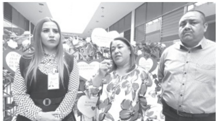
Parejas que viven en unión libre, tendrán la oportunidad de casarse y formalizar su unión mediante la campaña de matrimonios gratuitos que organiza la Dirección del Registro Civil en el Estado.

En este sentido, señalaron que es importante que las parejas estén casadas dentro de la ley, de lo contrario, cuando falte uno de ellos, el otro podría quedar en estado de indefensión y es común que sea despojado de bienes al no haber estado legalmente casado.