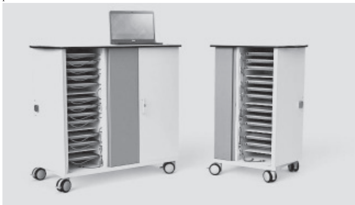
El gobernador Alfredo Ramírez Bedolla informó que, el próximo ciclo escolar mil 650 secundarias públicas serán equipadas con carritos de carga inteligente para Chromebooks con tecnología web para fortalecer la educación de alumnas y alumnos.

De acuerdo con la programación propuesta por la Secretaría de Educación en el Estado, entre junio y agosto, se estarían entregando los carritos inteligentes y se darían capacitaciones al personal docente para que una vez comenzado el ciclo escolar 2024-2025, las y los alumnos puedan hacer uso del mismo.