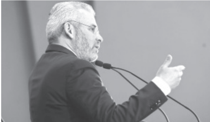
El gobernador Alfredo Ramírez Bedolla informó que la próxima semana comenzará la entrega de bases a más de 5 mil trabajadores docentes y administrativos de la Secretaría de Educación del Estado (SEE) que laboraban sin plaza definitiva.

Este proceso inhibe cualquier posibilidad de corrupción al no solicitarse, a través de intermediarios, los formatos correspondientes para realizar dicho trámite, ya que el único acompañamiento que se podría gestionar es con la Dirección General de Gobierno Digital.