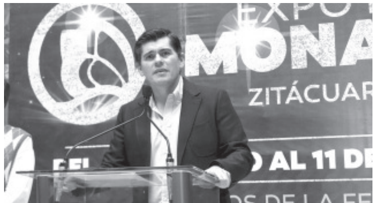
De 6 hasta 8 artistas de talla internacional se estarán presentando en la Expo Feria Monarca 2024, entre ellos Rio Roma, Yuridia, Matute, y Bronco; además hay platicas aún con los Cardenales, Flans y Pandora así como Cuisillos y los Players. Los días exactos se conocerán después del fin de semana.

Invitó a toda la población a sumarse a las actividades y disfrutar de esta feria que tendrá de todo.