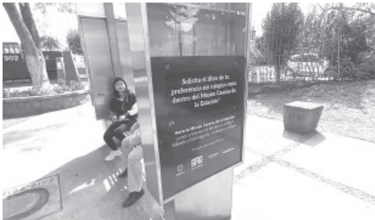
En los próximos días la Casona de la Estación llevará a cabo talleres de lectura para toda la población, con ello además se estaría reactivando el funcionamiento del módulo del paralibros

Agregó que después de la feria monarca se iniciarán talleres de literatura, para que la gente acuda este espacio en la casona de la estación.