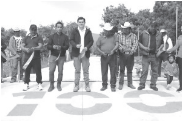
Resultado de las audiencias ciudadanas que cada semana ha realizado el alcalde Toño Ixtláhuac desde el inicio de su administración, hoy inauguró 105 metros de pavimentación a base de concreto hidráulico, en la calle La Puentequita de la Colonia Emiliano Zapata, perteneciente al ejido San Juan Zitácuaro.

"Para el #GobiernoDeSoluciones una de las prioridades es tener un municipio con mejores calles y caminos", dijo el presidente municipal. Juan Antonio Ixtláhuac recordó que a través de diferentes políticas públicas, programas e iniciativas se ha construido una importante cantidad de infraestructura carretera en todo Zitácuaro.