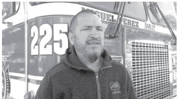
El Cuerpo de Bomberos llevará a cabo su colecta anual del 18 de enero al 21 de febrero, para ello los elementos acudirán a las diferentes salidas del municipio y en la propia base estarán recibiendo los donativos de la población.

Invitó a la población a unirse a esta causa y colaborar de alguna forma, ya que las unidades están a la disposición de todos los ciudadanos que en algún momento requieren el apoyo.