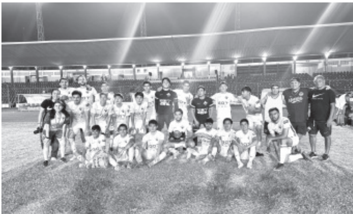
En un emocionante duelo disputado en el Estadio Olímpico de Villahermosa, el Deportivo Zitácuaro, equipo de la Liga Premier MX, se consagró campeón de la Tabasco Cup en su primera edición.

#DeportivoZitácuaro #SomosDepo #TabascoCup #Campeones #LigaPremier #FútbolMexicano