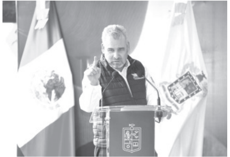
El gobernador Alfredo Ramírez Bedolla informó que de una bolsa de mil 488 millones de pesos que este año se dispondrá del Faeispum, mil 041 millones se invertirán en obras para el combate a la sequía, cuidado del agua, fortalecimiento al campo y rehabilitación carretera.