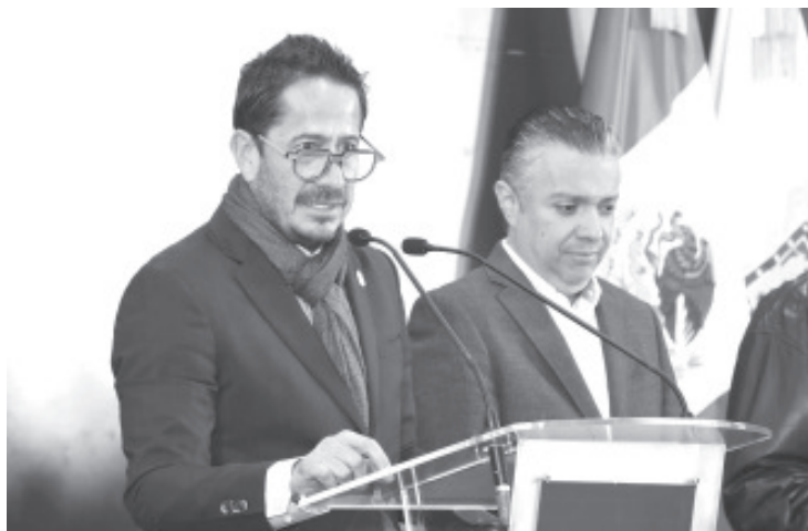
Contrario a lo que especialistas en la materia proyectaron, el incremento a nivel nacional del salario mínimo para este 2024, que pasó de 207.44 a 248.93 pesos, no repercutió en el incremento de la inflación, por el contrario, favoreció en la recuperación del poder adquisitivo, indicó el titular de la Secretaría de Desarrollo Económico (Sedeco), Claudio Méndez Fernández.

Finalmente, señaló que desde la dependencia estatal se mantendrán con los monitoreos a los precios de la canasta básica y márgenes de inflación alimentaria y general, con el propósito de delinear acciones que favorezcan el poder adquisitivo de las y los michoacanos, así como aumentar la competitividad del sector empresarial.