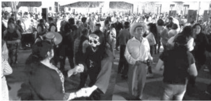
La ciudad de Zitácuaro dio inicio el nuevo año y con el primer jueves de Danzón, que marca la 103ª edición, una tradición arraigada que ha florecido durante la actual administración encabezada por el Presidente Municipal Juan Antonio Ixtláhuac.

Zitácuaro, Mich., 5 de enero de 2024.- La ciudad de Zitácuaro dio inicio el nuevo año y con el primer jueves de Danzón, que marca la 103ª edición, una tradición arraigada que ha florecido durante la actual administración encabezada por el Presidente Municipal Juan Antonio Ixtláhuac.