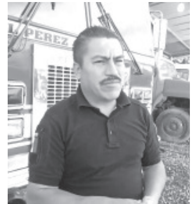
Durante el 2023, el Cuerpo de Bomberos de Zitácuaro atendieron 2800 servicios además de 178 incendios. Los incidentes más frecuentes fueron los derrapes de motos.

Invitó a la población a manejar con precaución, revisar el estado de sus vehículos, respetar la velocidad permitida y en el caso de las motos extremar los cuidados y usar implementos de seguridad como el casco.