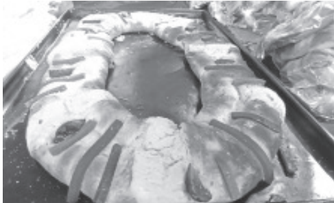
Tal y como se tenía previsto, desde este jueves se instalaron 50 panaderos tradicionales en las calles de 5 de mayo, Lerdo de Tejada y Dr. Emilio García para ofertar la rosca de reyes alusiva a la llegada de los Reyes Magos.

H. Zitácuaro Michoacán, 05 de enero de 2024.- Por: Guadalupe Solache Rebollo. Tal y como se tenía previsto, desde este jueves se instalaron 50 panaderos tradicionales en las calles de 5 de mayo, Lerdo de Tejada y Dr. Emilio García para ofertar la rosca de reyes alusiva a la llegada de los Reyes Magos.