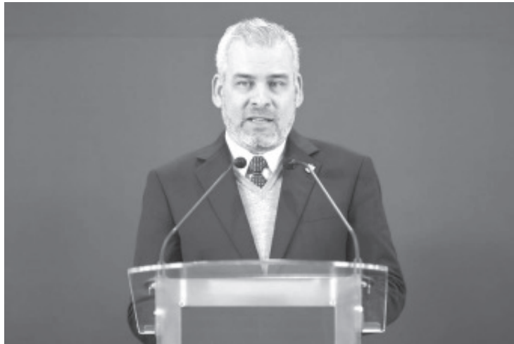
El gobernador Alfredo Ramírez Bedolla anunció que se distribuirán 43 mil 760 toneladas de fertilizante gratuito en beneficio de 77 mil 334 pequeños productores agrícolas inscritos del estado, con lo cual, Michoacán será una de las primeras entidades en repartir este apoyo del Programa Nacional de Fertilizantes para el Bienestar.

Detalló que los productores que cuenten con una hectárea o menos recibirán 300 kilogramos de fertilizante, y aquellos que cuenten de una a cinco hectáreas podrán acceder a 600 kilogramos.