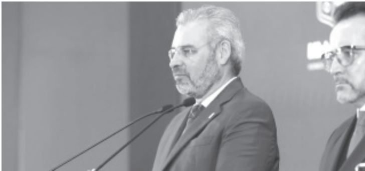
El gobernador Alfredo Ramírez Bedolla informó que este año se destinarán 5 mil 80 millones de pesos para obra pública y proyectos de desarrollo municipal.

Morelia, Michoacán, 1 de enero de 2024.- El gobernador Alfredo Ramírez Bedolla informó que este año se destinarán 5 mil 80 millones de pesos para obra pública y proyectos de desarrollo municipal.