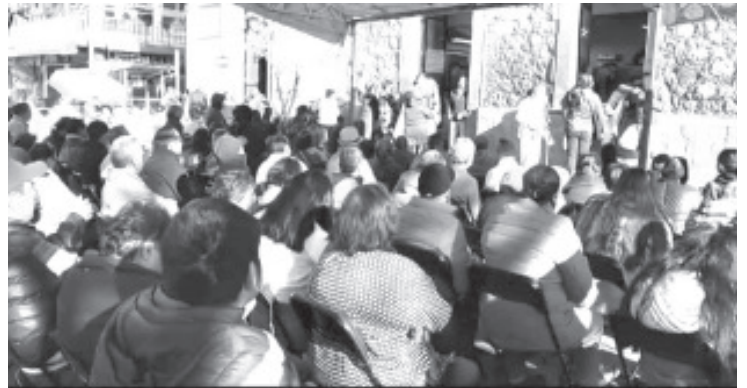
Esta semana, la oficina de Ingresos Municipales comenzó con el cobro del impuesto predial, el aumento es mínimo y equivale a un peso en la tarifa mínima.

Agrego que este municipio es el primero en todo el estado en comenzar con el cobro de los impuestos locales como el predial y el refrendo del panteón, por lo que invitó a los ciudadanos a ponerse al corriente. Además, los recursos obtenidos de este tipo de ingresos se utilizan en obras y acciones para beneficio de todos los habitantes de Zitácuaro.