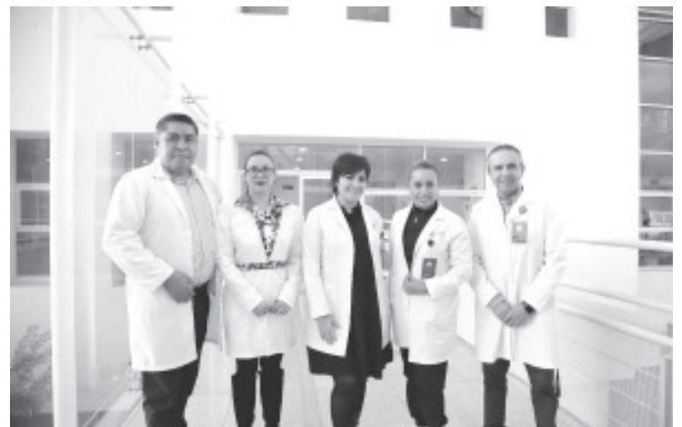
Para prevenir la diabetes, hígado graso y resistencia a la insulina en niñas y niños, la Secretaría de Salud de Michoacán (SSM) atiende los problemas de sobrepeso y obesidad infantil a través de la Unidad de Metabolismo, Alimentación y Nutrición Pediátrica, en donde el año pasado trató a 511 infantes y adolescentes.

Para solicitar atención en la Unidad de Metabolismo, Alimentación y Nutrición Pediátrica, es importante primero acudir a una consulta general de lunes a viernes de 08:00 a 17:00 horas, donde un médico revisará al menor y lo referirá con los especialistas.