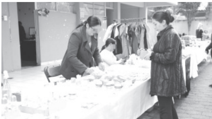
Como parte de la conmemoración del "Día Internacional de la Eliminación de la Violencia contra las Mujeres", celebrado el pasado 25 de noviembre, la Fiscalía General del Estado de Michoacán (FGE), a través del Centro de Justicia Integral para las Mujeres (CJIM) instaló un "Mercadito Naranja" en apoyo a usuarias víctimas de violencia.

La actividad se suma a la lista de acciones realizadas en el marco de los "16 Días de activismo", implementadas en búsqueda de hacer valer el derecho de las mujeres y sus familias a vivir una vida libre de violencia.