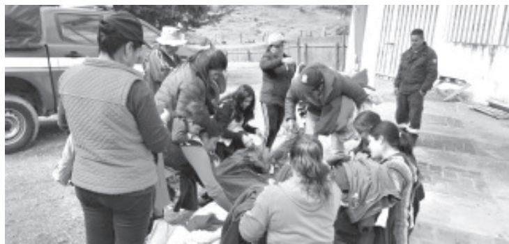
El día de hoy, Bomberos Zitácuaro llevó a cabo una conmovedora iniciativa en las localidades de Lomas de Aparicio, Michoacán, y Macia, Estado de México.

La noble acción, posible gracias a la generosidad de los habitantes de Zitácuaro que realizaron donaciones, proporcionó sweters, bufandas, chamarras, chalecos y cobijas, garantizando que aquellos menos afortunados tengan la oportunidad de resguardarse del frío invernal. Bomberos Zitácuaro, que año tras año lleva a cabo campañas de donación, demuestra una vez más su compromiso con la comunidad y su lema "No te conozco, pero daría la vida por ti". La Unidad 1916, con tres valientes bomberos a bordo, se convierte en un símbolo de esperanza y solidaridad en esta temporada navideña.