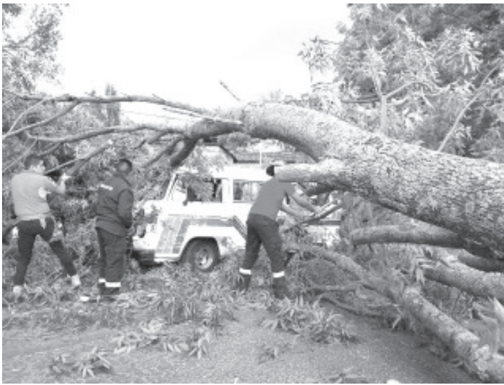
Un árbol caído interrumpió por completo el tráfico en la Carretera Zitácuaro - Tuzantla, a la altura de La Garita, según informes de Bomberos Zitácuaro.

La Unidad 1916 y la Unidad 05 de Bomberos Zitácuaro respondieron al llamado de emergencia, logrando liberar la vía tras realizar labores para retirar el árbol con la ayuda de vecinos locales. Aunque no se registraron heridos, el incidente destaca la importancia de la pronta respuesta y coordinación en situaciones de emergencia. Los Bomberos Zitácuaro instan a la comunidad a utilizar los números de emergencia proporcionados 7151538742, 7151649432, 7151008419 en casos que los requieran.