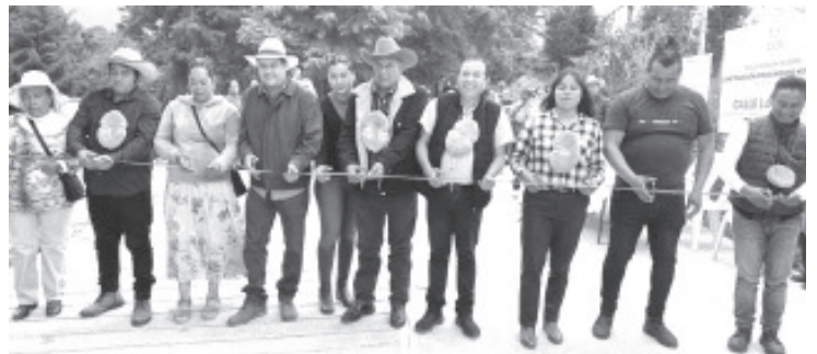
Con 1,290 metros cuadrados de pavimentación a base de concreto hidráulico se inauguró la continuación de la calle "La Loma", en donde participó la Congregación Mariana Trinitaria con un monto de $192,000.000(ciento noventa y dos mil pesos MXN) además de la participaron de todos los habitantes de la localidad de La Barranca.