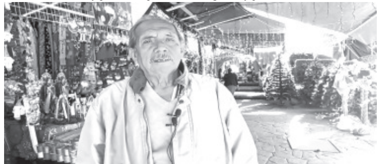
Todo tipo de artículos para las fiestas decembrinas están disponibles en la Feria Navideña que está en el Jardín Constitución de esta ciudad.