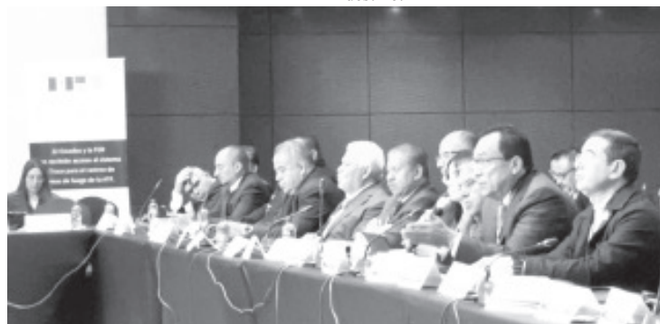
Tras asegurar que más del 80 por ciento de los homicidios ocurridos en Michoacán son perpetrados con armas de fuego, el Fiscal General, Adrián López Solís, se pronunció porque, en el marco de cooperación internacional que mantienen México y Estados Unidos, se establezcan nuevas líneas de trabajo.

Agradeció el respaldo del gobernador de Michoacán, Alfredo Ramírez Bedolla, para destinar este fondo, con base en sus reglas de operación.