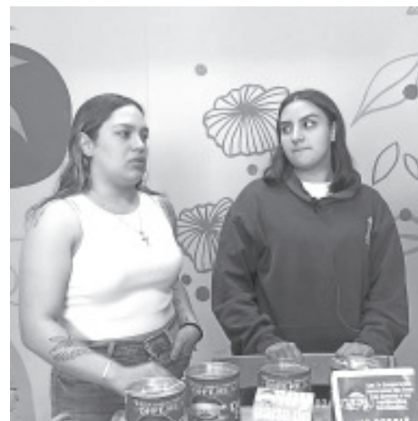
Como un mensaje de esperanza, este año Operación Pollo Zitácuaro llevará más de 1000 cenas de navidad a personas de escasos recursos la noche del 24 de diciembre.

Sobre la posibilidad de que él participe en la búsqueda de alguna candidatura, recalcó que está listo para hacerlo, y en caso de no ser así, se suma a apoyar a quien sea el designado.