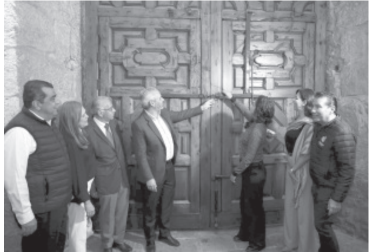
El Palacio de Gobierno, será un palacio para el pueblo, dejando de ser de reyes y virreyes, y ahora toda la población podrá apreciar la arquitectura.

Tras la restauración que se realizó de la puerta principal de este edificio emblemático