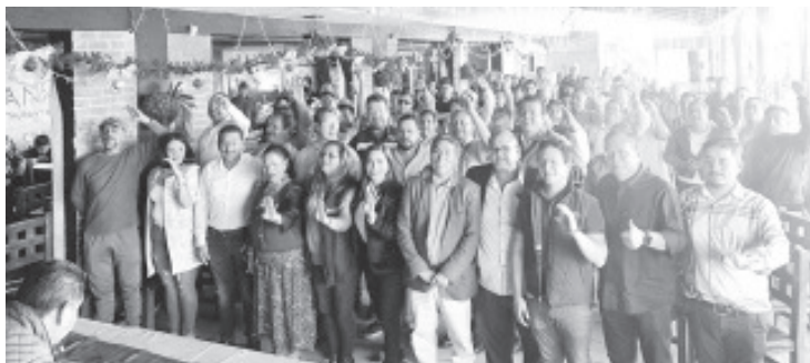
Con la presencia de militantes y cuadros representativos, liderazgos de Morena en Zitácuaro se pronunciaron por la unidad del movimiento para las siguientes elecciones del 2024. Además pidieron que no haya candidatos externos, y que tampoco haya dedazo sino que se respete la convocatoria.

H. Zitácuaro Michoacán, 15 de noviembre de 2023.- Con la presencia de militantes y cuadros representativos, liderazgos de Morena en Zitácuaro se pronunciaron por la unidad del movimiento para las siguientes elecciones del 2024. Además pidieron que no haya candidatos externos, y que tampoco haya dedazo sino que se respete la convocatoria.