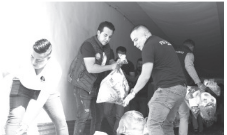
Como muestra de solidaridad de las y los michoacanos, la Fiscalía General del Estado, reunió más de 7 toneladas de víveres que en próximas horas serán enviados al estado de Guerrero para apoyar a las personas damnificadas por el huracán Otis.

Por último, el Fiscal General hizo un llamado de solidaridad y hermanamiento para seguir aportando, pues "la colecta servirá para unas familias y por algunos días", por lo que exhortó a realizar donaciones a instituciones oficiales, para que el apoyo continúe llegando a quienes más lo necesitan.