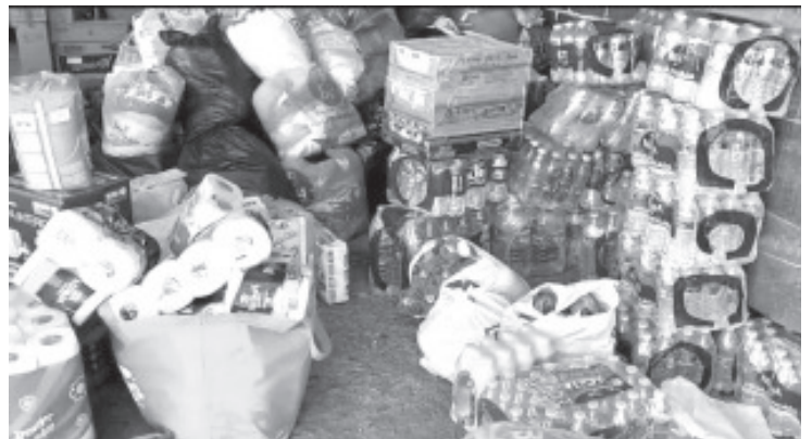
Durante la noche, 2 unidades de bomberos con más de 10 elementos a bordo salieron a Acapulco y zonas de Guerrero devastadas por el huracán OTIS para llevar víveres.