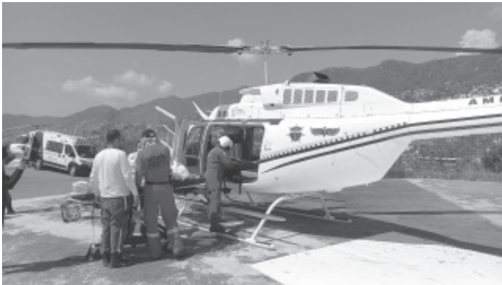
Con el despliegue de las ambulancias aéreas del Gobierno de Michoacán, llegaron a la entidad dos pacientes más procedentes de Guerrero, mismos que serán atendidos en el Centro Estatal de Atención Oncológica (CEAO) de la Secretaría de Salud Estatal (SSM).

Con estas movilizaciones médicas, ya son cuatro los pacientes que Michoacán recibe en sus centros hospitalarios con el propósito de preservar la vida y velar por su bienestar.