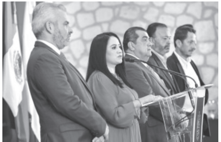
El gobierno de Michoacán mantendrá el puente aéreo con el estado de Guerrero a través de dos helicópteros, para el traslado de pacientes afectados por el huracán Otis a hospitales de la entidad, señaló el gobernador Alfredo Ramírez Bedolla.