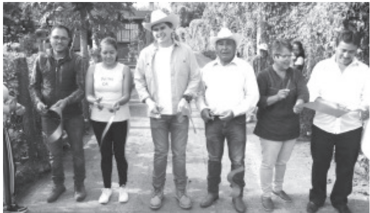
Este domingo el presidente municipal inauguró una calle en la comunidad de Ocurio, se trata de la pavimentación a base de concreto hidráulico de 120 metros cuadrados, beneficiando a todos los habitantes de esta localidad.

Reiteró que Ocurio y las tenencias aledañas han crecido en los últimos años con distintas acciones como caminos, canales de riego, redes de alumbrado y agua potable. Agradeció la participación ciudadana en distintos programas como Ruta 100 que han traído beneficios para la gente.