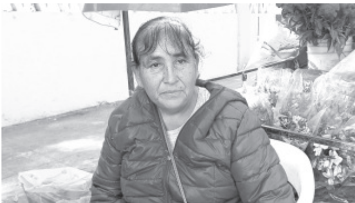
Para la celebración de Día de Muertos, los precios de las flores para estas fechas están por las cielos, por lo que la población trata de adquirir las que tienen un precio más accesible y las que son alusivas a la temporada, es el caso del Cempasúchil y la nube en ramo.

Explicó que nuevamente se entrega obra pública en beneficio de la tenencia, sumando varias acciones hechas por la actual administración.