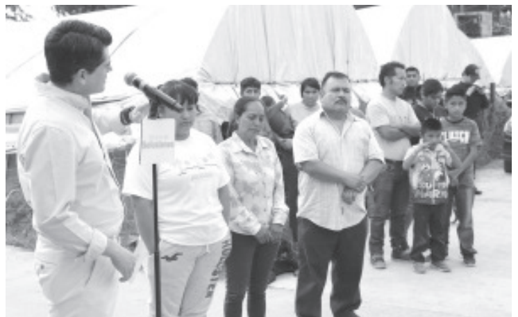
La primera manzana de San Felipe de los Alzati, recibió hoy la pavimentación de La calle Niños Héroes, construida por el #GobiernoDeSoluciones de Toño Ixtláhuac.