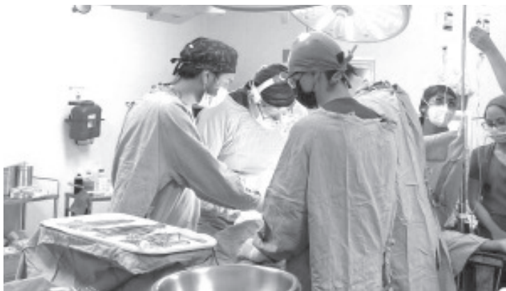
La población con diagnóstico de Enfermedad Renal Crónica (ERC) puede ingresar a la lista de espera para recibir un trasplante de riñón en el Hospital General de Morelia Dr. Miguel Silva, de la Secretaría de Salud de Michoacán (SSM).

Para obtener información adicional acerca del proceso de inscripción, la población puede comunicarse al Coetra a través del número telefónico 443 689 2609, extensión 4029, de lunes a viernes de 08:00 a 14:30 horas.