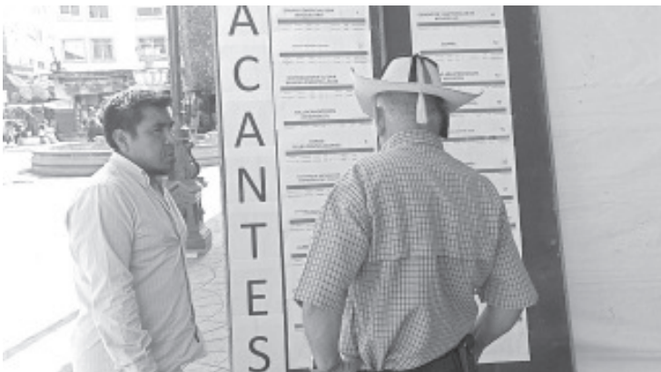
A través de una feria de empleo llevada a cabo en el centro de la ciudad, el Servicio Nacional del Empleo (SNE) ofertó más de 80 vacantes de diferentes niveles operarios.

En esta ocasión, dijo, hubo empresas que presentaron vacantes para adultos mayores, esto dijo es importante ya que normalmente no se generan vacantes para este sector de la población.