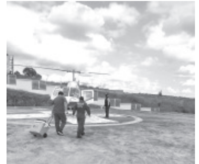
Derivado de la coordinación interestatal para la atención de urgencias médicas, este día los paramédicos de vuelo de la Dirección de Servicios Aéreos de la Secretaría de Seguridad Pública (SSP), transportaron de manera exitosa órganos de Michoacán al Estado de México, los cuales ayudarán a salvar vidas de pacientes.

Gracias a la sinergia interinstitucional se logran grandes resultados; por ello la SSP garantiza a la ciudadanía las condiciones necesarias para su bienestar y desarrollo, y está siempre a su servicio a través de los teléfonos 911 Emergencias y 089 Denuncia Anónima.