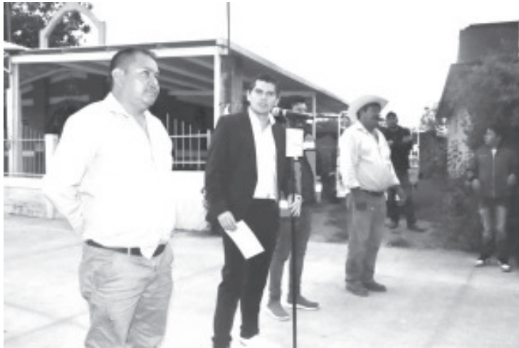
Más de 400 familias de El Granjeno, se beneficiaron con una pavimentación de más de 350 metros lineales, construida por el #GobiernoDeSoluciones.

El presidente municipal agregó que seguirá trabajando con la comunidad para que en la recta final de su administración haya más obra pública. Agradeció el interés y constante participación ciudadana de los vecinos para el avance del camino.