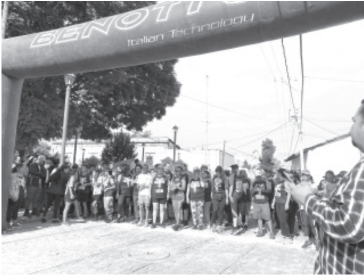
Familias enteras y deportistas fueron parte en la carrera a campo traviesa “Corre por tu mole”, que se llevó a cabo este domingo en la tenencia de Coatepec de Morelos. El evento de este año fue todo un éxito para los organizadores.

- Se premiaron los primeros lugares de cada categoría