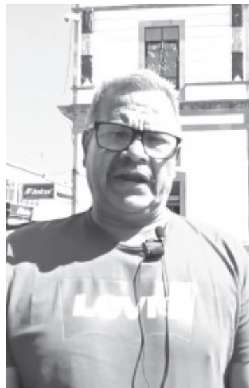
Para ofrecer eventos de calidad a zitacuarenses y visitantes, diferentes dependencias del Gobierno Municipal ya trabajan en lo que serán las actividades alusivas a la celebración de Día de Muertos de este año.

Invitó a toda la población a participar en todas las actividades, seguramente habrá por parte de todas las dependencias como Cultura, la oficina del cronista, la administración del panteón y otras más para abarcar todos los sectores.