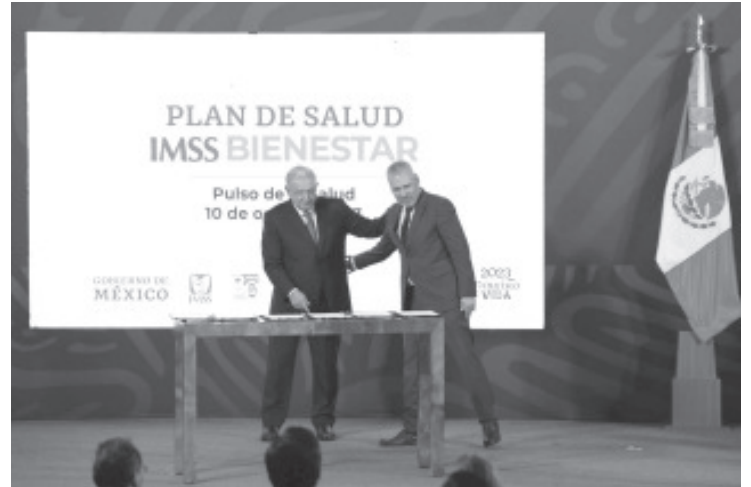
El gobernador del estado, Alfredo Ramírez Bedolla signó, junto con 22 mandatarias y mandatarios estatales, el Acuerdo de Federalización del Sistema de Salud para el Bienestar, con lo que se fortalece y garantiza la atención médica especializada para la población sin seguridad social.