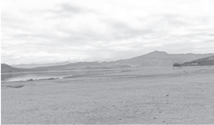
En plena temporada de lluvias, la Presa del Bosque está en descenso y se encuentra difícilmente en el 60% de su capacidad. Así lo evidenciaron pescadores de La Encarnación, los cuales solicitan la intervención de las autoridades competentes para atender el problema, para que se opere este cuerpo de agua de forma eficiente.

Los pescadores hicieron un llamado a los diferentes órganos de gobierno, tanto municipal, estatal y federal a voltear a ver a la Presa del Bosque y trabajar por mantener un buen nivel, por el momento difícilmente llega al 60% cuando debería estar casi en el 100%.