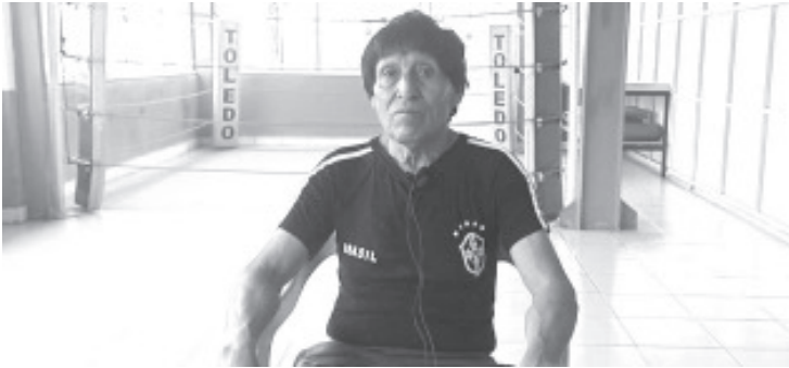
Para dar más oportunidad a niños, jóvenes y adultos a que practiquen box, el Gimnasio de Box Toledo ya funciona durante los fines de semana.

- Gimnasio de box Toledo comienza a funcionar los sábados