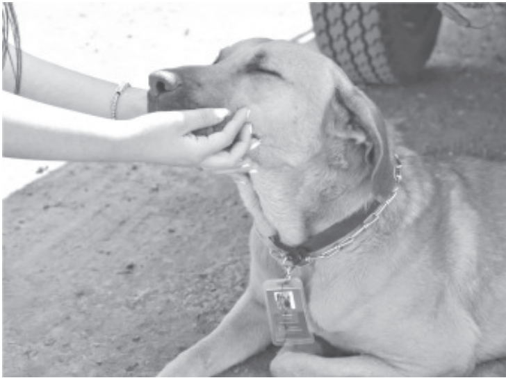
La Secretaría de Educación del Estado de Michoacán (SEE) llama a promover el bienestar y protección animal fomentando la cultura del respeto y el trato digno a todos los seres vivos; tal como se procura con "Chencho", el perrito adoptado que hoy cuida las oficinas centrales de la dependencia.

En el marco del Día Mundial de los Animales, la SEE recuerda la importancia y obligación que se tiene, desde el aula y espacios educativos, para la concientización sobre el trato digno de los animales y el respeto a todas las formas de vida.