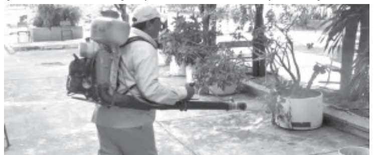
La Secretaría de Salud de Michoacán (SSM), informó que la entidad no registra reporte por algún brote de chinches en escuelas o colonias, sin embargo, no baja la guardia en la implementación de acciones de saneamiento básico, para el combate de la fauna nociva.

También se aconseja el uso de aspiradoras para eliminar algunas chinches; lavar y secar de manera regular las sábanas, frazadas, colchas y cualquier ropa de cama que esté en contacto con el piso; y de ser necesario, solicitar ayuda de un profesional.