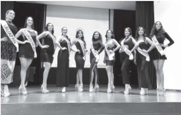
La capital del estado será sede de la final Miss Michoacán 2023, que se llevará a cabo el próximo 3 de noviembre en el Teatro Morelos y que este año lleva como lema "Belleza con Propósito".

Son 10 las finalistas que se disputaran la corona y son originarias de Uruapan, Buenavista, Morelia, Queréndaro, Pátzcuaro, Cotija, Múgica, Acuitzio y Ciudad Hidalgo.