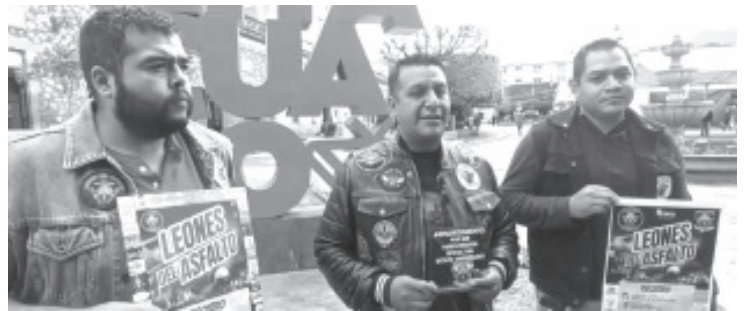
Con una rodada que iniciará en el municipio de Maravatío y culminará en Zitácuaro con una convivencia, el Club de Motociclistas "Leones del Asfalto" celebrará el octavo aniversario de su fundación.

Asimismo invitaron a todos los bikers de Zitácuaro y municipios aledaños a participar en este evento, será una experiencia inolvidable y además es para conmemorar una fecha importante para quienes integran este club.