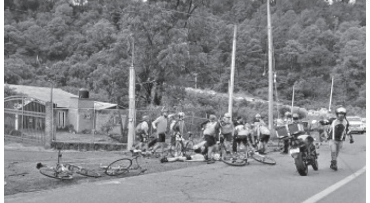
Al menos seis ciclistas que participaban en un peregrinación, resultaron lesionados al ser atropellados por un vehículo que se dio a la fuga, en la carretera libre Uruapan - Pátzcuaro.

En el sitio quedaron destruidas las bicicletas de las víctimas, en tanto que personal de vialidad tomó conocimiento de lo sucedido.