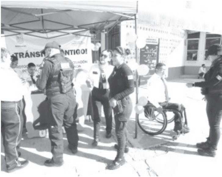
Como parte de las acciones de concientización entre el personal policial que se desempeña cotidianamente en la Secretaría de Seguridad Pública (SSP), elementos de la Dirección de Tránsito y Movilidad llevaron a cabo la campaña 'Tránsito Contigo'.

La Organización de las Naciones Unidas (ONU) ha establecido el 25 de cada mes como 'Día Naranja', por lo que exhortamos a la población femenina a denunciar cualquier acto de violencia al teléfono de emergencias 911 o de denuncia anónima al 089.