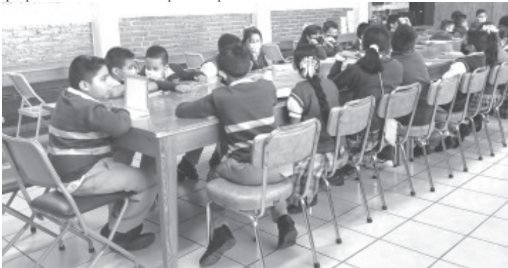
Como parte de las acciones destinadas al cuidado de la salud de la población, pláticas con este tipo de temas se imparten en niños de quinto y sexto de primaria.

Asimismo a pesar del poco personal que tiene esta oficina, dijo que se cuenta con la disponibilidad para dar esta información a quien lo solicite en alguna escuela o bien puede acudir directamente al módulo Mapia en el centro de salud donde hay personal capacitado que puede dar la orientación que se requiere.