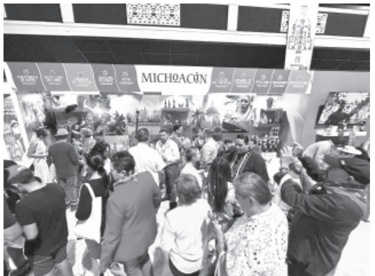
Ante un mercado Internacional, Michoacán promueve sus diversas riquezas naturales, gastronómicas y culturales, en el Segundo Tianguis Turístico de Pueblos Mágicos que se desarrolla en Los Angeles, California

El titular de la Sectur destacó la importancia de promover los atractivos de Michoacán ante uno de los mercados más importantes para la entidad como Estados Unidos, reiteró ante empresarios michoacanos el compromiso del Gobierno de Michoacán y la coordinación con el Gobierno de México, a través de la Secretaría de Turismo por posicionar al estado como el principal destino turístico de México.