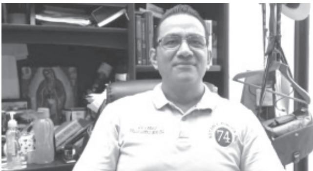
La realización del testamento en su modalidad general o universal baja de precio en cada una de las notarias de todo el país, dicha promoción aplica durante septiembre.

Agregó que muchas personas tienen miedo de hacer su testamento, pues piensan que en cuanto lo hagan ya no podrán hacer uso de sus bienes, esto es equivocado pues el testamento cobra vigencia hasta que la persona ha fallecido sigue siendo titular absoluto además que lo puede revocar cuando así lo crea pertinente.