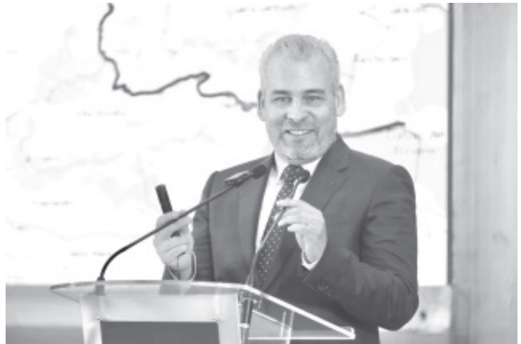
El Hospital de la Universidad Michoacana de San Nicolás de Hidalgo (UMSNH), tendrá como sede el antiguo Hospital Infantil de Morelia ubicado en el bosque Cuauhtémoc, dio a conocer el gobernador de Michoacán, Alfredo Ramírez Bedolla.

“Va a ser un hospital público abierto a cualquier persona, no sólo a los alumnos de la UMSNH”, finalizó.