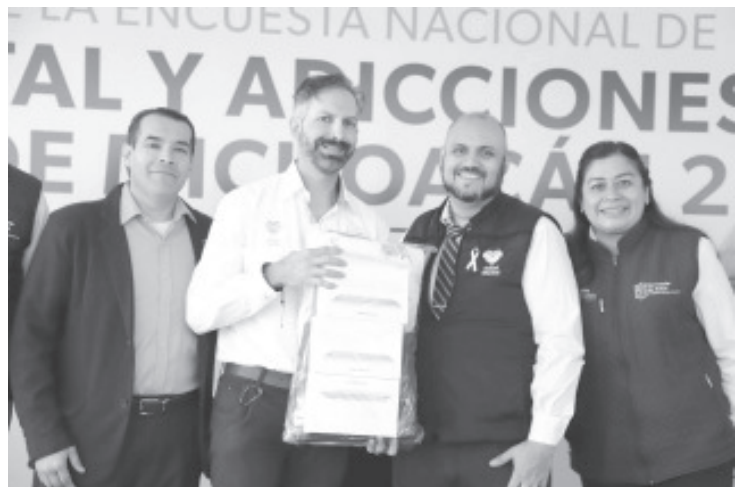
Para conocer el estado actual de la salud mental y las adicciones, e implementar acciones tendientes a prevenirlas, atenderlas y desalentarlas, arrancó en Michoacán la Encuesta Nacional de Adicciones 2023.