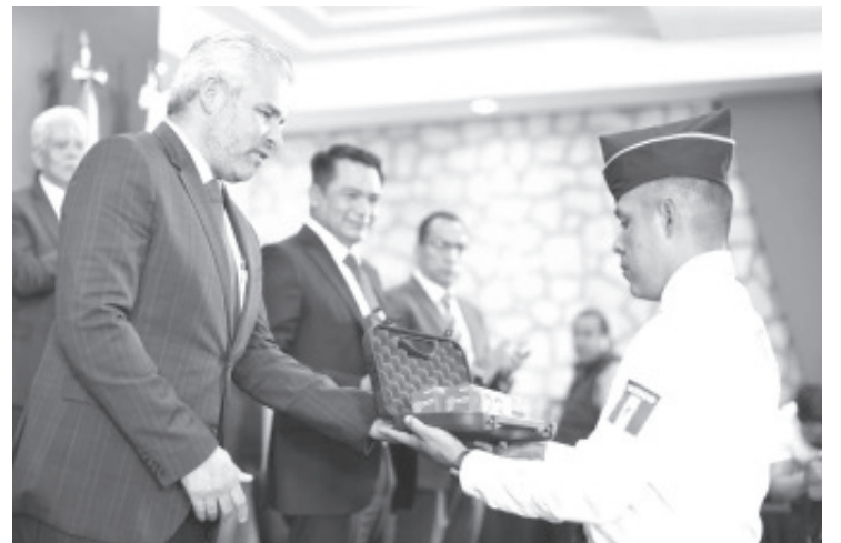
El Fondo de Fortalecimiento para la Paz (Fortapaz), creado para robustecer las capacidades operativas de instancias de seguridad pública, es efectivo y se consolida como único en su tipo a nivel nacional, afirmó el gobernador Alfredo Ramírez Bedolla.

El titular del Secretariado Ejecutivo del Sistema Estatal de Seguridad Pública, César Erwin Sánchez Coria, informó que a través del Fortapaz, se destinaron casi 29 millones de pesos para la compra de este armamento, de los cuales el 86 por ciento fueron recursos del estado y el resto de los municipios y comunidades indígenas con autogobierno que participaron en el programa en 2022.