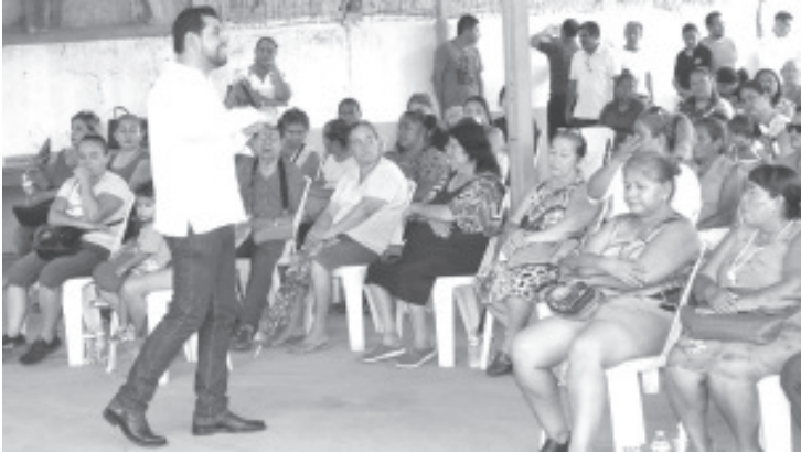
En intensa gira de trabajo de este fin de semana, el líder del Partido de la Revolución Democrática (PRD), Octavio Ocampo Córdova, tomó protesta a los nuevos integrantes de la dirigencia municipal del PRD en Taretan y de Lázaro Cárdenas.

- En Taretan y Lázaro Cárdenas, líder del PRD toma protesta a las nuevas dirigencias municipales