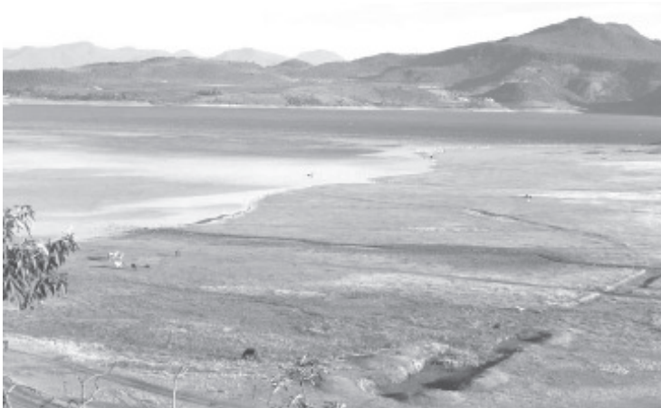
Ambientalistas locales y de toda la región están sumamente preocupados ya que las principales presas del sistema Cutzamala presentan hasta el momento bajos niveles, difícilmente llegan al 60% de su capacidad.

H. Zitácuaro Michoacán, 25 de septiembre de 2023.- Por: Guadalupe Solache Rebollo. Ambientalist