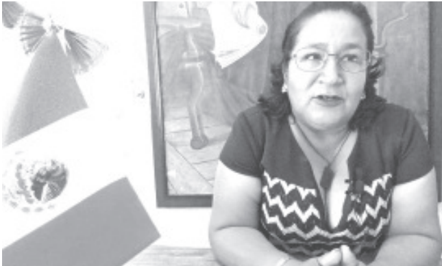
Todo se encuentra listo para que la tenencia de Coatepec de Morelos celebre el 268 aniversario del natalicio de Don José María Morelos y Pavón.

Cómo jefa de tenencia del lugar, invitó a toda la población de los alrededores de Zitácuaro a ser parte de las actividades y acudir a disfrutar de los antojitos que se venden durante las fiestas cívicas, que pueden ser desde corundas, tamales de espiga, rosquetes y el tradicional mole de San Pancho.