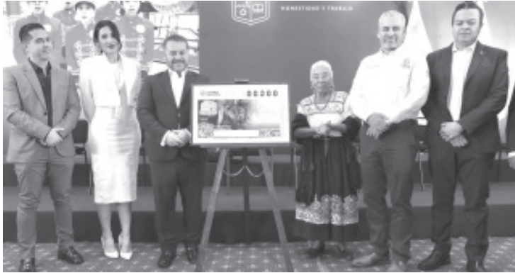
El gobernador Alfredo Ramírez Bedolla, realizó la develación del Bilete de Lotería conmemorativo a "Las Corundas", con el cual Michoacán forma parte de la campaña de platillos tradicionales de las 32 entidades federativas.

- En el marco del 65° Aniversario de la Canirac, se imprimen 3 millones 600 mil cachitos donde aparece este platillo de comida tradicional michoacana.