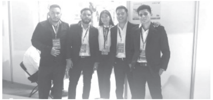
El Tecnológico Nacional de México Campus Zitácuaro obtuvo el primer lugar en la categoría Cambio Climático de la Cumbre Nacional de Desarrollo Tecnológico, Investigación e Innovación 2023, que se llevó a cabo en la ciudad de San Luis Potosí en su etapa regional.