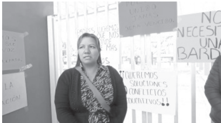
Madres de familia de la escuela Primaria Emiliano Zapata de La Garita, se manifestaron a las afueras de esta institución y bloquearon la carretera salida a Tuzantla por más de 3 horas. La acción fue para pedir la intervención directa de personal de la SEE en el estado, ya que la directora del Jardín de Niños Miguel de Cervantes, que está a un lado de la primaria quiere construir por la fuerza una barda para dividir ambas instituciones,