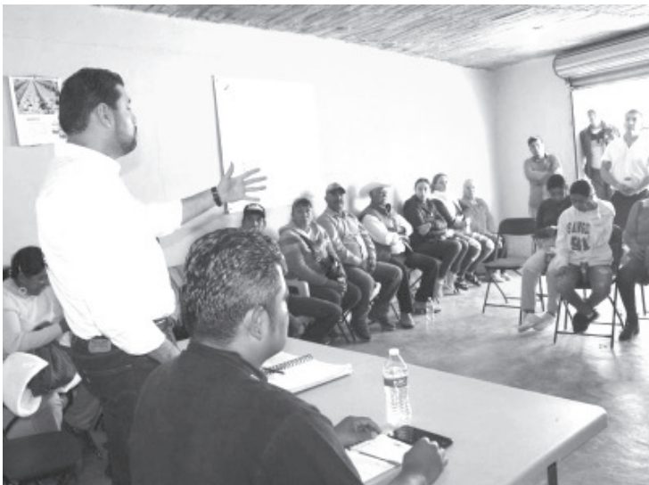
En presencia de militancia, lideresas y liderazgos de esta región, el líder del Sol Azteca explicó que el proceso electoral 2023-2024 ya inició por lo que es importante ir definiendo algunos temas propios de la elección.

No están solos, vamos juntos en esto y estamos decididos a dar la batalla y recuperar espacios, vamos a respetar a nuestra militancia que es lo más valioso que tenemos, dijo al concluir.