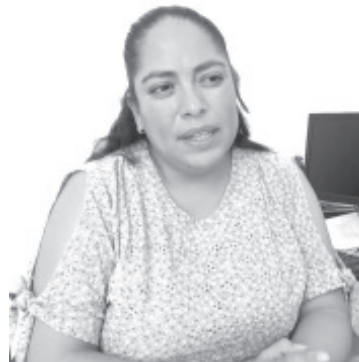
En los últimos días a nivel local se ha tenido un incremento en el número de casos de covid-19, lo que demuestra que este virus llegó para quedarse y ya forma parte de las enfermedades que se registran en determinadas temporadas del año.

En este sentido, precisó que todos los días a las 8:00 de la mañana y a la 1:00 de la tarde se entregan las diferentes fichas para consultas, por lo que la población debe acudir para recibir la atención, en promedio cada médico de los consultorio