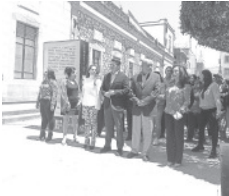
Para informar a los ciudadanos de las actividades que se tendrán durante las fiestas patrias, el Gobierno Municipal fijó el bando de actividades alusivos a estas fechas.

Asimismo recordó que en aquel tiempo un grupo de personas se reunieron para buscar la independencia del país, ahora las generaciones actuales se deben reunir para