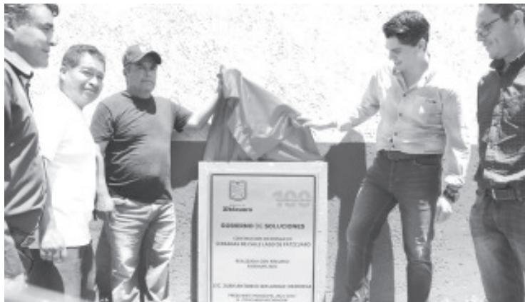
Con obras integrales que promueven el desarrollo social de los zitacuarenses, el gobierno de Toño Ixtláhuac continúa avanzando. En este sentido, el presidente municipal inauguró una red de drenaje en Pueblo Nuevo.

El edil señaló que su administración está comprometida con destinar recursos en obras integrales; pavimentaciones, servicios básicos como agua potable, drenaje y alumbrado público que elevan la forma de vida de la comunidad. Aseguró que seguirá trabajando por el progreso de La Heroica.