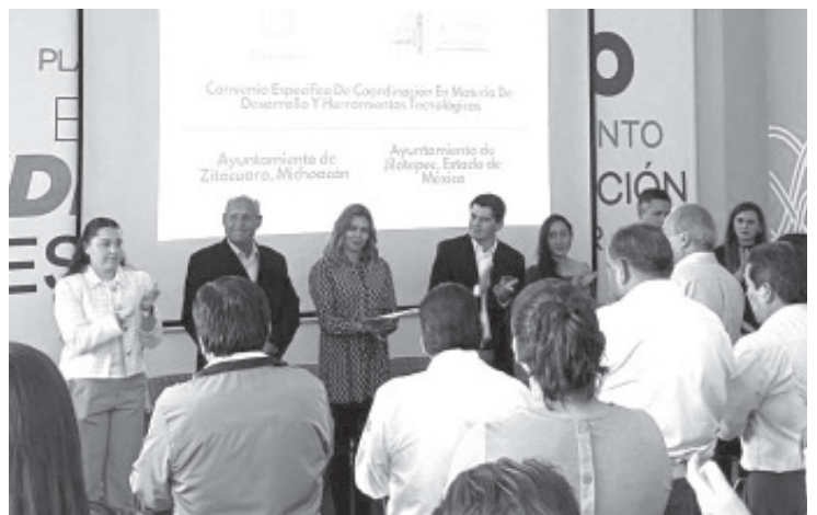
La Secretaría de Desarrollo Económico (Sedeco) otorgó un reconocimiento al municipio de Zitácuaro en materia de Mejora Regulatoria al ofrecer trámites más rápidos, sencillos, menos costosos y transparentes en beneficio de sus habitantes.

Por otra parte, se llevó a cabo la firma de convenio de colaboración entre Zitácuaro y el municipio de Jilotepec, Estado de México, en materia de Desarrollo y Herramientas Tecnológicas para mejorar la gestión gubernamental en el ámbito digital.