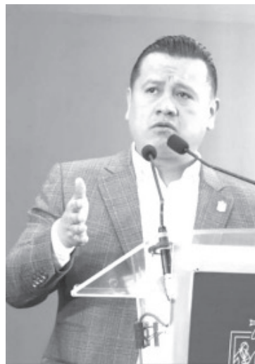
Las reformas políticas que propone el gobernador Alfredo Ramírez Bedolla en el Plan Morelos van encaminadas a recuperar la confianza ciudadana en las instituciones, y a formar un nuevo Estado de Derecho que responda a las necesidades de la sociedad michoacana actual. Así lo manifestó el secretario de Gobierno, Carlos Torres Piña,

“El Plan Morelos es una agenda social de participación ciudadana para la refundación del Estado en una Cuarta República, para reformar y ampliar derechos a favor de la población. Propone reformas y acciones para fortalecer los derechos humanos, civiles, políticos, económicos, sociales, culturales y ambientales, que consoliden además los avances de la Cuarta Transformación”, aportó. Finalmente, el secretario de Gobierno