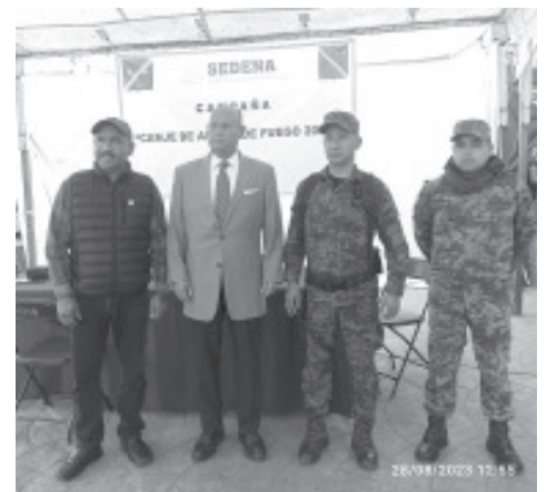
Ciudadanos que tengan en su poder alguna arma de fuego, la podrán canjear por un recurso económico y así evitar algún accidente en su casa.

El encargado de la política interna del municipio, invitó a los ciudadanos de Zitácuaro que tengan una arma de fuego a participar y con ello evitar algún accidente dentro de los hogares, al mismo tiempo se contribuye a la paz.