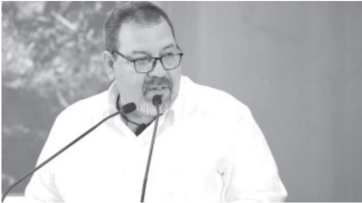
La Secretaría de Medio Ambiente (Secma) convoca a participar en la construcción del Plan Morelos, propuesto por el gobernador Alfredo Ramírez Bedolla, para crear una agenda común de derechos ampliados, incluidos los ambientales.

- Desde ahora impulsa acciones que ayuden a garantizar el derecho a un medio ambiente en buenas condiciones