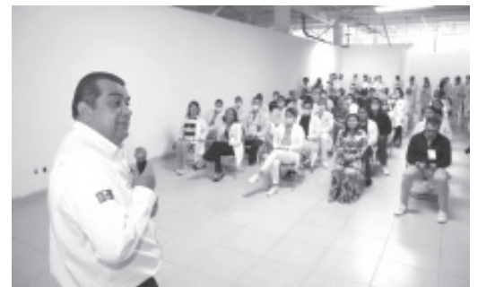
El Hospital Infantil Eva Sámano de López Mateos de la Secretaría de Salud de Michoacán (SSM), es el primero en el estado en contar con una Unidad de Metabolismo, Alimentación y Nutrición Pediátrica (UMANPe), lo que permitirá prevenir la obesidad y el sobrepeso.