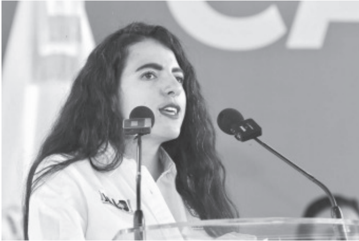
Elevar a rango constitucional los programas del Bienestar, como propuso el gobernador Alfredo Ramírez Bedolla en el Plan Morelos, le permitirá a Michoacán avanzar en los derechos sociales a favor de la población vulnerable.

- Le permitirá a Michoacán avanzar en los derechos sociales a favor de la población vulnerable: Bugarini