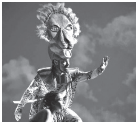
EXITOSA PRESENTACIÓN Artística Musical del “REY LEÓN” Por la Escuela de Danza “NATALIA MAKAROVA” En el Teatro Mariano Matamoros en Morelia con un lleno total. ¡FELICIDADES!