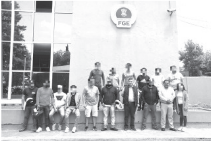
A través del Centro de Atención a Víctimas, el PRI Michoacán brindó asesoría y acompañamiento a 37 personas defraudadas con la promesa de Visas de trabajo en los Estados Unidos.

- Mediante el Centro de Atención a Víctimas se les asesoró y acompañó en la presentación de la denuncia ante la Fiscalía General del Estado y en todo el desarrollo del proceso jurídico.