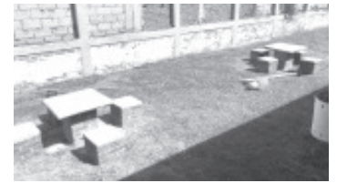
A menos de una semana de que inicien las clases, amantes de lo ajeno entraron a robar en el Jardín de Niños "Eva Sámano de López Mateos" de la colonia Poetas.