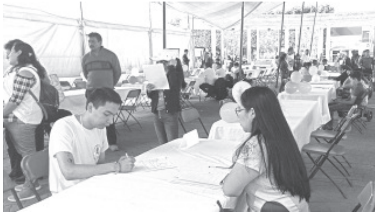
Empresas y buscadores de empleo pudieron vincularse gracias a la Feria de Empleo "Para la inclusión laboral de la juventud", por lo que la actividad resultó todo un éxito.

El funcionario invitó a las personas que están en busca de algún trabajo, a recorrer a la unidad operativa del SNE en esta ciudad, ahí se le puede vincular con negocios o empresas que buscan algún nuevo elemento.