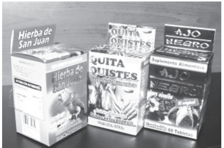
Como parte de la estrategia para reforzar las acciones contra supuestos remedios para la salud, la Secretaría de Salud de Michoacán (SSM), a través de la Comisión Estatal para la Protección contra Riesgos Sanitarios (Coepris), alerta a la población sobre el riesgo de consumir productos engaño, antes llamados productos milagro.

Por ello, la Comisión Estatal para la Protección contra Riesgos Sanitarios invita a no consumir ni comprar cualquier producto que no cumpla con la normativa vigente, desecharlos o destruirlos y denunciar al correo: denuncias.coepris@salud.michoacan.gob.mx.