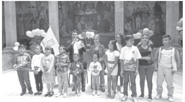
Un total de 42 niños y niñas concluyeron cursos de verano implementados por la Secretaría de la Mujer. Algunos de ellos fueron: defensa personal, elaboración de pasteles, aplicación de niñas, entre otros más y todos ellos tuvieron una duración de un mes.

Todos los niños participantes recibieron un reconocimiento así como un pequeño presente del alcalde municipal.