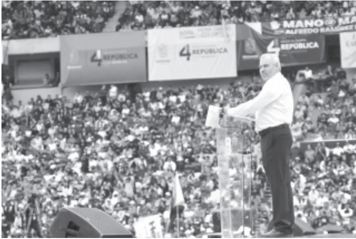
El gobernador Alfredo Ramírez Bedolla, enfatizó que en Michoacán los libros de texto estarán en las manos de las niñas y niños porque es una batalla por el humanismo.