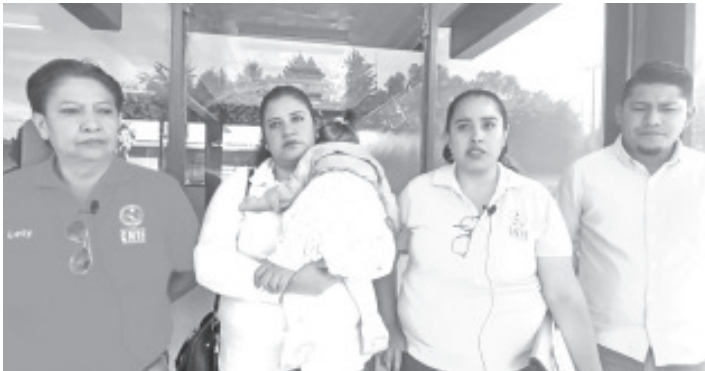
Escuelas pertenecientes a la zona escolar 041 de esta región Zitácuaro, no regresarán a clases el próximo lunes como tiene previsto la Secretaría de Educación (SEE).