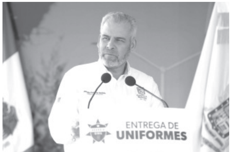
El gobernador Alfredo Ramírez Bedolla, adelantó que se interpondrá una denuncia pública ante la Fiscalía General del Estado (FGE), por el delito de extorsión a la industria de la tortilla en Uruapan, e instruyó reforzar la coordinación en materia de seguridad para custodiar esta región.