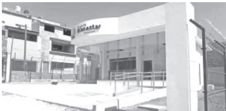
A más tardar en el mes de septiembre deberá comenzar a funcionar el banco de Bienestar en Zitácuaro, pues a nivel región es el que está pendiente.

Mientras esto ocurre, la funcionaria del gobierno federal recomendó hacer uso de instituciones bancarias como Santander, HSBC donde no cobran y dan un buen servicio; también de Banco Azteca, Coppel, y Caja Popular Morelia Valladolid dónde la comisión que cobran es simbólica.