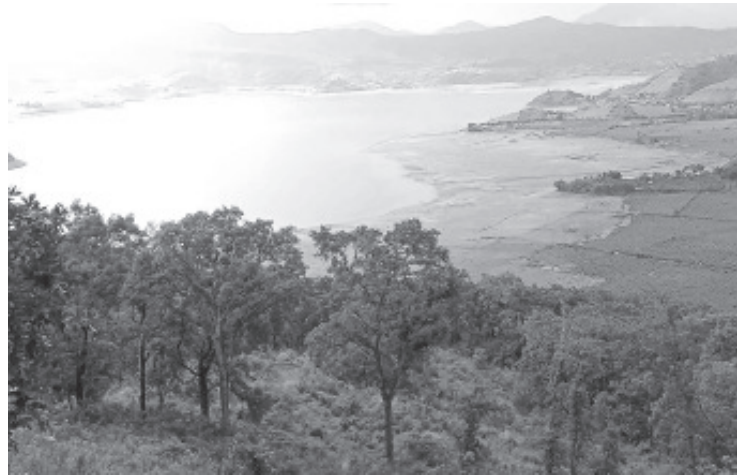
Gracias a las lluvias abundantes que se registran desde hace más de 30 días, poco a poco la Presa del Bosque muestra señales de recuperación.

“Hacemos un llamado a que en adelante no se vuelva a tirar ningún árbol más, ya que son los grandes reguladores de la temperatura, y después de vivir las ondas de calor a causa del cambio climático parece que no hemos entendido la importancia de los árboles”