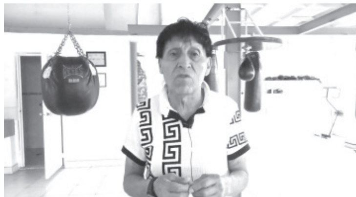
El próximo 13 de septiembre, el Gimnasio de Box “Toledo”, cumplirá 20 años de tradición en el municipio fomentando esta actividad deportiva.

El gimnasio de box Toledo está ubicado en la calle Dr. Emilio García Sur 98, planta baja y cuenta con casi 40 alumnos. Funciona de lunes a viernes en un horario de 4 a 9 de la noche.