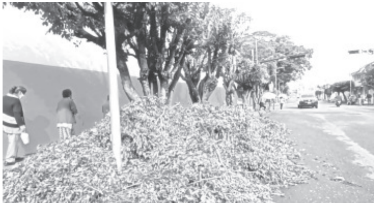
A días de que podaran y derribaran árboles que están en la esquina de las calles Hidalgo y General Pueblita, ambientalistas se pronunciaron en contra de dicha acción.