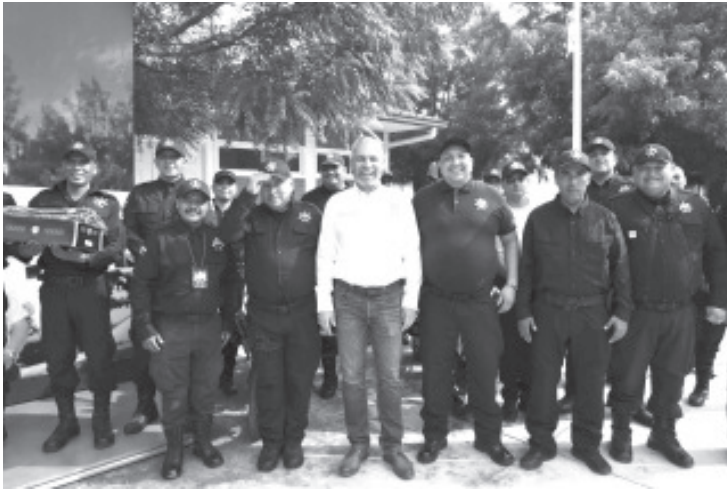
En reunión del Grupo de Inteligencia Operativa (GIO), encabezada por el gobernador Alfredo Ramírez Bedolla, se acordó mantener las estrategias de seguridad pública para resguardar la región de Apatzingán y preservar la paz de los ciudadanos.