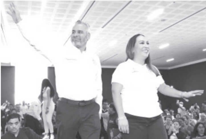
"Las mujeres hoy no están solas, cuentan con mi gobierno", señaló el gobernador Alfredo Ramírez Bedolla al encabezar la entrega de apoyos del programa para Mujeres con Cáncer de Mama y/o Cérvicouterino Invasor, que llegó a mil beneficiarias.

• Anuncia Gobernador que enviará al Congreso una iniciativa para elevar a rango constitucional este programa para mujeres y niños