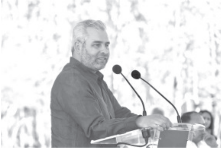
El gobernador Alfredo Ramírez Bedolla informó que ya se realizan estudios para alcanzar la meta de 200 mil hectáreas de superficie forestal decretadas como áreas naturales protegidas.

- Lo que permitirá incrementar más del 100% la superficie actualmente decretada para su conservación