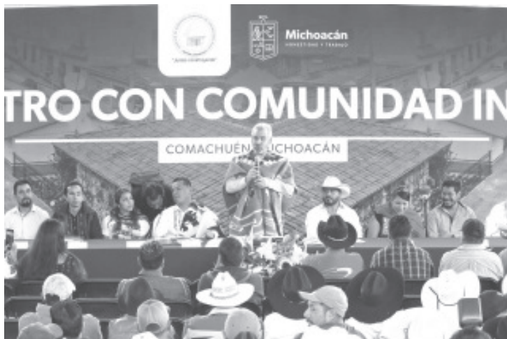
El gobernador Alfredo Ramírez Bedolla inició en Sevina y Comachuen, del municipio de Nahuatzen, gira de trabajo en las 32 comunidades indígenas regidas por autogobierno para inaugurar obras y platicar con ciudadanas y ciudadanos para escuchar sus principales necesidades.

Se pide a la población que habita en zonas de la costa o en zonas rurales, mantenerse informado sobre el pronóstico diario del clima, alejarse de zonas de riesgo como playas, ríos, arroyos y barrancas, tener a la mano los números de emergencia de su municipio y localizar los refugios temporales o albergues más cercanos.