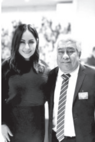
Es necesario fortalecer las condiciones para que las y los jóvenes puedan continuar sus estudios una vez que concluyen la secundaria o el nivel medio superior, subrayó la diputada Gloria Tapia Reyes, vicecoordinadora del Grupo Parlamentario del Partido Revolucionario Institucional en la LXXV Legislatura del Congreso del Estado.

-Al participar en la clausura del ciclo escolar 2022-2023, en la Escuela Secundaria Número 1, "Nicolás Romero", la diputada por el Distrito de Zitácuaro reconoció el esfuerzo de las y los jóvenes que concluyeron sus estudios