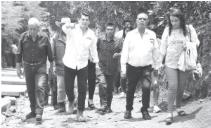
El gobierno de la Heroica ha dotado de más Mil toneladas de cemento a Comunidades y colonias en la mejora y conservación de la red de caminos y calles con el programa #Ruta100.