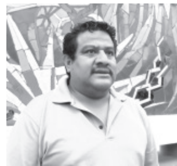
Artesanos locales alistan lo que será una expo muestra artesanal del 20 al 25 de este mes en la explanada de la Plaza Cívica Licenciado Benito Juárez de esta ciudad.

Entre las artesanías que estarán se encuentran juguetes de madera, alfarería, dulces tradicionales, prendas de lana, entre otros.