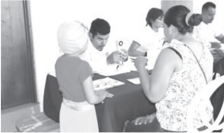
En acompañamiento a las 400 familias cuidadoras de niñas y niños con cáncer registradas ante la Secretaría del Bienestar (Sedebi) en Michoacán, la dependencia otorga un apoyo de 4 mil pesos durante su tratamiento, y en caso de fallecimiento.

- Los deudos tienen derecho a un pago de marcha en caso de fallecimiento.