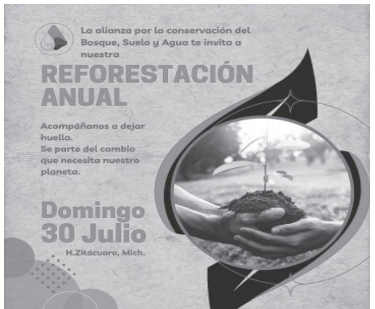
La Alianza por la Conservación del Bosque Suelo y Agua A.C. llevará a cabo el 30 de julio su jornada de reforestación anual en un predio con vocación forestal en San Felipe los Alzati, en los límites con el municipio de Ocampo.