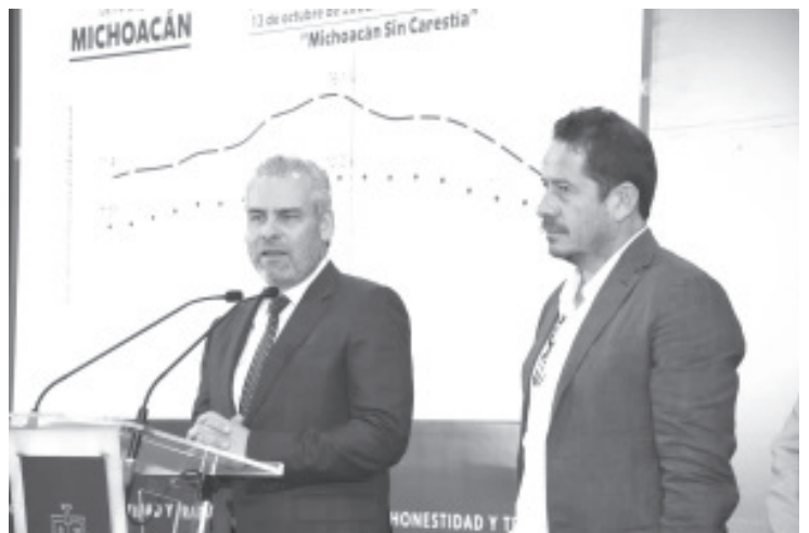
El gobernador Alfredo Ramírez Bedolla destacó que el costo de la canasta básica se mantiene estable y acorde con los índices inflacionarios, lo que refleja una buena señal para la economía de Michoacán.

Sobre el costo del kilogramo de huevo, Méndez Fernández refirió que se identificó una diferencia de 7.90 pesos entre el más alto y el más bajo.