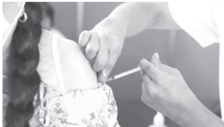
La Secretaría de Salud de Michoacán (SSM) invita a la población a iniciar o completar los esquemas marcados en la cartilla de vacunación durante la Primera Jornada Nacional de Salud Pública, que se lleva a cabo del 10 al 21 de julio.

La vacunación ayuda a prevenir enfermedades graves, de ahí la importancia de participar en la Primera Jornada Nacional de Salud Pública, donde además de vacunas, se ofrecen consultas médicas gratuitas, diagnósticos nutricionales, revisiones bucodentales, y detecciones de enfermedades crónicas como diabetes e hipertensión.