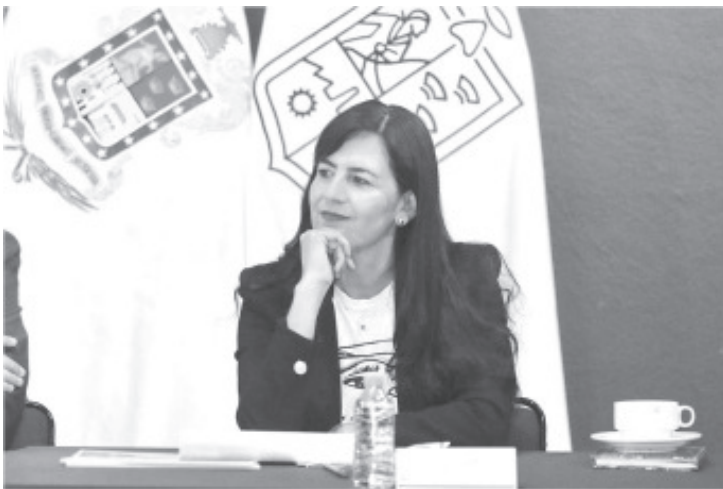
Con el compromiso de cumplir a las y los docentes, la Secretaría de Educación del Estado (SEE) trabaja para que el 30 de julio se paguen también las quincenas correspondientes al periodo vacacional, los bonos de julio y el retroactivo del incremento salarial.

En ese sentido, la autoridad educativa refrenda su compromiso con el magisterio, y agradece el trabajo del mismo durante el ciclo escolar que está por terminar.