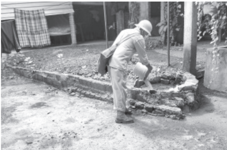
Michoacán se encuentra sin registro de defunciones por dengue, lo que lo mantiene por debajo de la medida nacional en tasa de incidencia con 1.34 contra 3.35 puntos porcentuales, de acuerdo a la información proporcionada por la Secretaría de Salud de Michoacán (SSM),

Las autoridades sanitarias, exhortan a la población a no bajar la guardia en la implementación de acciones preventivas, ya que durante esta temporada de lluvias se potencializa la reproducción de mosco Aedes Aegypti , transmisor de estos padecimientos.