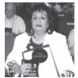
RECIBÍO RECONOCIMIENTO "ROSITA EFE" Por su Trayectoria de COLUMNISTA DE SOCIALES DEL PERIÓDICO "LA REGIÓN" Como "MUJER ZITACUARENSE QUE NOS LLENAN DE ORGULLO."