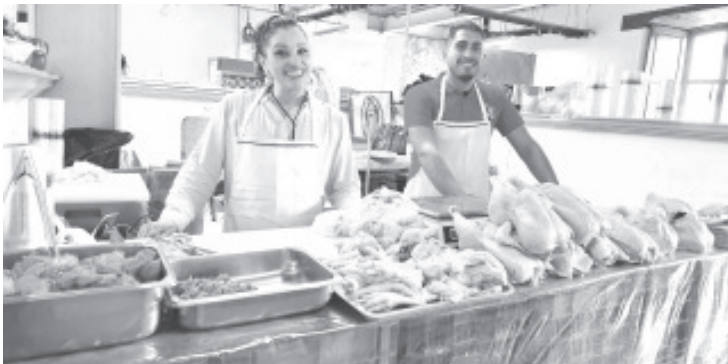
Sin incidentes ni contratiempos se realiza la reubicación de las y los comerciantes de Pátzcuaro en la plaza Gertrudis Bocanegra y en las oficinas del Ayuntamiento. Así lo informó el subsecretario de Gobernación, Juan Carlos Oseguera,

“Cada uno de los espacios fueron acondicionados de acuerdo a los requerimientos de cada comerciante, para los carniceros se les habilitaron cámaras de refrigeración, planchas para las personas que venden pollo y todo lo necesario para que su estancia temporal sea cómoda”, concluyó.