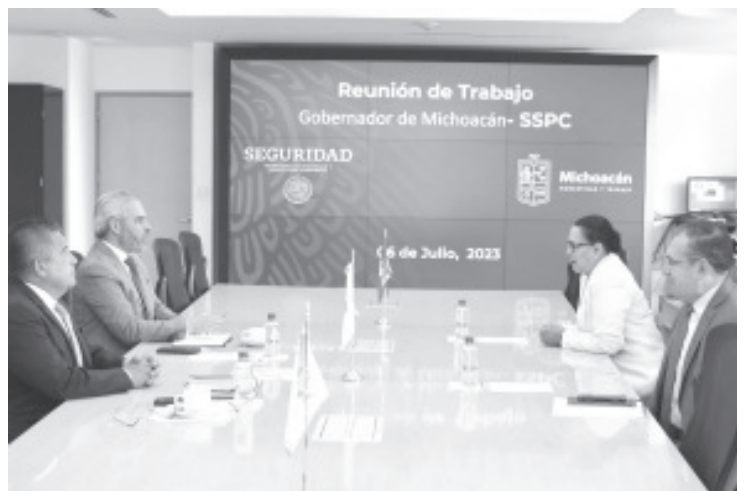
Para reforzar la estrategia de prevención y atención a la violencia, el gobernador Alfredo Ramírez Bedolla y la secretaria de Seguridad y Protección Ciudadana (SSPC) del Gobierno de México, Rosa Icela Rodríguez Velázquez, consolidarán la coordinación institucional para disminuir y combatir el delito de homicidio doloso en Michoacán.

En ese sentido, el gobernador compartió que tan solo en junio de este año se registraron 130 expedientes por este delito en la entidad, lo que representó una disminución de 40 por ciento en comparación con el mismo mes del 2022, y menos 21 por ciento de lo acumulado en mayo de este año.