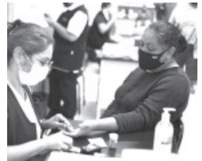
La SSM cuenta con más de 40 Grupos de Ayuda Mutua (GAM), distribuidos en unidades médicas, enfermedades crónicas.

Además, se capacita de manera permanente al personal del primer nivel de atención, para mejorar sus competencias en la prevención, detección seguimiento y control de enfermedades crónicas degenerativas.