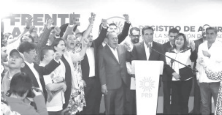
El Consejero Nacional del PRD y ex gobernador de Michoacán, Silvano Aureoles Conejo, es el primer aspirante de izquierda en registrarse para ser el responsable de coordinar los esfuerzos del Frente Amplio por México.

Morelia, Michoacán, 06 de julio de 2023.-El Consejero Nacional del PRD y ex gobernador de Michoacán, Silvano Aureoles Conejo, es el primer aspirante de izquierda en registrarse para ser el responsable de coordinar los esfuerzos del Frente Amplio por México.