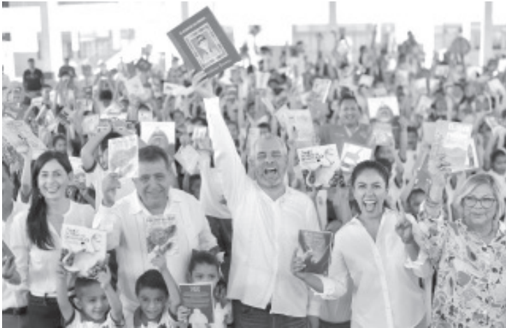
El gobernador Alfredo Ramírez Bedolla fortalece la educación en Apatzingán como una herramienta de paz y transformación social, ahora con la entrega de materiales para mejorar las condiciones educativas de más de 4 mil 900 niñas, niños y jóvenes.