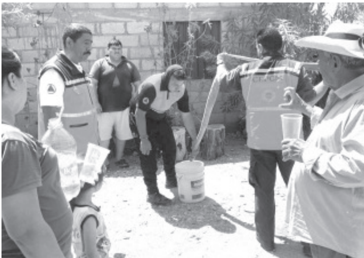
La Secretaría de Gobierno, a través de la Coordinación Estatal de Protección Civil, realiza labores de apoyo a la ciudadanía en comunidades de Huetamo.

Ante esto la Coordinación Estatal de Protección Civil recuerda el número de emergencias 9-1-1 con el objetivo de atender cualquier suceso con oportunidad.