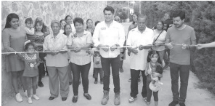
Toño Ixtláhuac entregó el primer resultado de su iniciativa #Ruta100. Se trata de un andador pavimentado en la tenencia de San Juan Zitácuaro, que beneficia a 20 familias directamente.

"Gracias a todos los zitacuarenses que trabajan de la mano del #GobiernoDeSoluciones para alcanzar una Heroica de progreso", agregó el edil zitacuarenses. Reafirmó que esta acción hará historia, al involucrar el valor de cada mano que participó en la construcción de las distintas rutas.