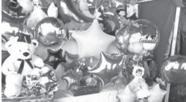
Por las graduaciones que se avecinan, comerciantes de temporada están listos para atender la demanda de arreglos de estas fechas.

De acuerdo al permiso emitido por el Gobierno Municipal, estarán en este lugar del