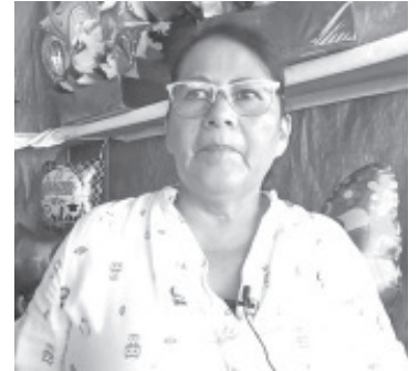
Por el momento ya comienzan a instalarse en el Jardín Constitución, integrantes de dos uniones así como independientes.

Invitó a la población a acudir a este lugar y ver los artículos que venden, seguramente habrá alguno de su agrado. Reiteró que esta unión es una de las más antiguas y es toda una tradición la venta de estos arreglos.