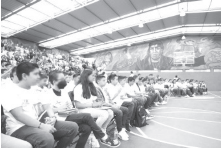
Tras un proceso de evaluación en el que participó la Contraloría Social de la Secretaría de Educación del Estado de Michoacán (SEE), la dependencia estatal dio a conocer los resultados de la Olimpiada del Conocimiento Infantil.

- La Contraloría Social acompañó el proceso para garantizar la transparencia del mismo.