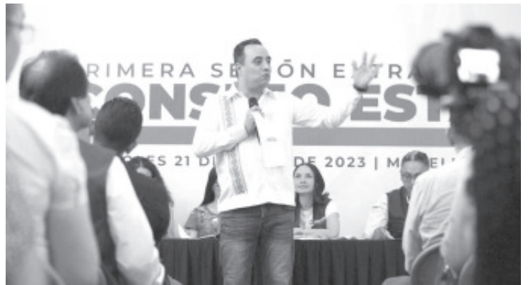
La dirigencia de Morena en Michoacán, realizó la primera Sesión Extraordinaria del Consejo Estatal, donde se priorizó que la unidad será el elemento principal para garantizar el triunfo en 2024.

Finalmente, el líder morenista destacó que las coordinaciones en defensa de la Cuarta Transformación en lo local se tendrán que someter a los lineamientos que en un futuro dicte el Comité Ejecutivo Nacional.