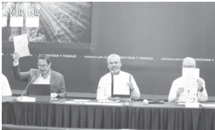
Como una vía para reconocer a los trabajadores jornaleros como parte fundamental del liderazgo que tiene Michoacán en la producción agropecuaria, el gobernador Alfredo Ramírez Bedolla y asociaciones productoras firmaron el Acuerdo de Formalización Laboral de la Agroindustria.

- Vamos a conjugar todo nuestro esfuerzo institucional y voluntad de transformación con el sector productivo, expresó el Gobernador.