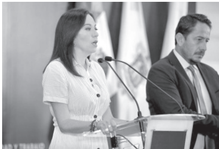
Con gobernabilidad y orden, el Gobierno de Michoacán, a través del Instituto de Educación Media Superior y Superior (IEMSySEM) logró erradicar la corrupción en el proceso de ingreso a las Escuelas Normales Oficiales del Estado, con la implementación del instrumento de evaluación Ceneval.

Asimismo, dijo, se puso orden al interior de las escuelas normales para que las actividades de los estudiantes sean meramente académicas y relativas a su formación integral profesional, en lugar de encabezar acciones delincuenciales como la retención de vehículos, el robo de mercancías o generar ambientes hostiles entre la comunidad normalista.