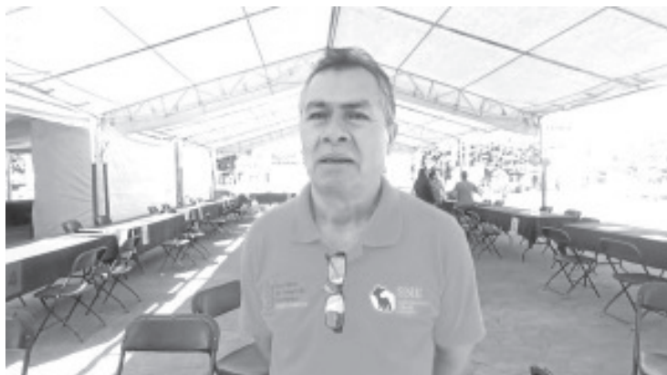
Para atender la demanda de buscadores y de empresas, el Servicio Nacional del Empleo (SNE) realizó este jueves su segunda feria de empleo del año. Cómo ya es costumbre, la actividad se desarrolló en la explanada del jardín central.

Insistió que a lo largo del año esta dependencia lleva a cabo varios eventos de este tipo y todos los esfuerzos van encaminados a atender la demanda de buscadores de empleo.