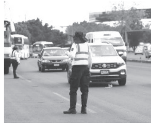
Con el objetivo de generar una cultura vial que permita la prevención de accidentes, la Secretaría de Seguridad Pública (SSP) a través de la Dirección de Tránsito y Movilidad; emite recomendaciones a conductores de vehículos, motocicletas, ciclistas y peatones.