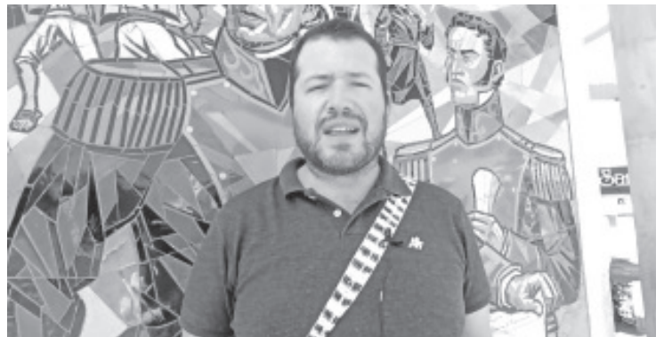
La Cámara de Diputados a nivel federal dará oportunidad a artesanos para que durante una semana puedan exhibir y vender los artículos que elaboran.

Agregó que también se tratará de crear una marca colectiva con artesanos de las comunidades de la parte alta del municipio, ya que todos los que se dedican a esta actividad tienen en común en su cosmología el venado y se buscará de sacar provecho para valorizar más su trabajo.