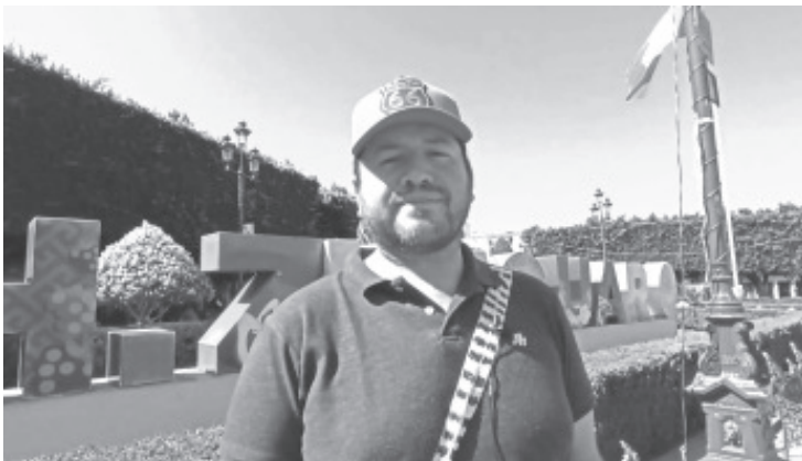
El próximo domingo en punto de las 8:00 de la mañana, se hará una limpieza del camino de acceso a la zona arqueológica de Ziráhuato de los Bernal-San Felipe los Alzati.

Aseguro que el encargado de la zona, dará un pequeño recorrido a quienes acudan y sean parte de esta noble causa. La idea es impulsar este lugar para que la sociedad reconozca el valor histórico y turístico que tiene este lugar.