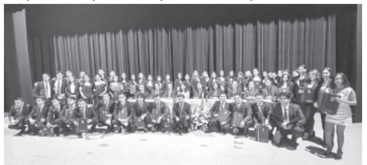
La Universidad Michoacana de San Nicolás de Hidalgo es la gran forjadora en la entidad de las mujeres y hombres del Derecho, para ejercerlo y hacerlo valer, recalco la diputada Gloria Tapia Reyes, vicecoordinadora del Grupo Parlamentario del Partido Revolucionario Institucional en la LXXV Legislatura del Congreso del Estado.

"Por ello siempre será de justicia reconocer la labor de docentes y de la comunidad nicolaita para forjar en el día a día, dentro de las aulas, el capital humano que posibilita la construcción de mejores escenarios para Michoacán, para el futuro de todas y todos en esta noble tierra".