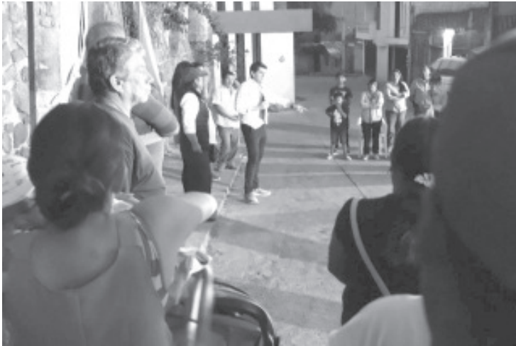
El alcalde de esta ciudad, Juan Antonio Ixtláhuac demuestra una vez más el interés en conocer de primera mano las inquietudes y necesidades de la gente.

- Este fin de semana, Toño Ixtláhuac visitó la tenencia más grande de nuestro municipio, donde escuchó y atendió a vecinos de esta demarcación.