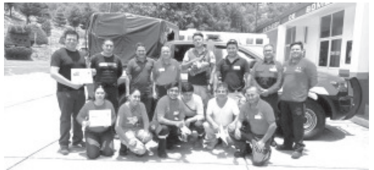
En un esfuerzo por mejorar su capacidad de comunicación con personas sordas, los Bomberos de Zitácuaro llevaron a cabo una capacitación en Lengua de Señas Mexicana. La sesión tuvo lugar en la Sub-Base de Bomberos, ubicada en los Terrenos de La Feria, y contó con la participación de 12 elementos del cuerpo.

Bomberos Zitácuaro reafirma su compromiso de estar siempre en constante preparación y capacitación para garantizar la seguridad y el bienestar de la comunidad. Con acciones como esta, demuestran su dedicación y disposición para ir más allá en su labor de servir y proteger.