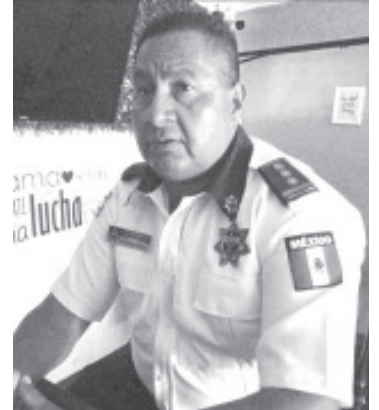
A partir de esta semana, la Dirección de Tránsito Municipal implementará una campaña intensiva para concientizar a motociclistas y automovilistas a que respeten los reglamentos vigentes.

Insistió en que se debe crear una cultura de responsabilidad entre quienes conducen cualquier tipo de vehículo, ya que al manejar está en riesgo su vida y la de su acompañante.