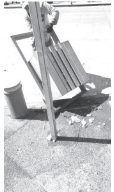
Personal de limpia retiró 7 contenedores para basura de mano en Avenida Revolución Sur, la semana pasada fueron 2, por lo que ya son un total de 9.

A los ciudadanos que tengan alguna inconformidad, los invitó a acercarse a la oficina y exponer sus problemas, seguramente se buscará la forma de darle solución.