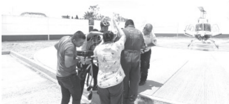
La Dirección de Servicios Aéreos de la Secretaría de Seguridad Pública (SSP), llevó a cabo un traslado aéreo exitoso de un paciente neonato, desde el municipio de Huetamo hasta un nosocomio de la capital Michoacana.

El personal de la SSP se encuentra a su servicio las 24 horas del día y todo el año, a través de la línea de Emergencias 911.