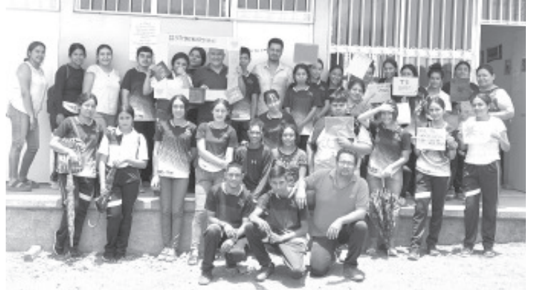
Más de 200 mil estudiantes de secundaria y nivel medio superior de todo el estado participaron en la jornada nacional contra las adicciones Si te drogas te dañas, que se llevó a cabo en Michoacán, dio a conocer la Secretaría de Educación del Estado (SEE).

La jefa del sector educativo hizo un llamado a docentes, estudiantes, trabajadores y padres de familia a sumarse a esta campaña y en equipo trabajar por la prevención, en beneficio de los jóvenes de Michoacán.