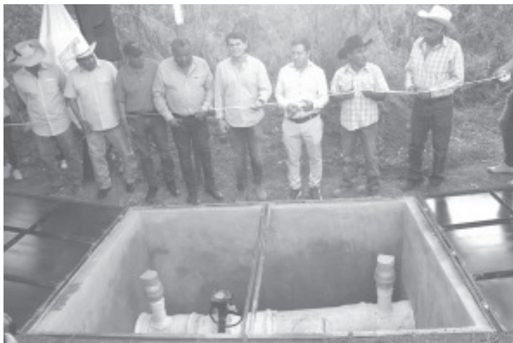
Este sábado en la tenencia de Zirahuato fue inaugurada la segunda etapa de la red de agua que beneficiará a los habitantes de Zitácuaro y Jungapeo.