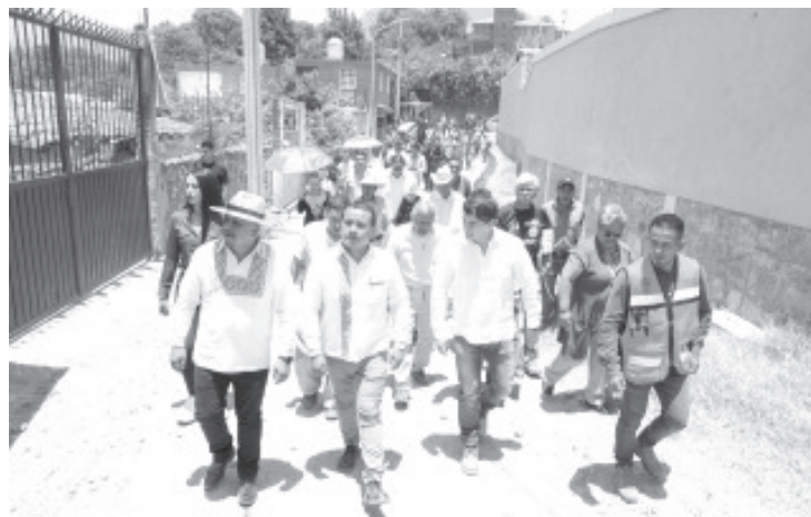
El trabajo conjunto y la coordinación entre el estado y los municipios da buenos resultados y beneficios para las y los michoacanos, aseguró el secretario de Gobierno, Carlos Torres Piña, tras realizar una gira de trabajo por Zitácuaro, Senguio y Ocampo

"La agenda municipalista es permanente, nuestro compromiso y nuestra vocación nos lleva a continuar con el trabajo conjunto con los ayuntamientos, lo que nos ha permitido dar resultados en la transformación de Michoacán", concluyó.