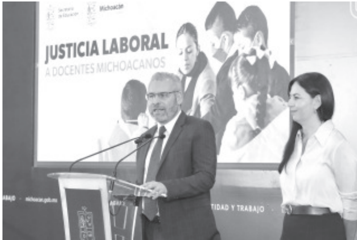
Como un acto de justicia social, el gobernador del estado, Alfredo Ramírez Bedolla, anunció esta mañana la basificación de 7 mil 712 trabajadores al servicio de la educación, sin ningún tipo de intermediarios.