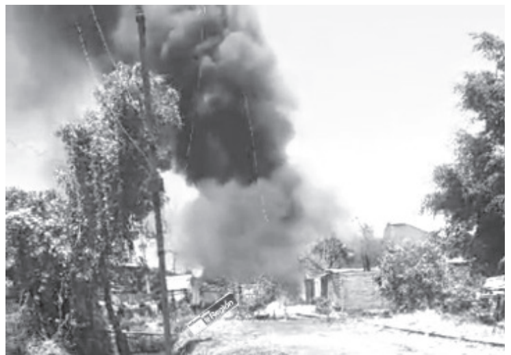
Elementos de bomberos de Zitácuaro, atendieron de forma oportuna un incendio al interior de un taller de maquinaria agrícola, ubicado sobre el libramiento J. Múgica.

Luego de realizar labores de enfriamiento para evitar que el incendio se reavivara, los rescatistas se retiraron. Hasta el momento se desconocen las causas que provocaron el incendio.