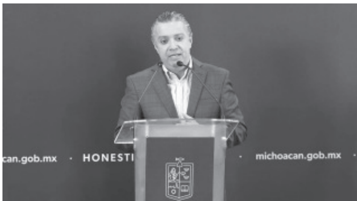
Hasta la fecha, 111 mil 845 vehículos de procedencia extranjera se han regularizado en Michoacán, de los cuales 34 mil 982 operaciones corresponden al ejercicio 2023, lo cual dará certeza jurídica a sus propietarios y ofrecerá mayor seguridad a la ciudadanía al contar las autoridades con un padrón confiable que ofrezca la identidad de cada unidad.

Finalmente, el responsable del manejo de las finanzas públicas en Michoacán, proporcionó la ubicación de los 13 módulos en los que la ciudadanía puede regularizar sus vehículos de procedencia extranjera: recinto ferial e Instituto de la Infraestructura Física del Estado, en el caso de Morelia; Apatzingán, Coahuayana, Huetamo, Jacona, La Piedad, Lázaro Cárdenas, Maravatío, Sahuayo, Uruapan, Zacapu y Zitácuaro.