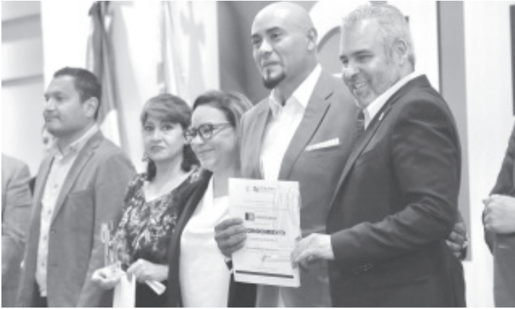
Al presidir el acto con motivo del 31 Aniversario del Instituto de Capacitación para el Trabajo del Estado de Michoacán (Icatmi), el gobernador Alfredo Ramírez Bedolla, señaló que se brindarán más espacios de capacitación para alcanzar a 40 mil michoacanas y michoacanos.

- Celebra gobernador 31 Aniversario del Instituto de Capacitación para el Trabajo.