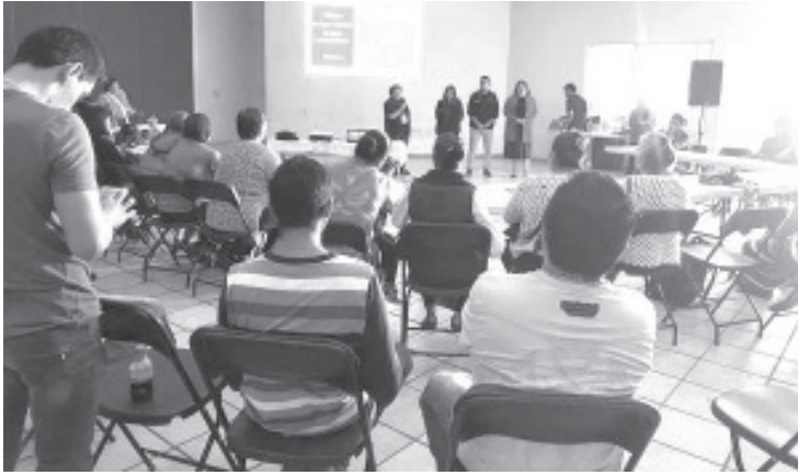
Artesanos de las diferentes comunidades, así como de otros municipios recibieron capacitación por parte de personal de la COEPRIS, esto con el fin de que no utilicen plomo en sus procesos.

- Es un programa que lleva muchos años y ya ha llegado a todo el estado