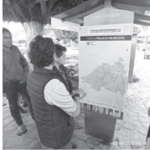
La Comisión Coordinadora del Transporte, autoridades municipales y tres organizaciones civiles crearon un mapa de las diferentes rutas de transporte que existen en la ciudad. Con dicha acción se pretende que ciudadanos tengan a la mano esta información y además mejorar este rubro.

pueden conocer información puntual, como el hecho de que 74 rutas mueven al 20% de la población, el 40% camina y son candidatos al uso del transporte público y se debe trabajar