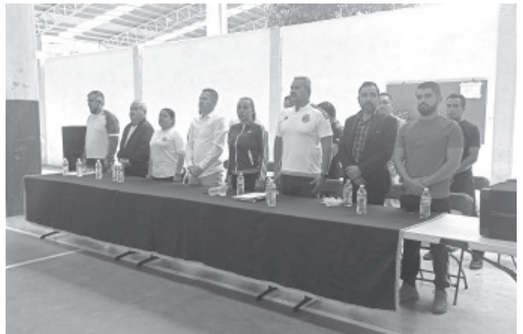
Como parte de los festejos del Día del Maestro, en Zitácuaro se llevaron a cabo los Juegos Magisteriales Regionales, en dónde maestros participaron en encuentros de fútbol, básquetbol y voleibol, tanto varonil como femenil.