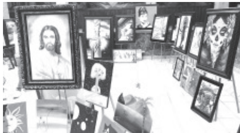
60 obras de PINTURAS AL OLEO En EXPOSICIÓN Denominada «LIBRE EXPRESIÓN» En los Patios de la Presidencia Mpal. «JESÚS SALVA» «CRISTO CON CORONA DE ESPINAS» y «PAISAJE INVERNAL».