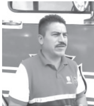
Ante la existencia constante de accidentes de motocicletas, el Cuerpo de Bomberos hace un llamado a quienes usan este tipo de transporte a extremar las medidas de prevención y al uso de medidas de seguridad, como el casco.

Los que más tienen accidentes son jóvenes que van desde los 15 hasta 30 años los más recurrentes, en menor cantidad gente de 60 años que van en estado de ebriedad.